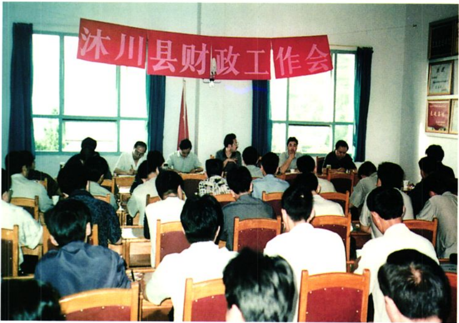
沐川县财政工作会