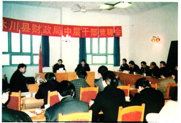
财政局中层干部竞聘会