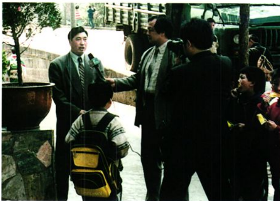
财政局长蒲四维接受电视台记者采访