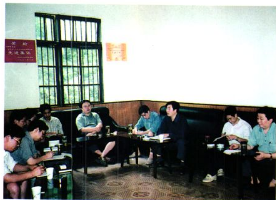
财政局领导和中层干部到联系镇 — 大楠召开现场办公会