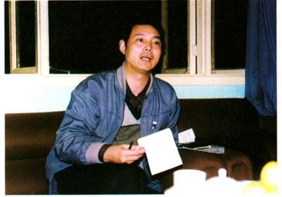
省财政厅厅长李达昌来沐川视察工作