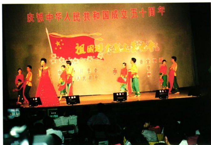
财政局职工庆祝建国50周年文艺演出