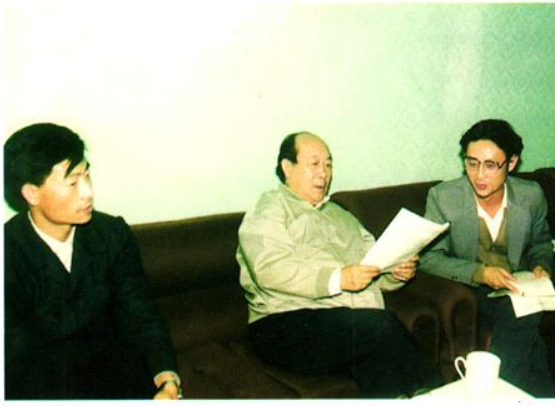
财政部副部长田一农(中)来沐川视察工作