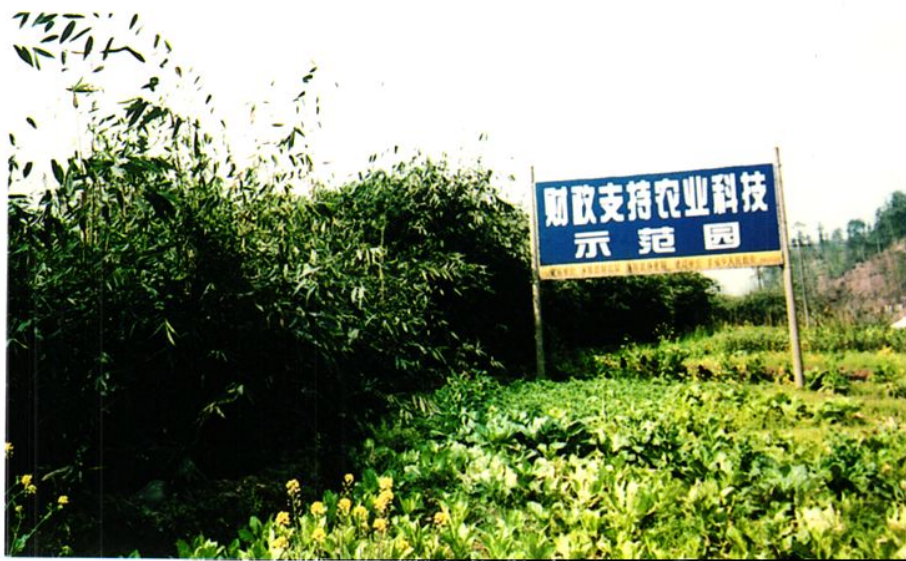
财政支持农业科技示范园