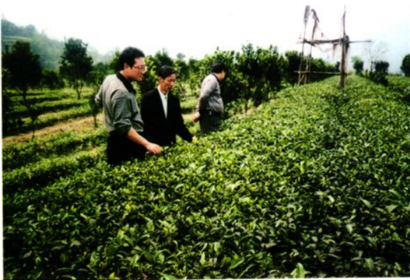
财政局领导检查优质茶园