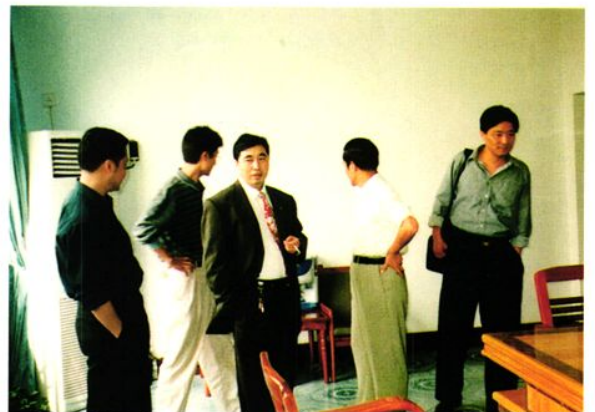
市文明委领导检查沐川县 财政局文明单位创建工作