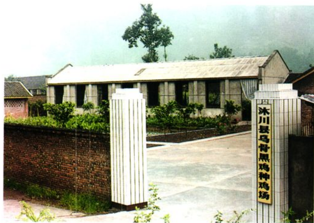
财政科技产业化扶贫发展 - 沐川乌骨黑鸡