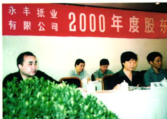
财政局领导代表国有股出席股东大会