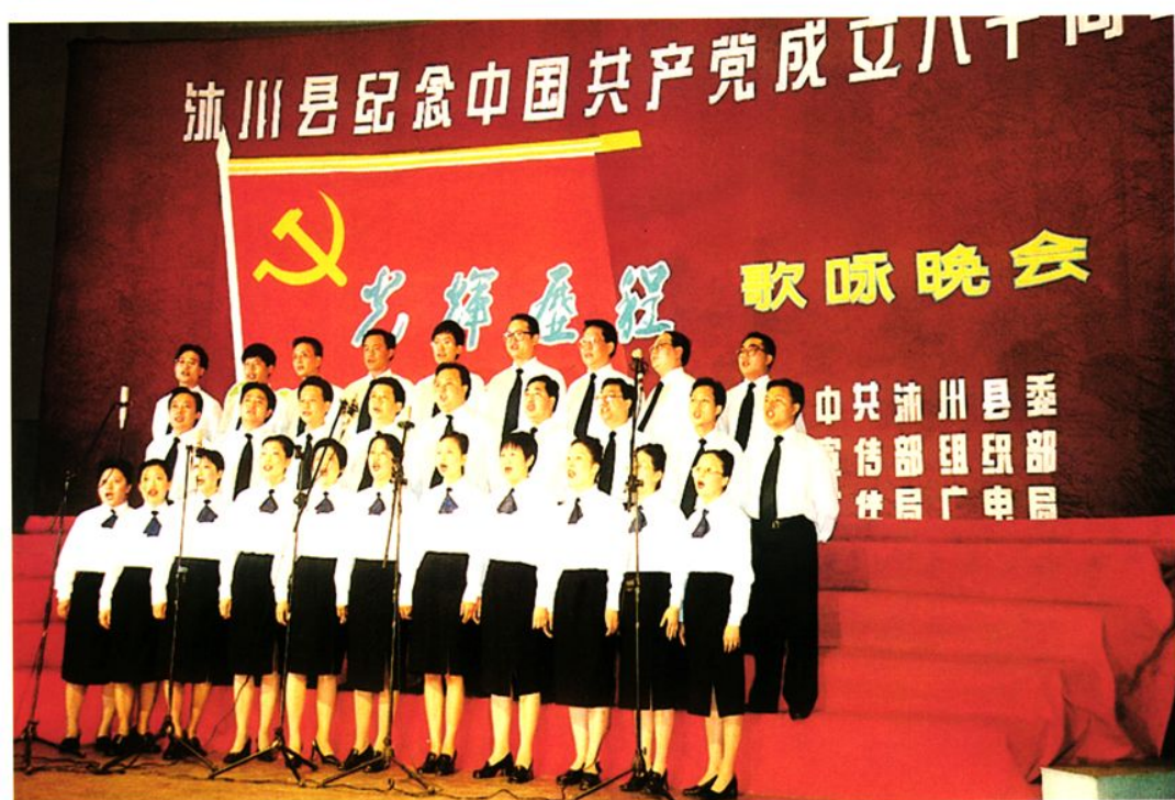
局机关全体人员参加歌咏晚会