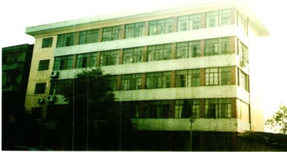
财政局机关办公楼