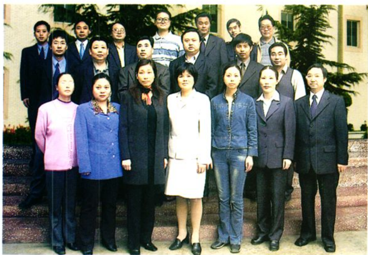
2000年财政局全体干部、职工