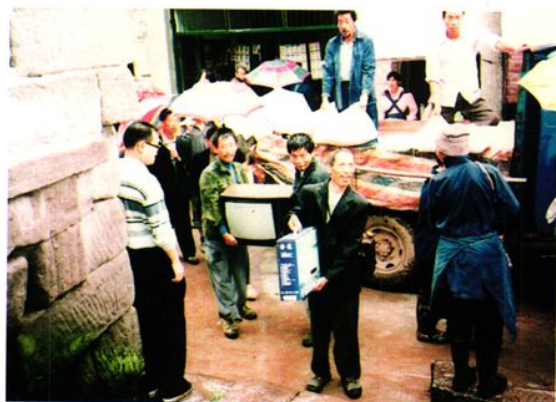
财政支持大楠镇三级联创