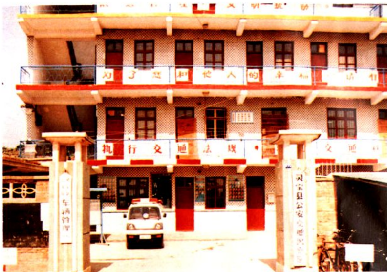
灵宝县公安交通警察队