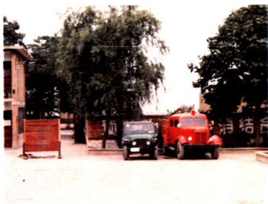
灵宝县消防中队大院