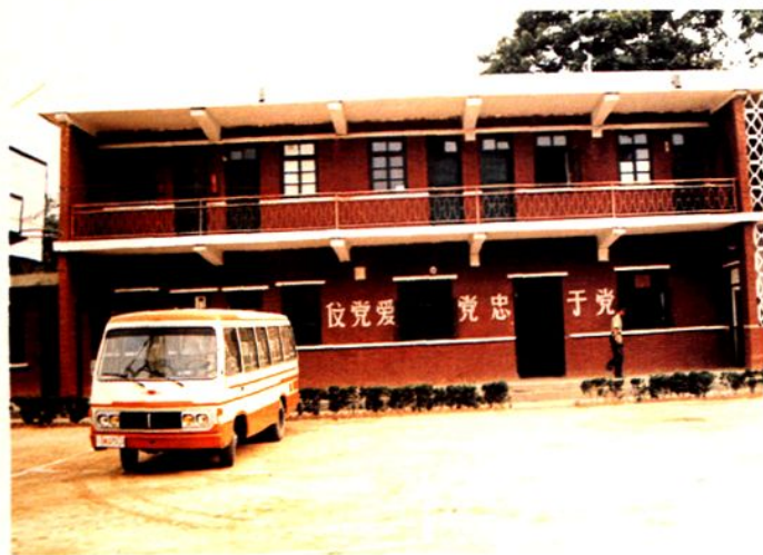
灵宝县武警中队营房