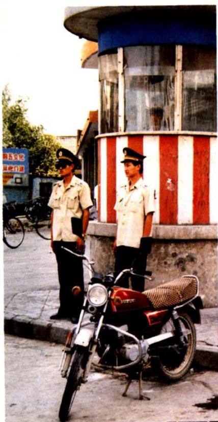
灵宝县城新灵、宏农十字街口交通岗亭