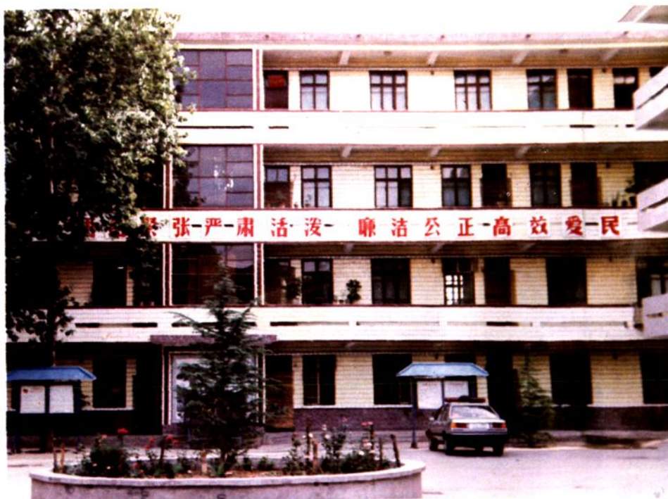
灵宝县公安局办公大楼