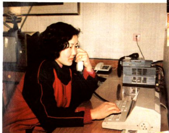
灵宝县公安局 250 门程控电话总机室。