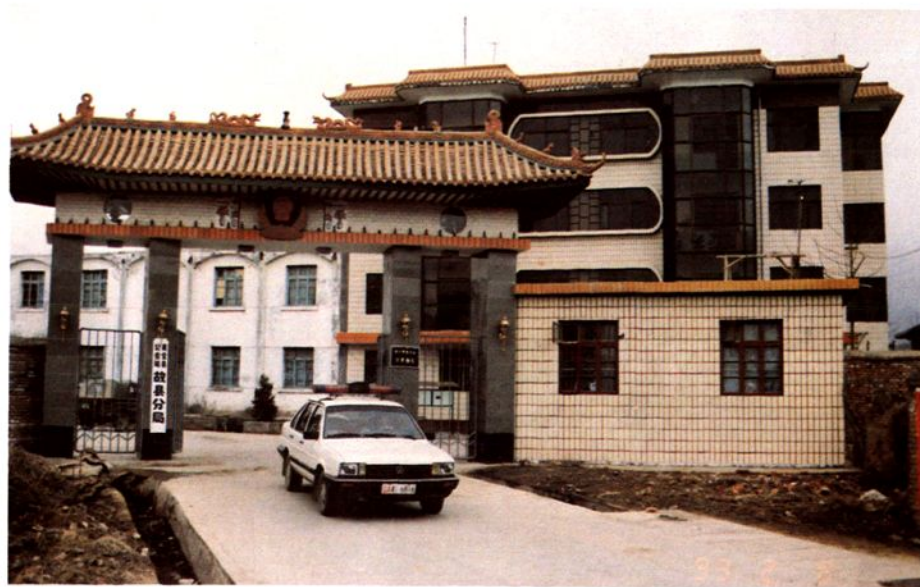
灵宝县公安 局故县分局