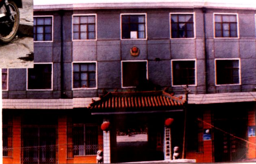
灵宝县公安局城关派出所