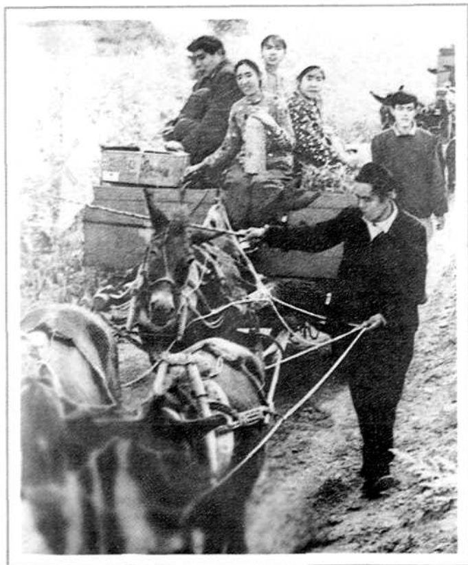
沁源人民医院流动医院在巡回医疗途中