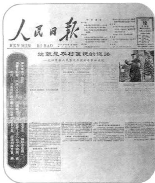
1965年11月12日，《人民日报》头版头条发表沁源县流动医院模范事迹的长篇通讯“这就是农村医院的道路”，并配发社论“社会主义农村医院要这样的正规化”