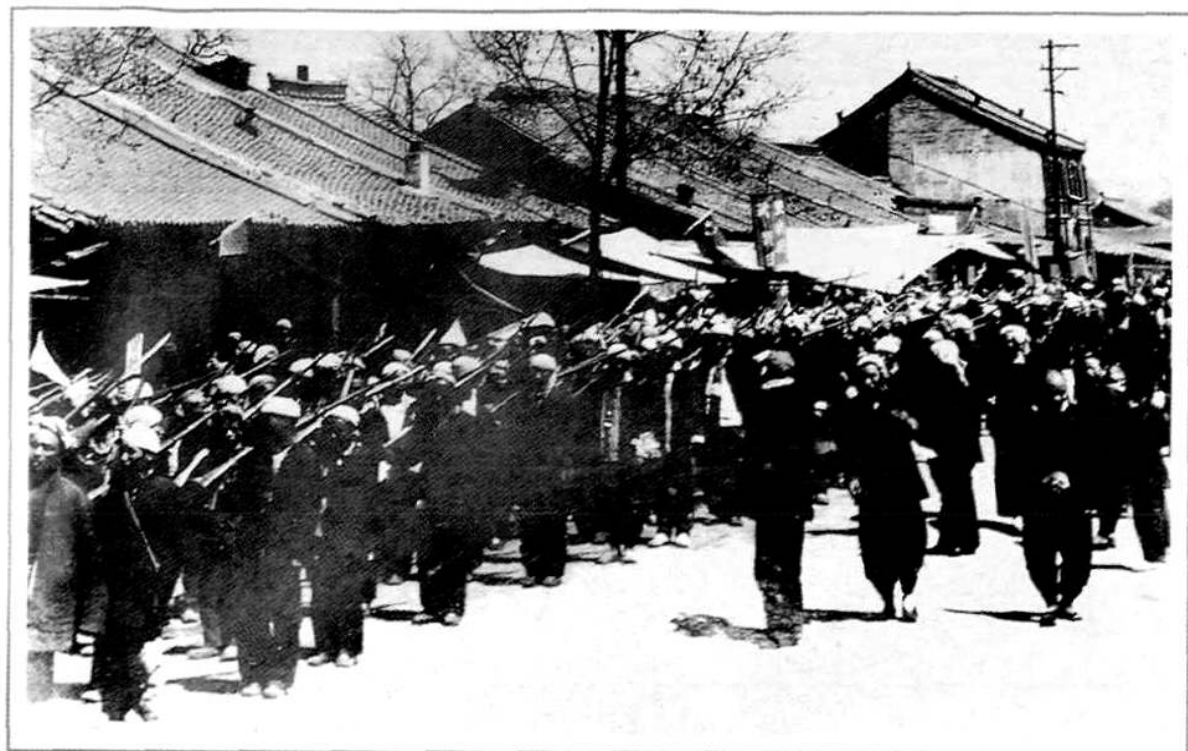
沁源城关民兵在县城举行庆祝开国大典游行