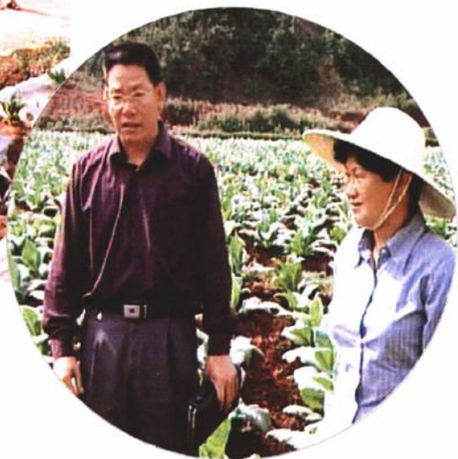
2003年5月,副省长程映萱(右 一)到江川视察烤烟生产