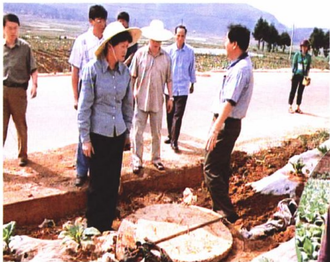
2003年5月,副省长程映萱(前左一) 到江川视察小水窖建设