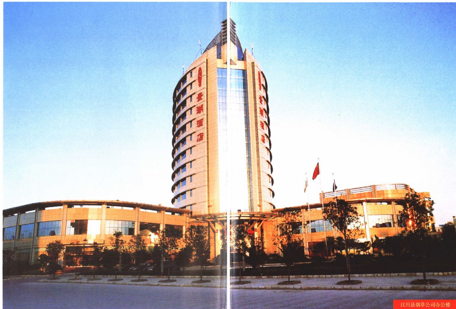
江川县烟草公司办公楼