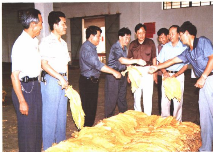
1998年9月6日,玉溪市委书记杨崇勇(左四)到江川视察烤烟生产