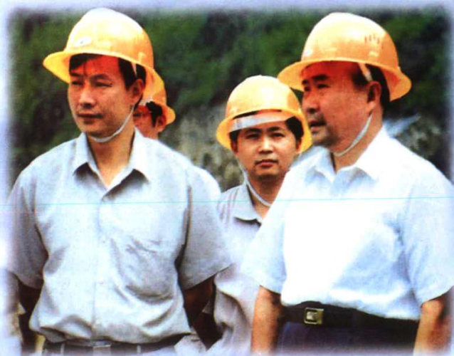
建设部副部长、原金华市委书记仇保兴(左)和省委书记李泽民(右一)在沙畈水库工地上。