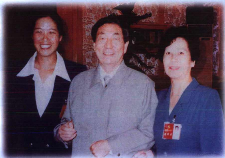
国务院总理朱镕基(中)接见参加十五大金华县代表沈云华(右)