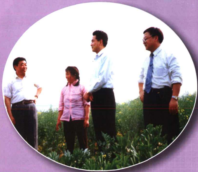
金华县委书记楼国华(左三)、人大常委会主任姜义元(左一)深入田头和农民亲切交谈。