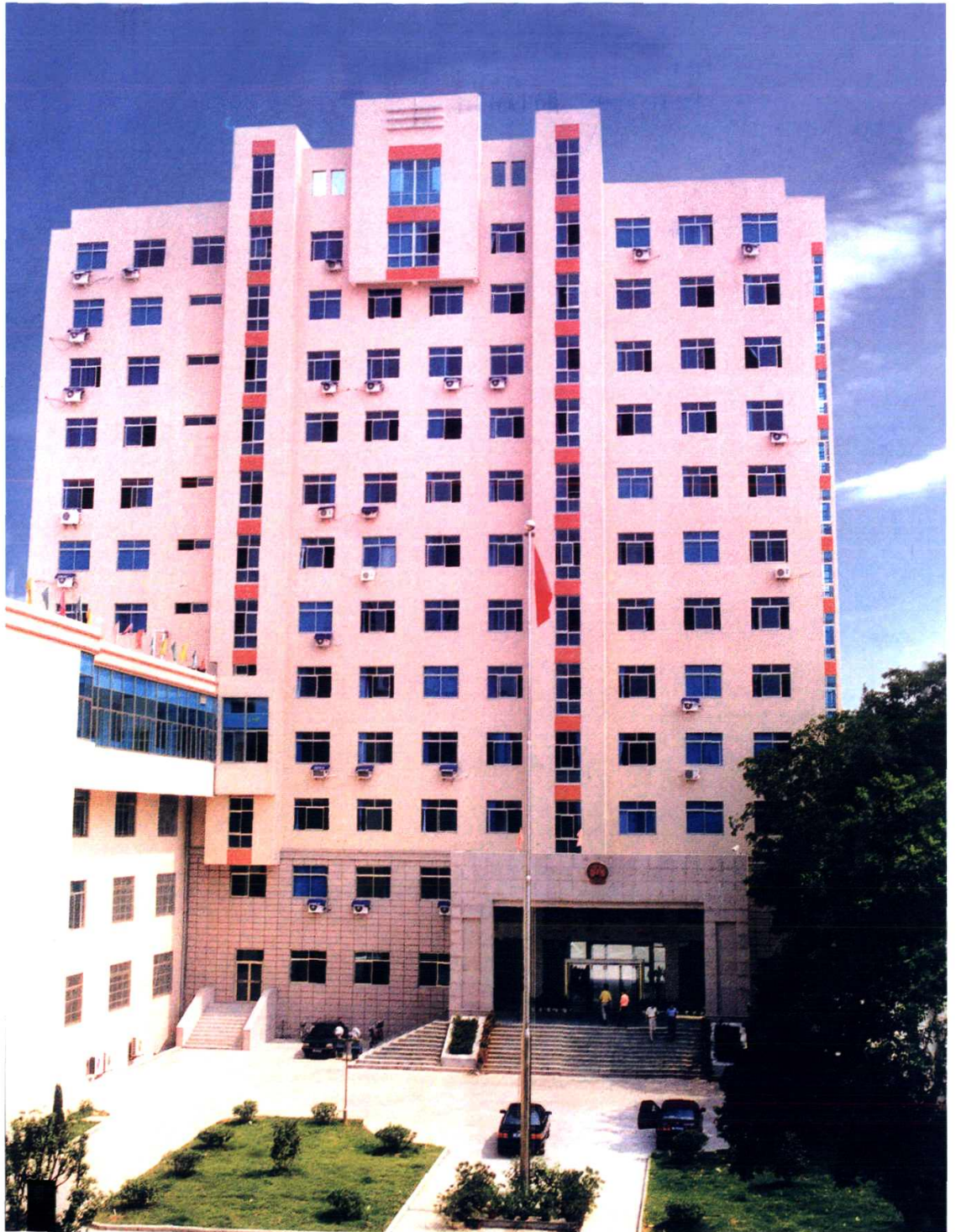
金华县政府机关大楼