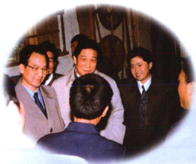
原中共中央政治局候补委员、中央书记处书记、现任国务院总理温家宝(左), 省委副书记、常务副省长柴松岳(中), 在金华县农民家了解粮食生产情况。