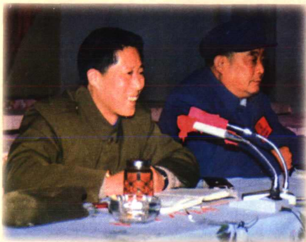
金华县委书记赵仲光(左)在全县干部会议上作报告,右为人大常委会主任徐正接。