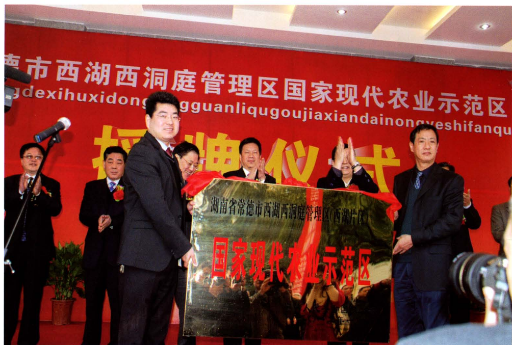
2012年3月7日，西湖西洞庭国家现代农业示范区授牌仪式