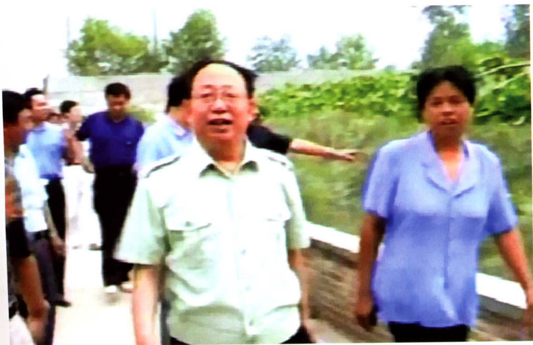
2001年，省委书记杨正午在汪氏养猪场考察