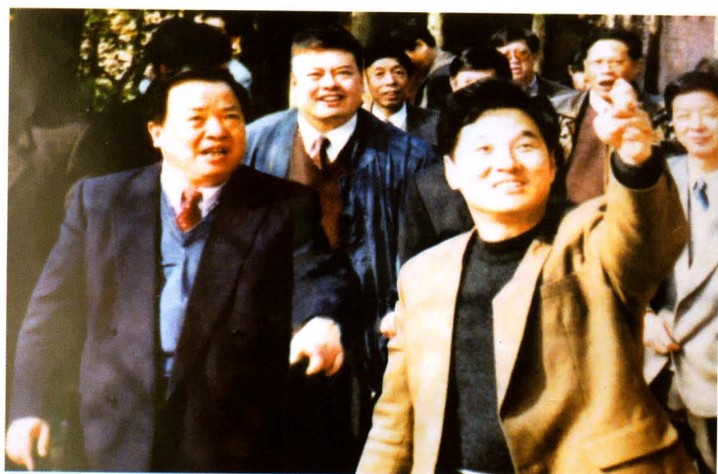
1998年12月，省委常委、常务副省长周伯华（左一）到西湖考察