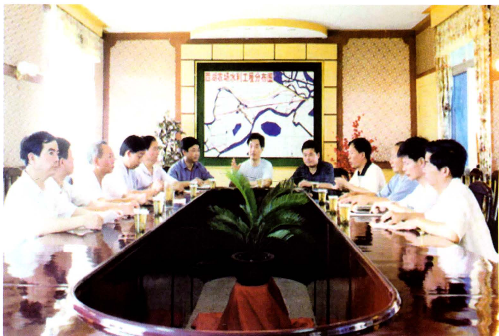
1999年7月，中共西湖管理区委领导班子研究工作