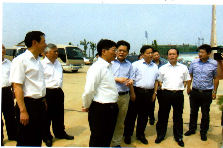
2013年6月8日，省委副书记孙金龙（左三），副省长盛茂林（左二）考察区园区建设