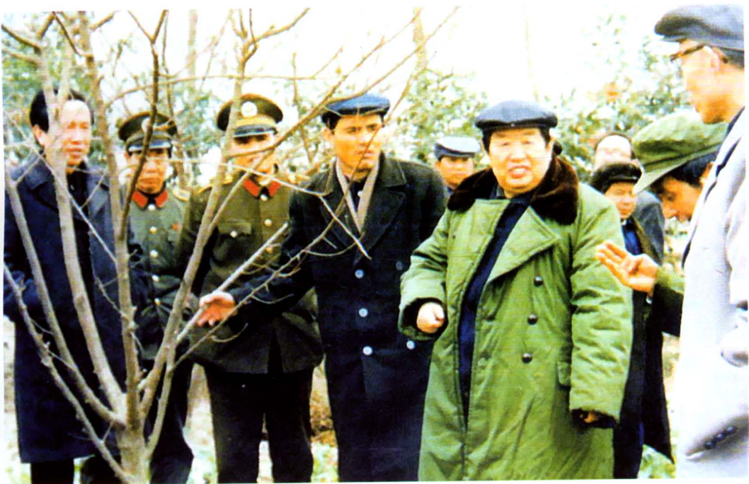
1989年1月，省委书记熊清泉到西湖农场考察工作