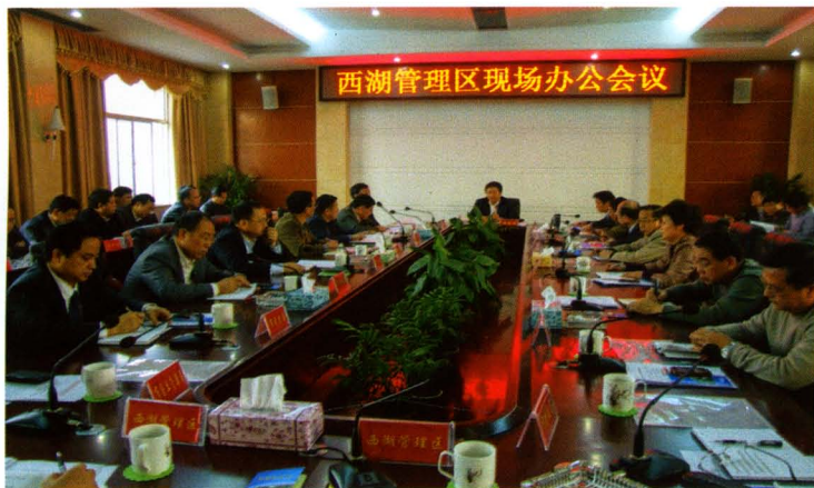
2012年10月25日，常德市委书记卿渐伟在西湖主持现代农业示范区建设办公会