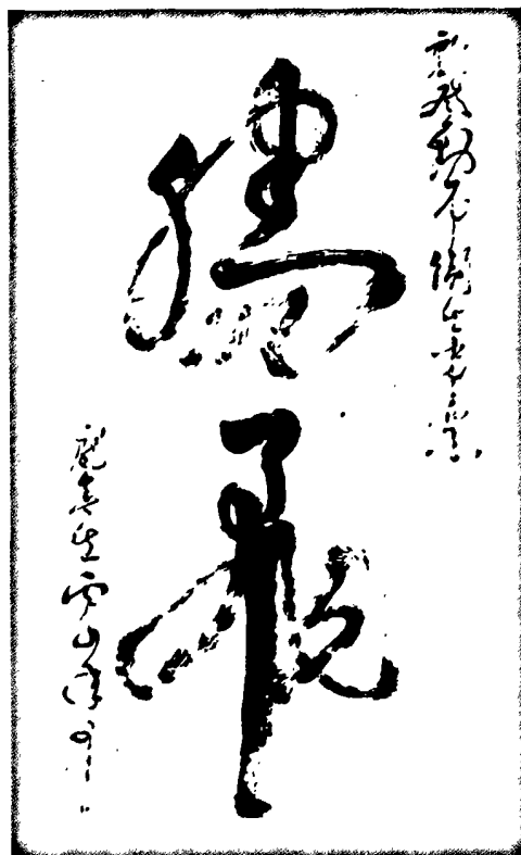
河南省中医药管理局局长庞春生题词