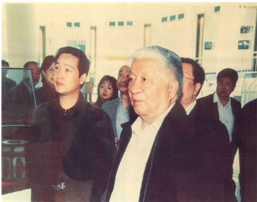
2004年10月20日 全国政协副主席王文元（左二）在镇平县县委副书记王宛楠（左一）的陪同下，参观镇平县玉文化博物馆和玉雕湾。