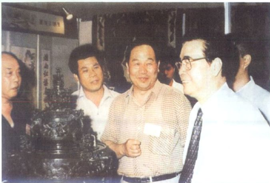
1995年7月1日 国务院总理李鹏（右一）在中国乡镇企业第三届出口产品博览会上，参观镇平玉雕产品。