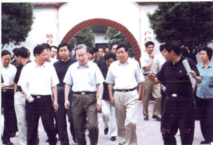
2004年7月12日 中共中央委员、国家人口与计划生育委员会主任张维庆（前排左二）一行在河南省副省长王菊梅、南阳市市委书记何东成、市长黄兴维以及镇平县县委书记赵金文等人的陪同下，视察镇平县玉文化中心。