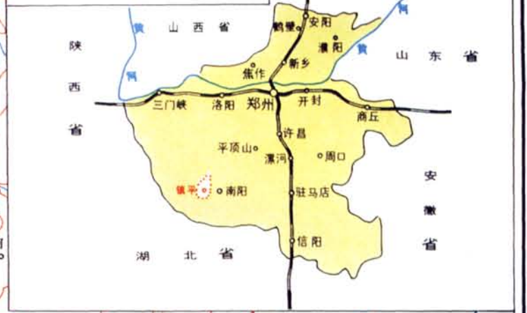
镇平县在河南的位置