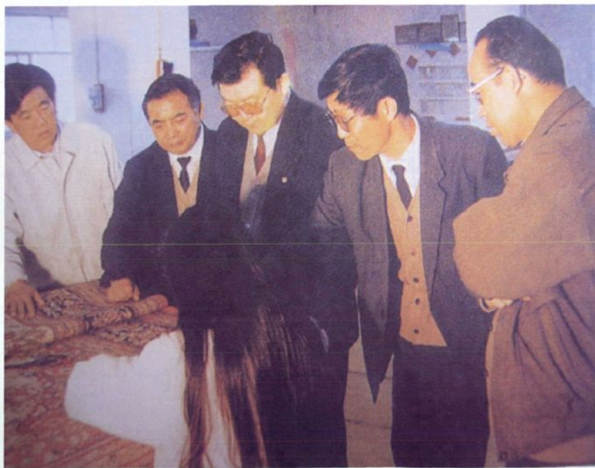
1991年4月22日至25日 河南省省长李长春（右三）一行在镇平县县委书记梁绪兴（右二）陪同下，到镇平县珠宝玉雕大世界等地视察工作。