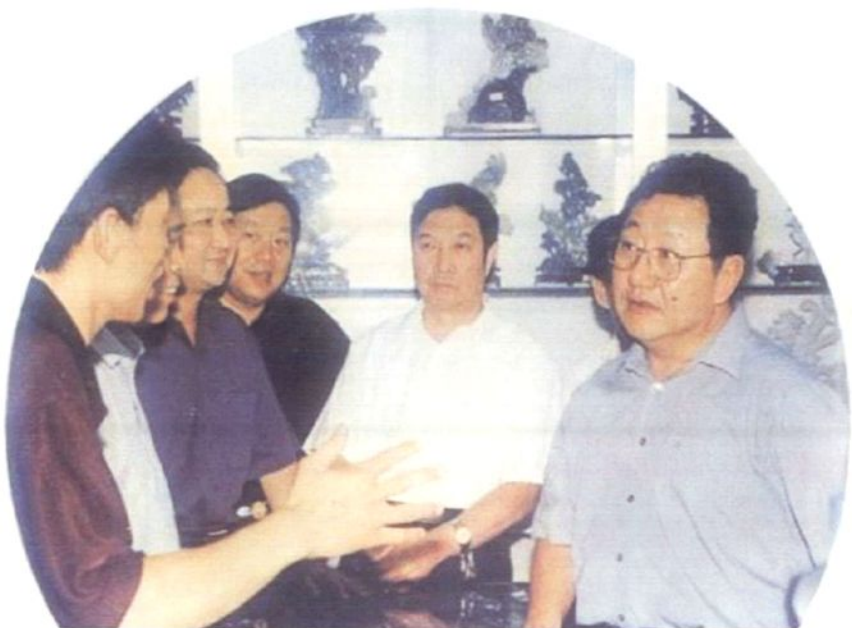
2001年8月2日 河南省省委书记陈奎元（右一）和省委常委、秘书长李柏栓到镇平县石佛寺玉雕湾进行视察。