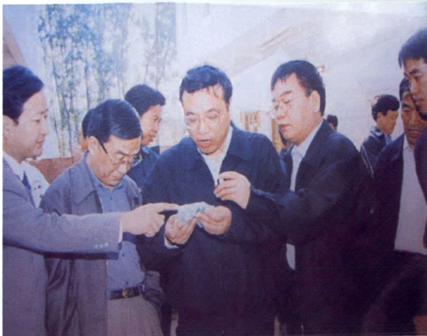
2001年10月10日 河南省省长李克强（左四）、省政府秘书长刘其文等一行在市县领导的陪同下，到镇平县石佛寺玉雕湾视察工作。