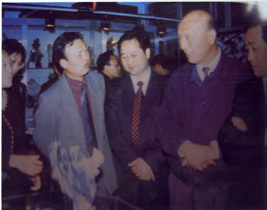
1986年4月4日 原国家科委副主任郭树言（右二）到镇平县石佛寺玉器厂视察工作。