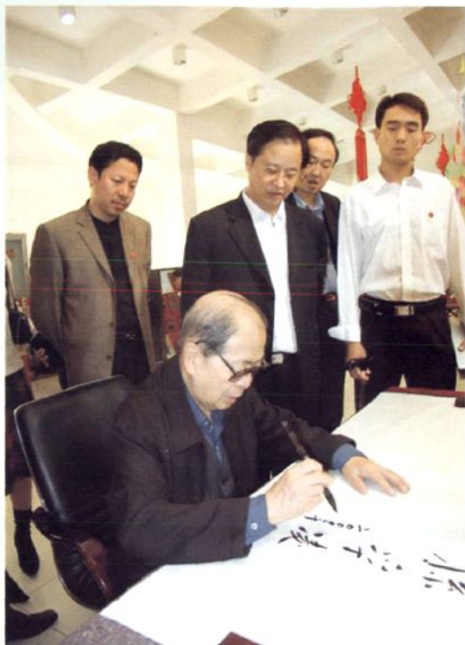
2004年10月12日 全国政协副主席孙孚 凌在镇平县县委书记 赵金文的陪同下，参 观镇平县玉文化博物 馆并题词。