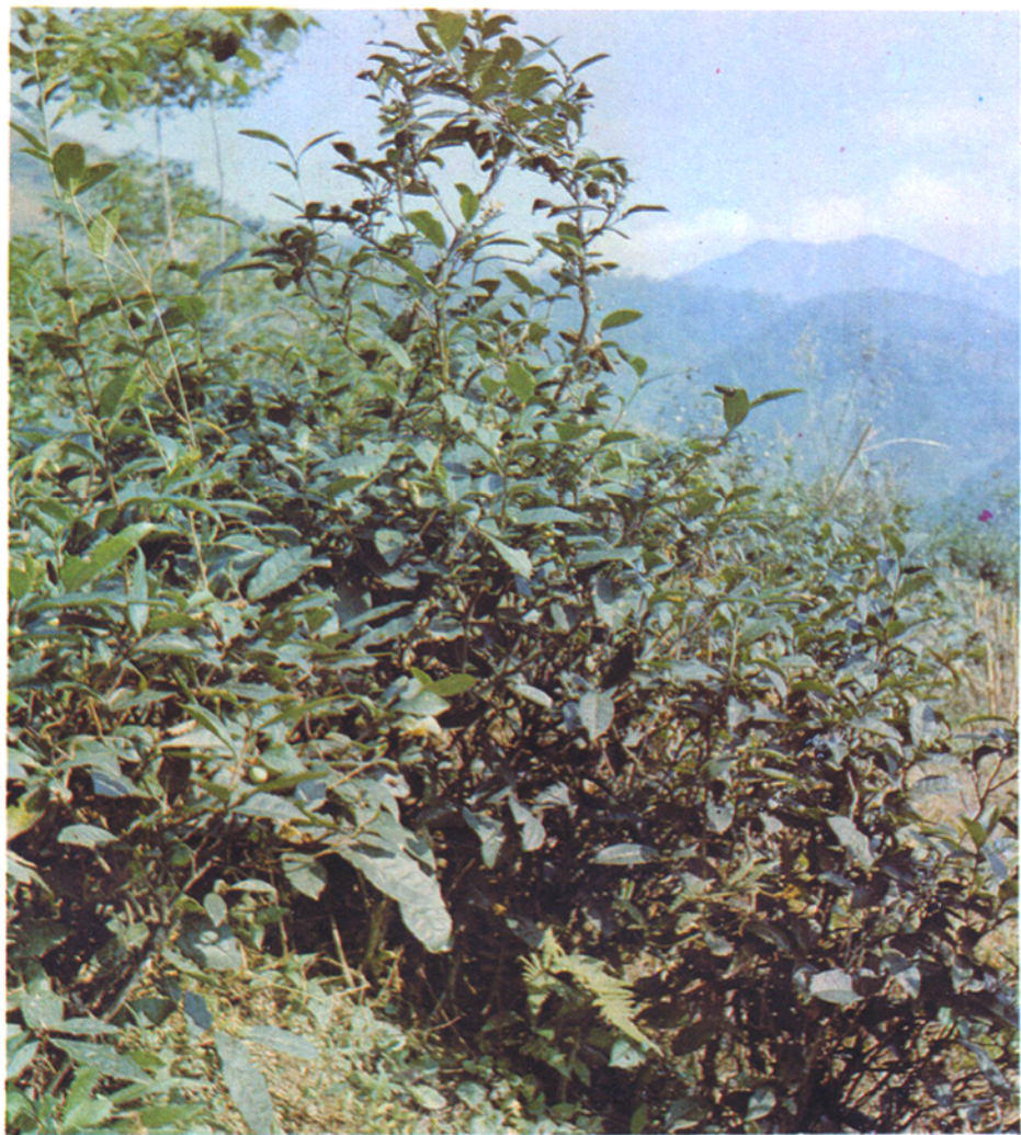
荃华公 社茶山一角。