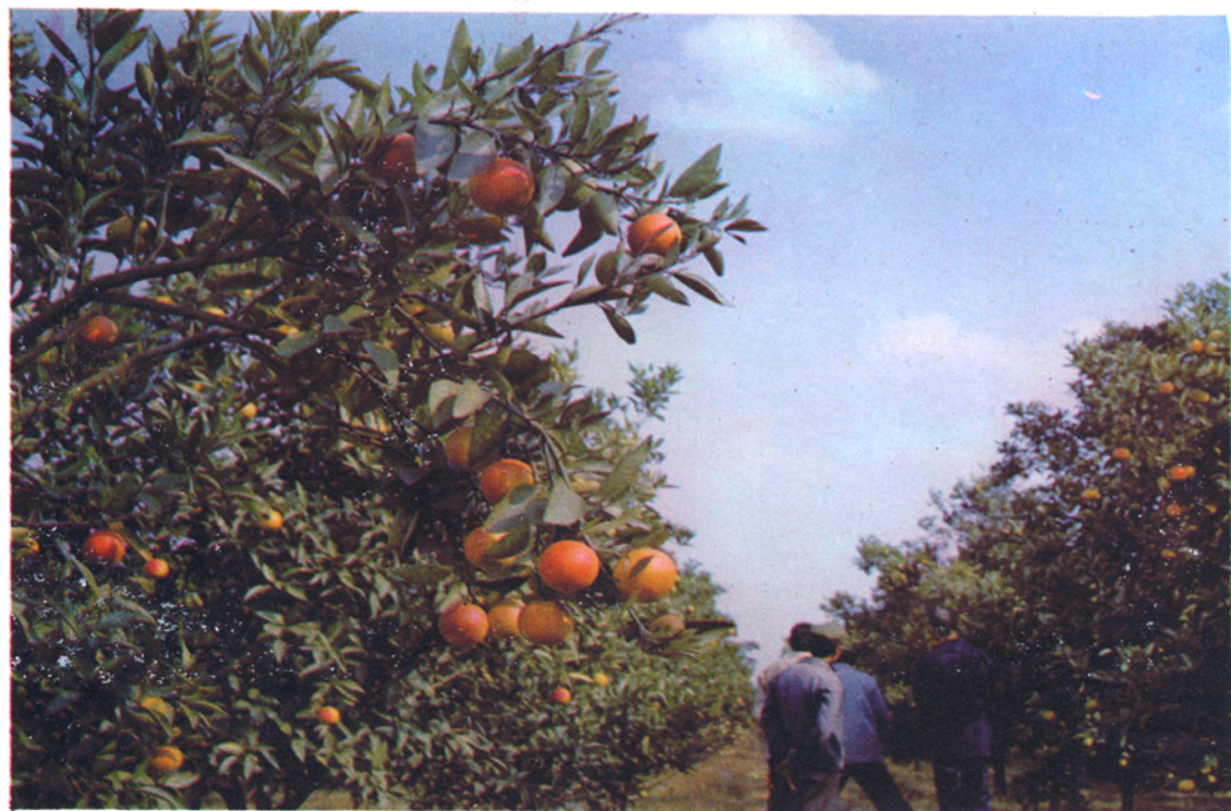
双盛乡五大队队办果园。