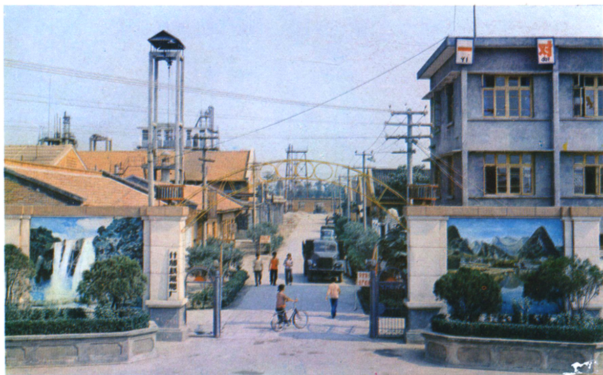
以天然气生产之化工企业氮肥厂。