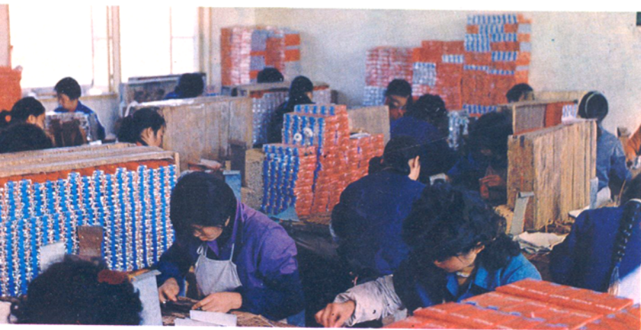
菸厂一分厂包装车间。