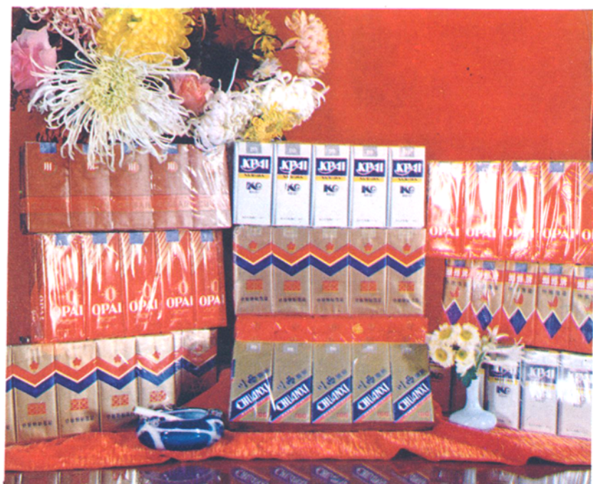
什邡烟厂主要产品