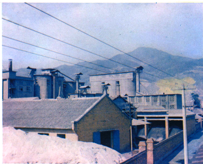
年产4万吨的县地方国营水泥厂貌。