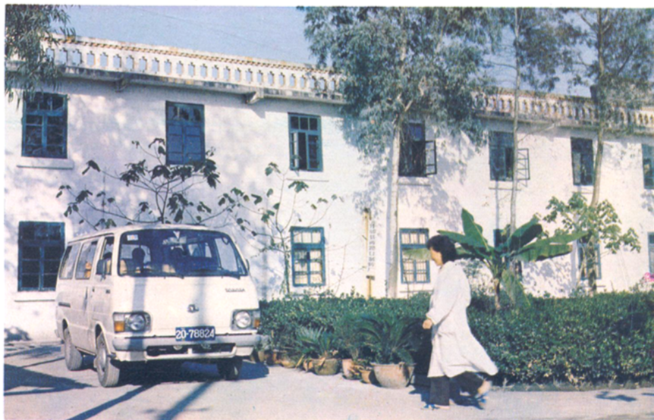
公社企业两路口制药厂