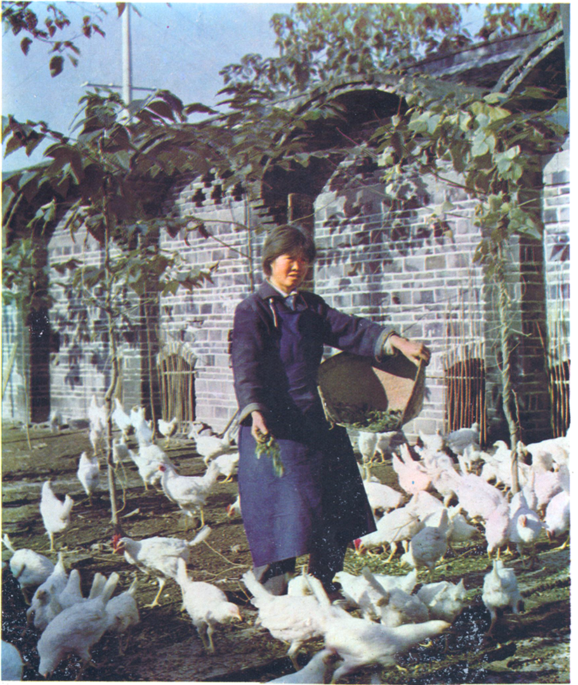
财政支援双户，洄澜公社养鸡专业户之一。