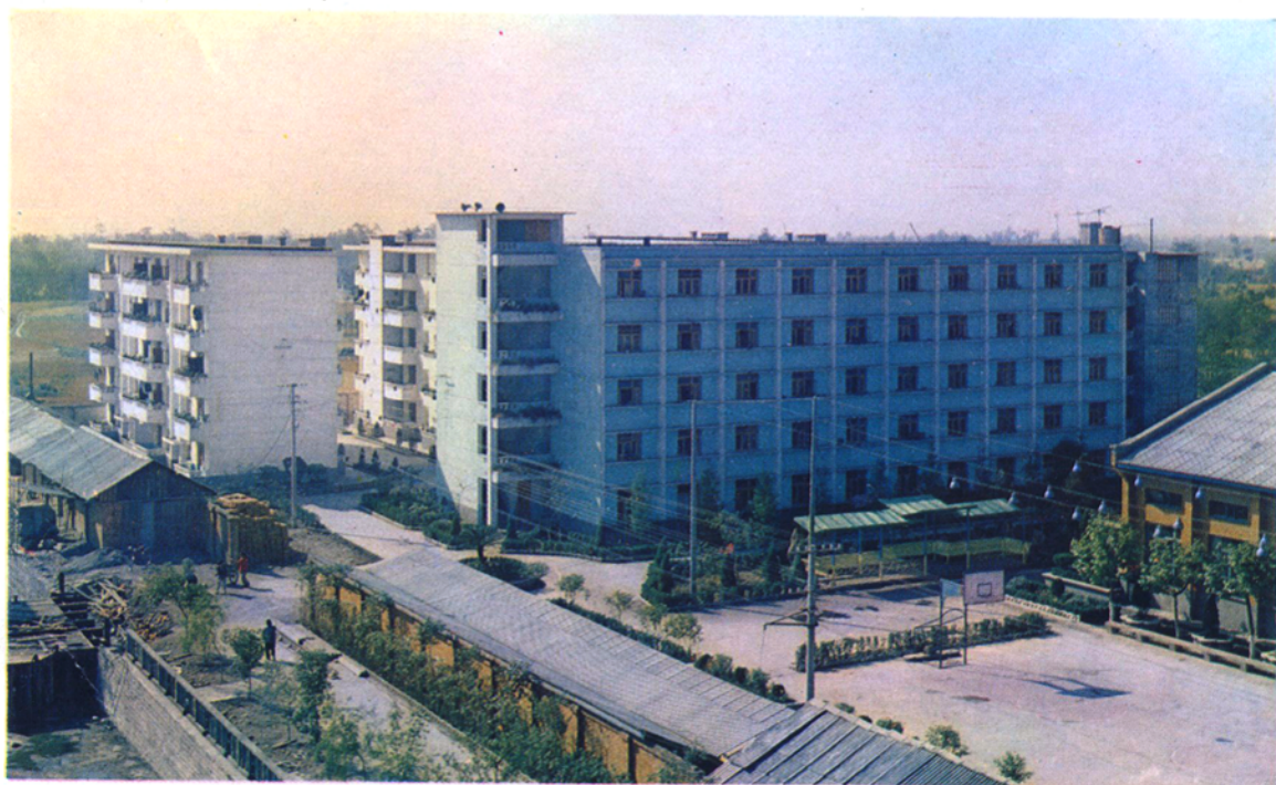
黄磷厂生活区新貌。