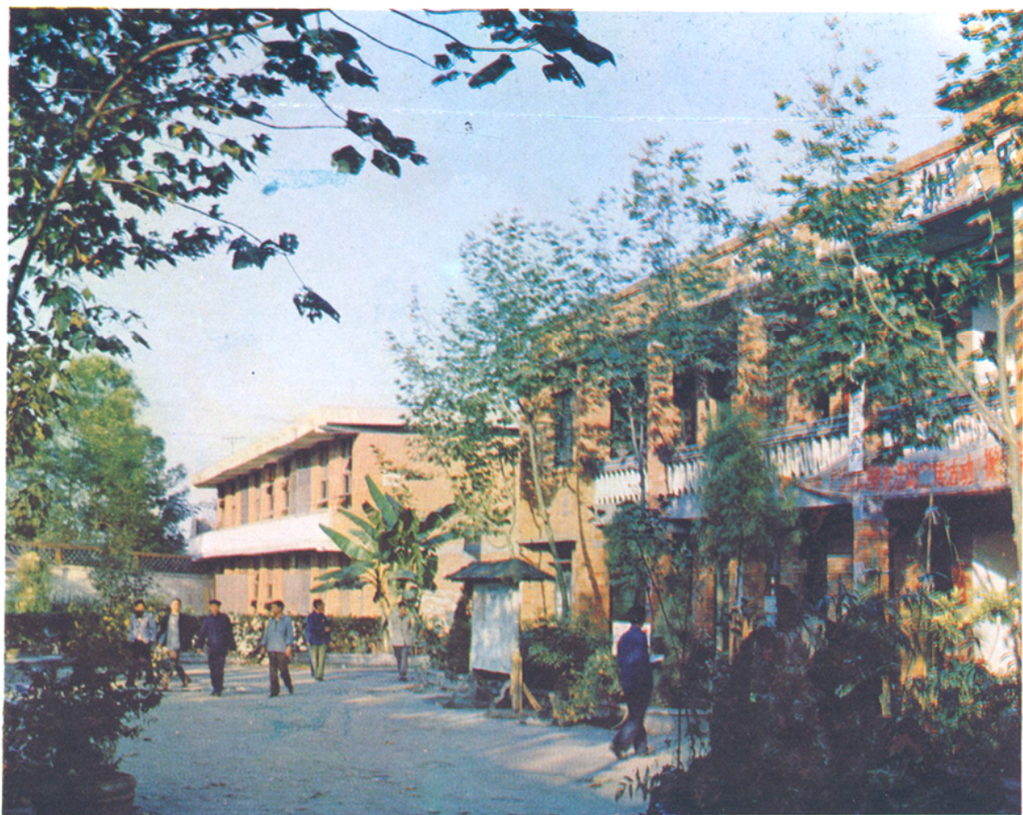
什邡烟厂二分厂厂容