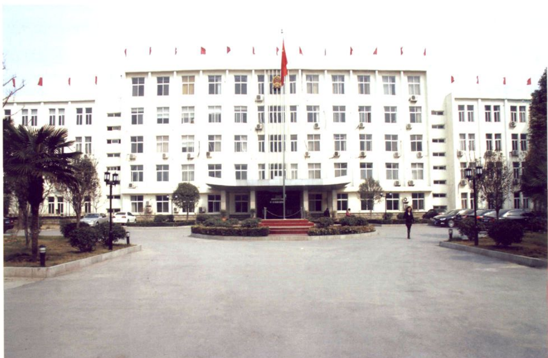
杞县人民政府办公大楼