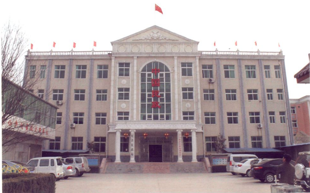
杞县民政局办公楼