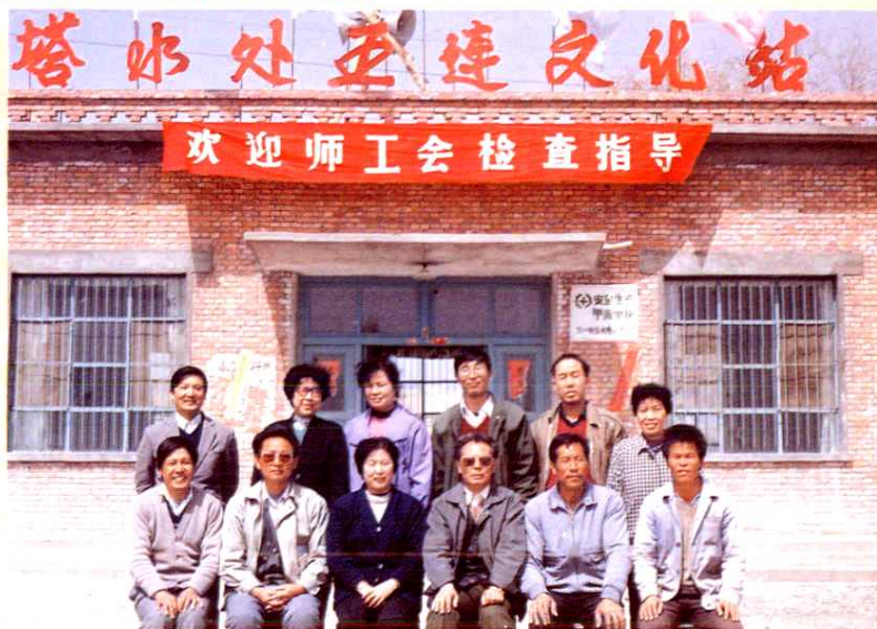
► 农一师工会在 胜利水库五连检查指 导工作。