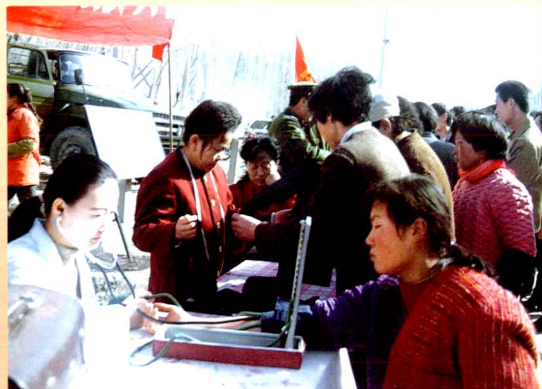
◀ 便民服务队 (1996年)。