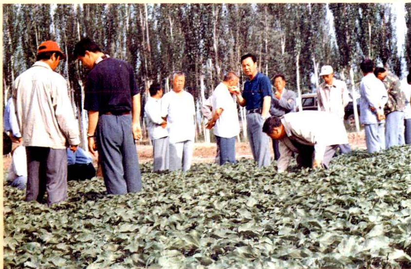
◀ 2000年6月，棉花田管检查。