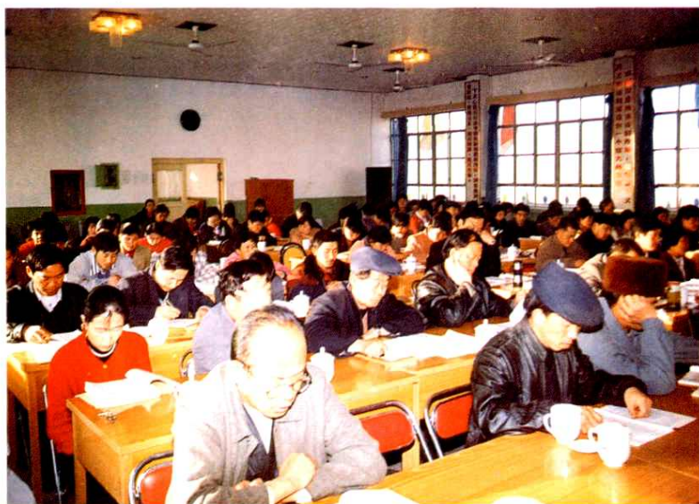
◀ 职工参与民主 管理