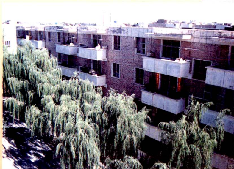
◀ 处机关职工住 宅楼（1992年）。