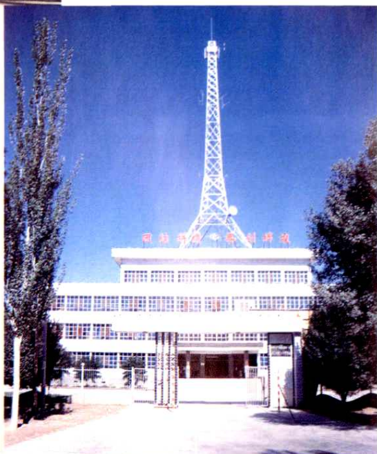
▶ 1999年修建的 微波通讯塔。