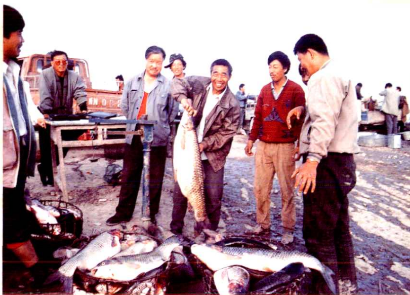
► 上游水库水产养殖场销售鲜鱼(1994年)。