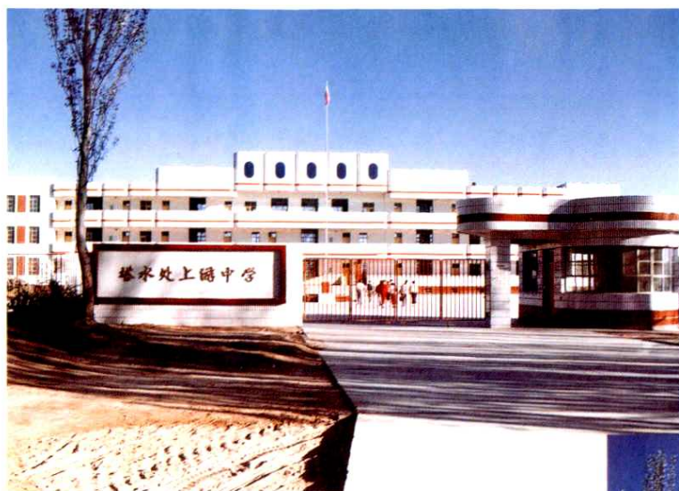
◀ 上游水库中学 教学楼（1998年）。