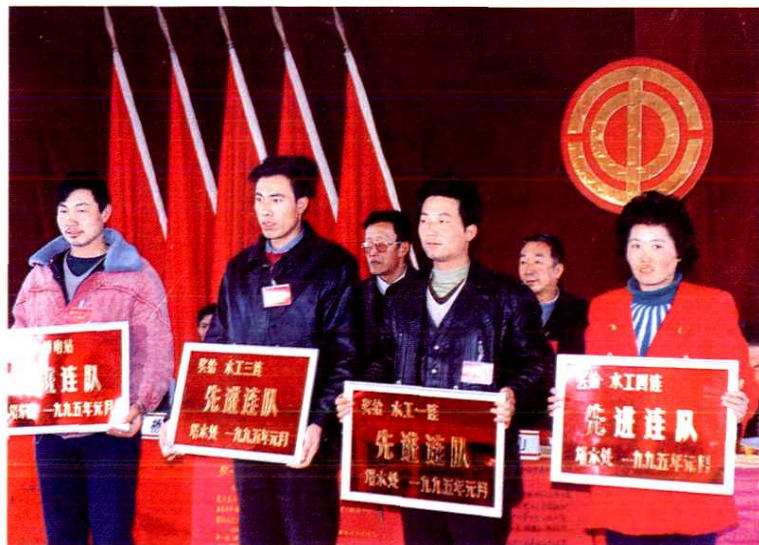
◀ 表彰先进集体 (1995年)。