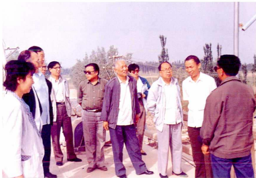
◀ 1994年6月3日，国家水利部、黄河水利委员会专家考察塔里木拦河闸。