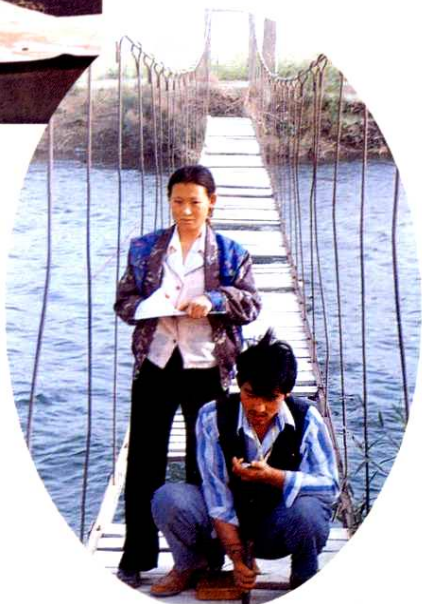
▲ 上游水库放水闸水文人员在总干渠测水（1998年）。