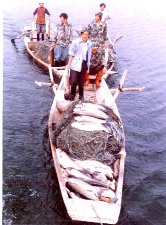
▲ 塔水处上游、胜利、多浪水库年捕鱼500余吨，图为上游水库鱼工捕鱼归来。