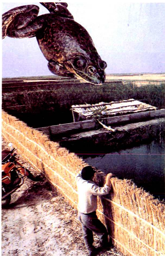
▲ 1967年，上游水库从广州引进古巴牛蛙，在垦区繁殖，图为古巴牛蛙养殖池塘。