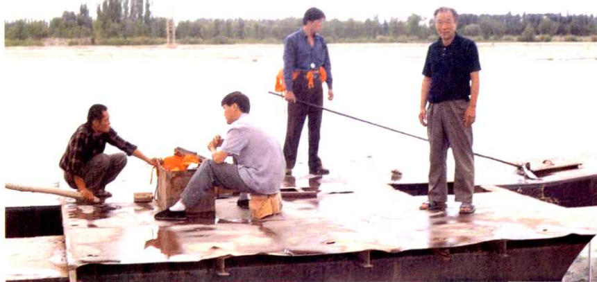
◀ 塔里木拦河闸水文人员在阿克苏河新大河测水。