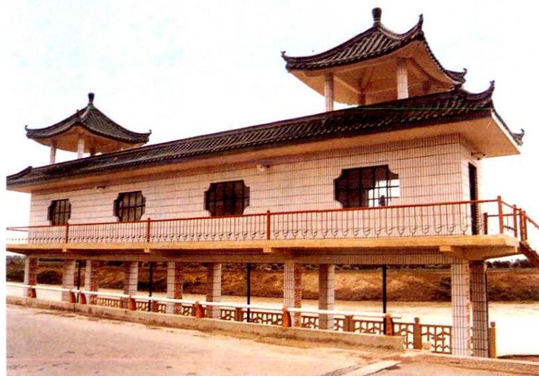
◀ 塔北二总干渠 进水闸（1997年）。