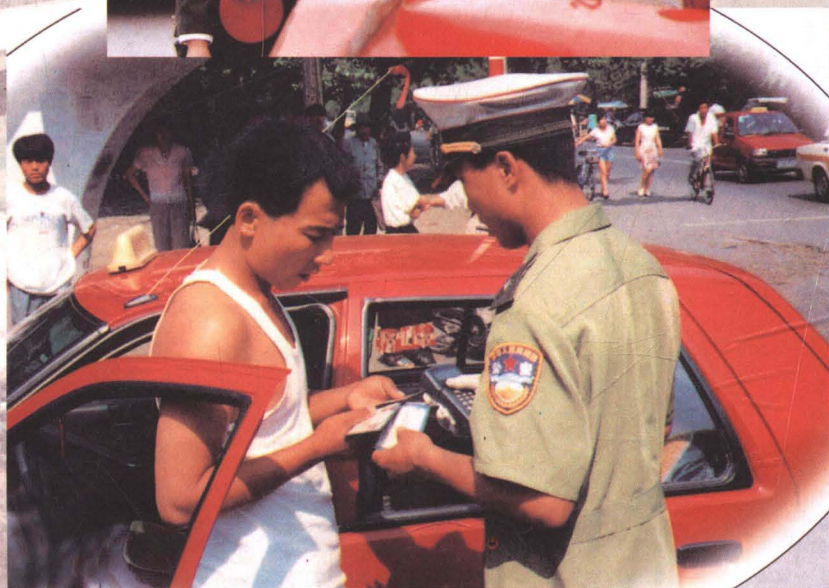
使用IC卡处理交通违章，方便、快捷、公正