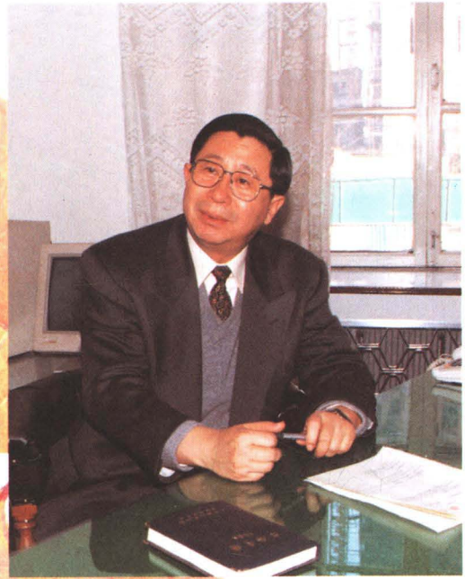
市委副书记、市长 张利藩