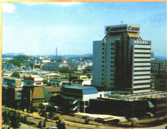
大连经济技术开发区