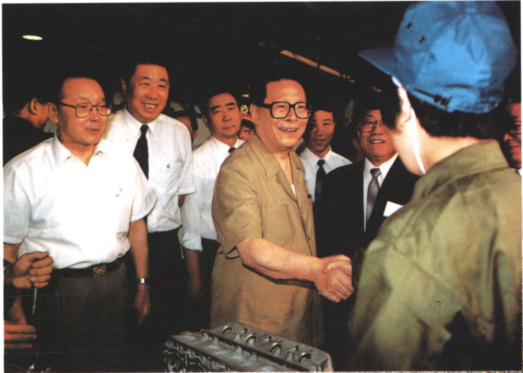
江泽民总书记在辽宁视察