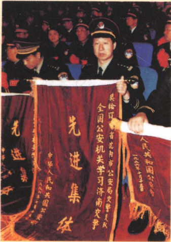
公安部授予沈阳市支队“学济南交警”先进集体，并记集体一等功。

省公安厅庄敏副厅长、省交警总队何秀兰总队长、谢宗敏副总队长检查公路巡逻民警队建设情况