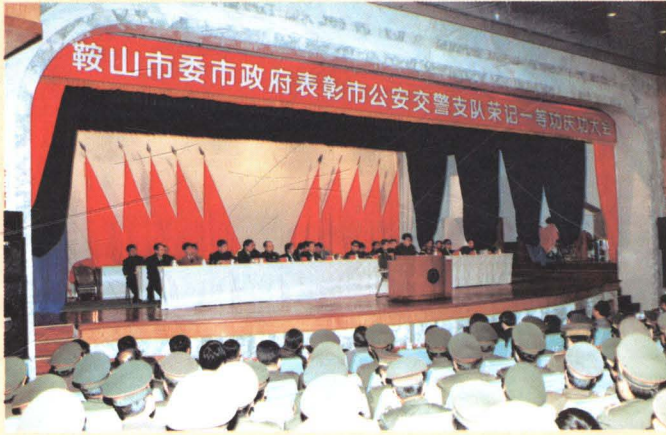
鞍山市政府表彰市公安交警支队荣记一等功庆功大会会场