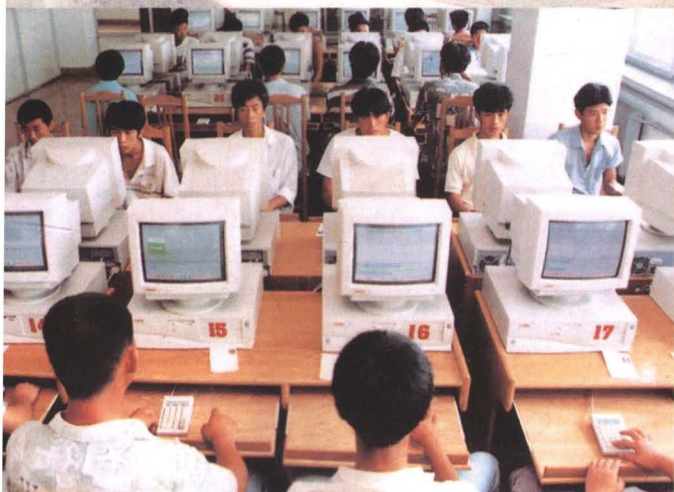
驾驶员考试电脑化

十多年以来,全省各级公安交警部门牢固树立为改革开放和现代化建服务思想,积极探索新形势下改革和改进公安交通管理工作的新路子,自觉地以自身的改革服务于全面的改革,保证了公安交通管理工作更好地适应社会主义市场经济发展的需求。1992年,制定了《辽宁交警为经济建设保驾护航的十六条规定》;1994年,出台了《辽宁公安交通管理与社会主义市场经济接轨六项新举措》;1995年,推行了《深化改革公安交通管理工作,为加快辽宁进入市场经济服务》的三项改革措施。同时,积极实行科学管理方法,广泛推行和使用IC卡管理交通违章罚款,进而强化了管理职能,拓宽了服务领域,开创了公安交通管理工作的新局面。