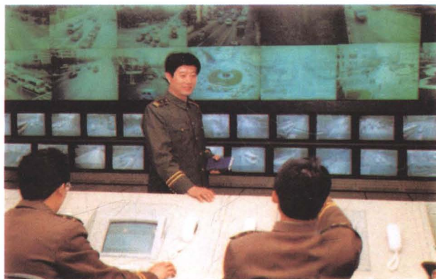
交通指挥控制中心室

十多年以来,全省各级公安交警部门牢固树立为改革开放和现代化建服务思想,积极探索新形势下改革和改进公安交通管理工作的新路子,自觉地以自身的改革服务于全面的改革,保证了公安交通管理工作更好地适应社会主义市场经济发展的需求。1992年,制定了《辽宁交警为经济建设保驾护航的十六条规定》;1994年,出台了《辽宁公安交通管理与社会主义市场经济接轨六项新举措》;1995年,推行了《深化改革公安交通管理工作,为加快辽宁进入市场经济服务》的三项改革措施。同时,积极实行科学管理方法,广泛推行和使用IC卡管理交通违章罚款,进而强化了管理职能,拓宽了服务领域,开创了公安交通管理工作的新局面。