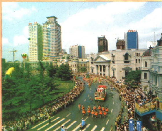
大连国际服装节盛况