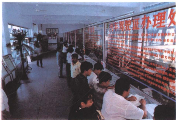
办理车辆牌证手续