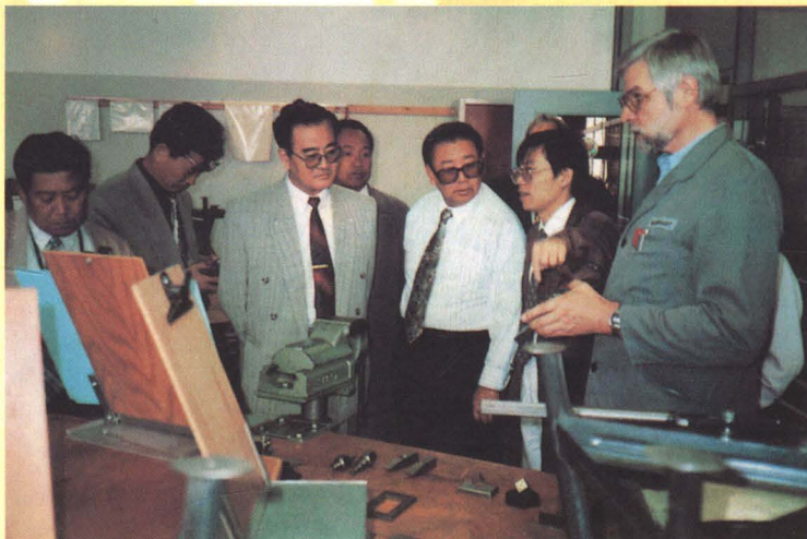
辽宁省教委主任李喜平（左三）在德国参观职业技术教育培训基地。

辽宁基础教育进行体制改革。1985 年以来，随着《中共中央关于教育体制改革的决定》的颁布，辽宁省中小学进行教育体制改革，实行“分级办学，分级管理”的体制，不断完善中小学校长负责制同教代会监督相结合、自主办学与社会