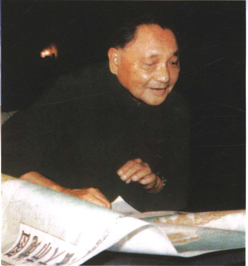
邓小平在辽宁视察