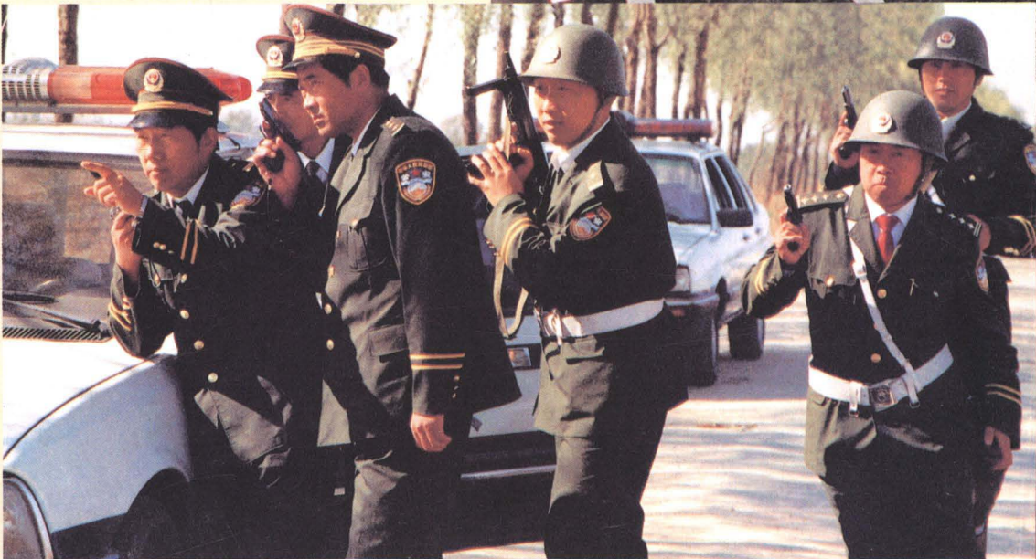
铁岭开原三中队交警正在堵截持枪抢车犯罪分子