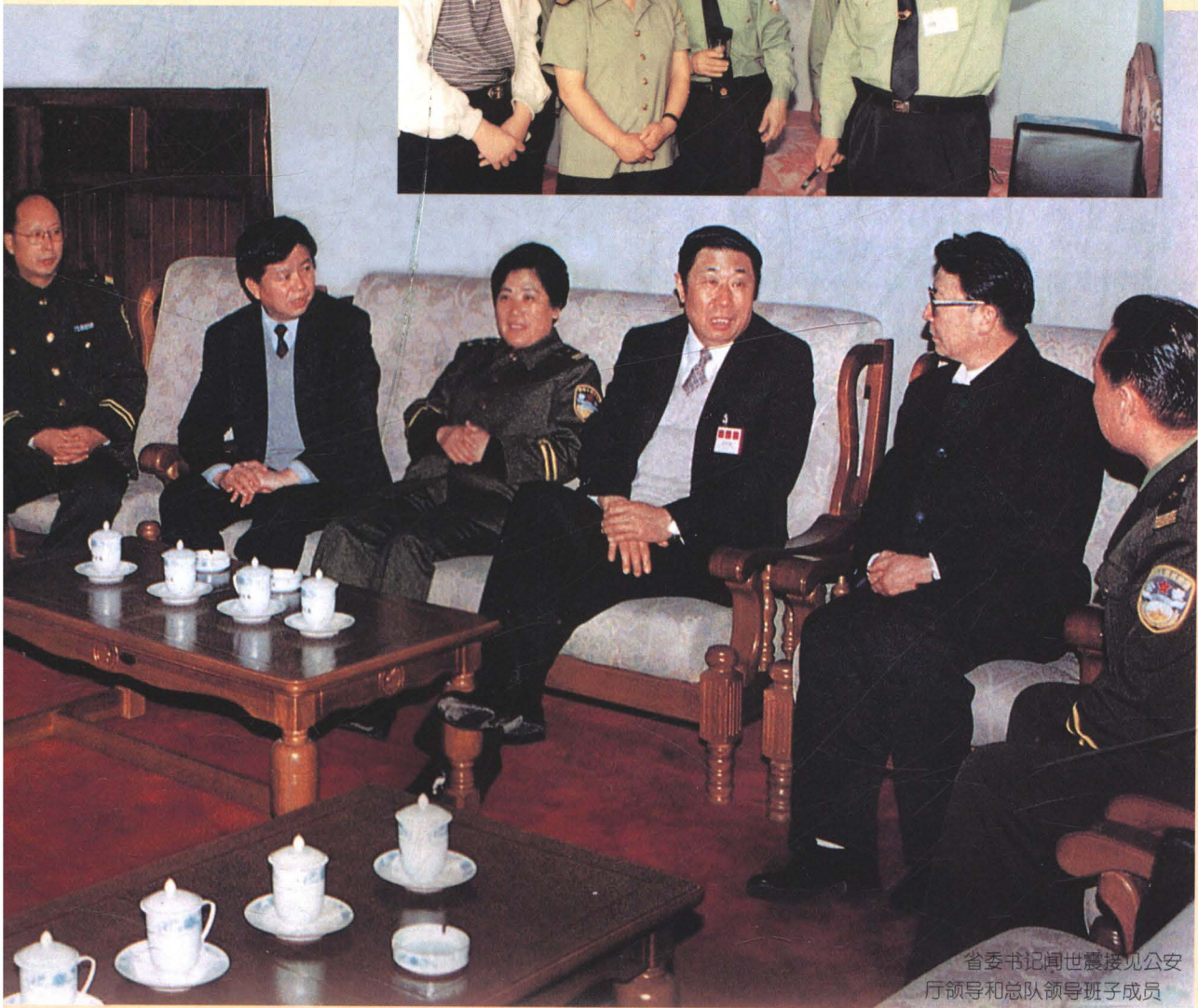
省委书记闻世震接见公安厅领导和总队领导班子成员