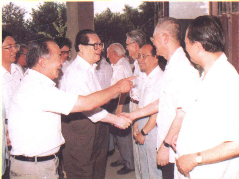
江泽民主席对辽宁教育工作给予了极大的关怀。图为 1993 年 8 月，江泽民主席视察大连理工大学。

参与相结合的制约机制，逐步实现了学校法人化，建立了学校责权相统一的自主办学体制。在学校内，逐步实行教师聘任制，岗位责任制，职务工资制，退休制等。在办学上实行以政府办学为主，社会各界共同办学的体制，对社会团体和公民个人依法办学，采取积极鼓励，大力支持，正确引导，加强管理的方针，民办（私立）学校逐步发展。