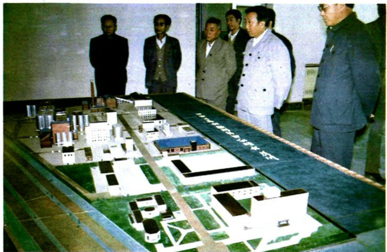
市人事局领导陪同省人事厅领导深入大中型企业调查研究