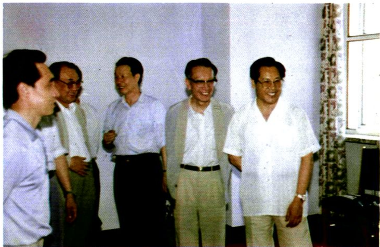
市领导检查人才市场工作