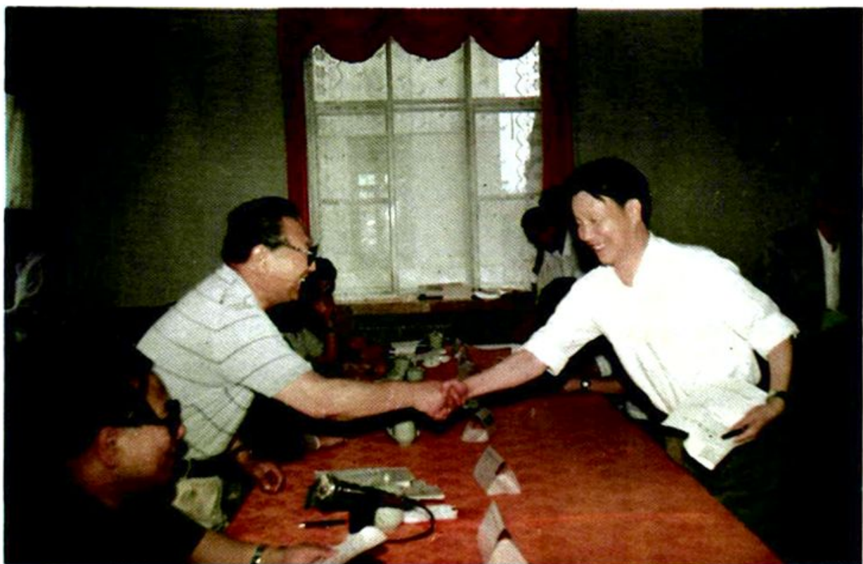
市人事局局长王广文同志与市长刘海涛同志签订目标责任状