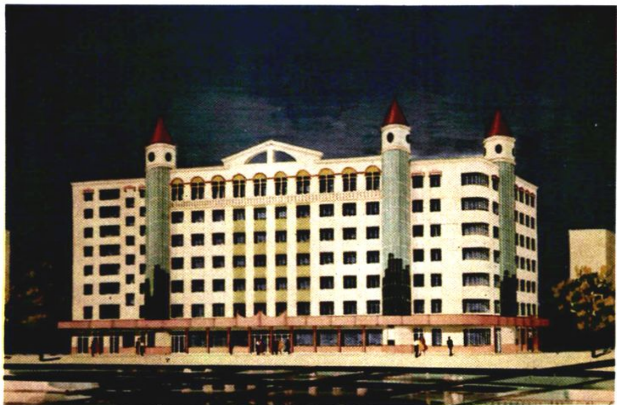
座落在永安街的长城饭店