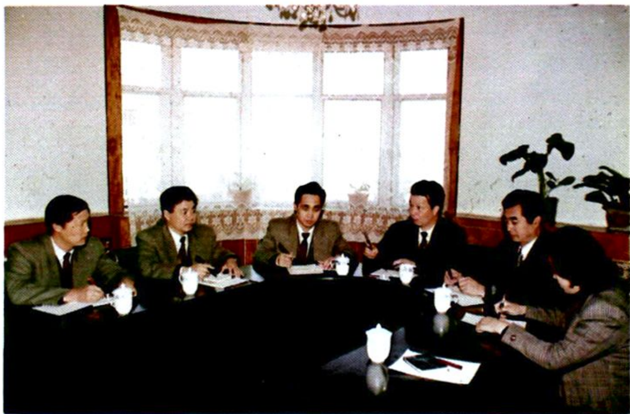
市人事局党组研究人事工作总体思路