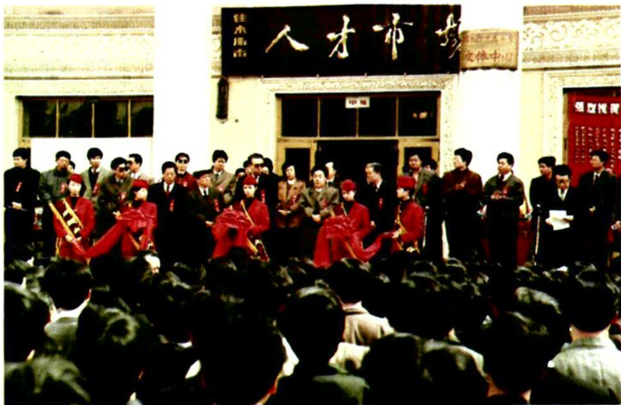
1993年4月22日人才市场开业典礼