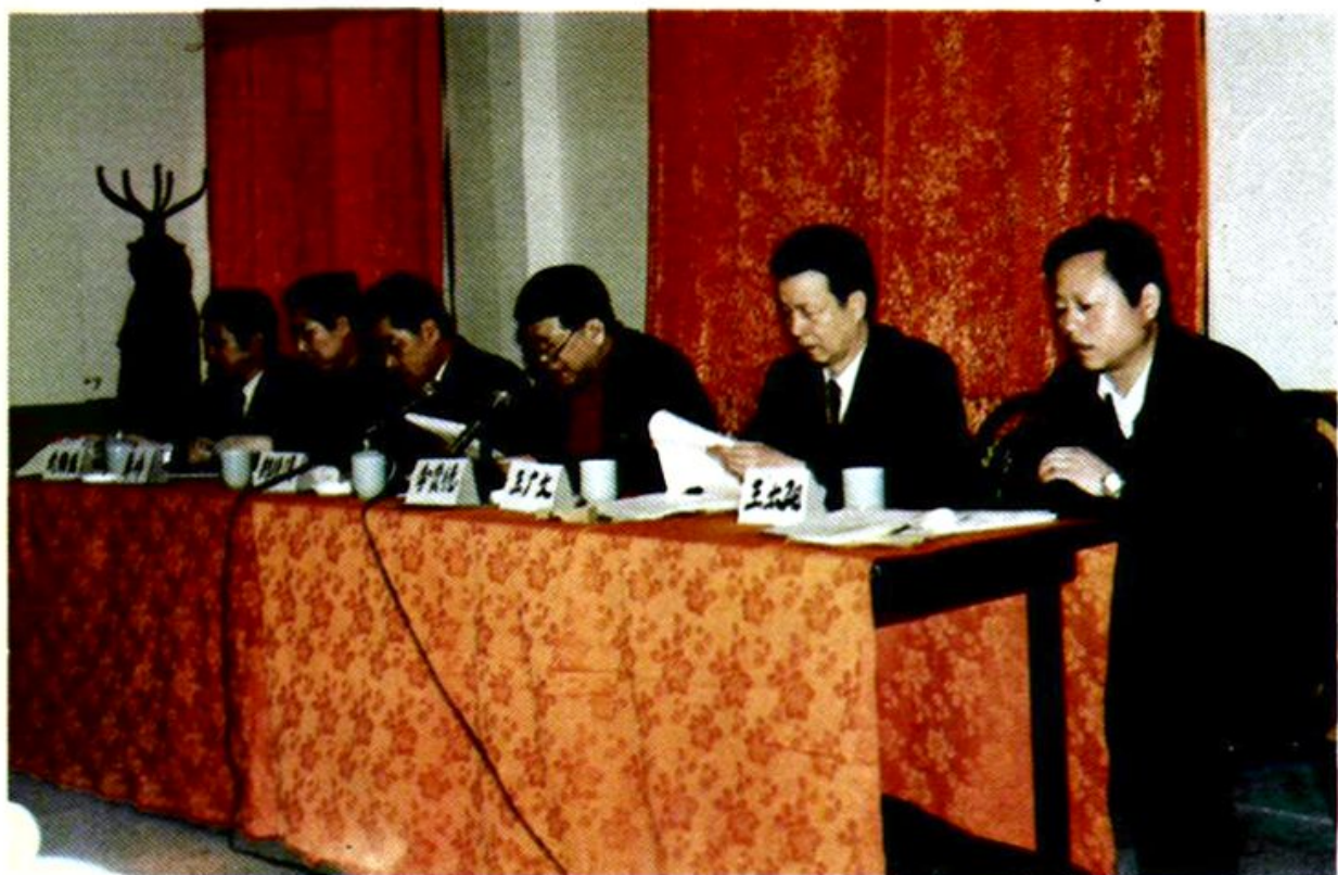
全省机关事业单位社会保险工作现场经验交流会在佳木斯市召开