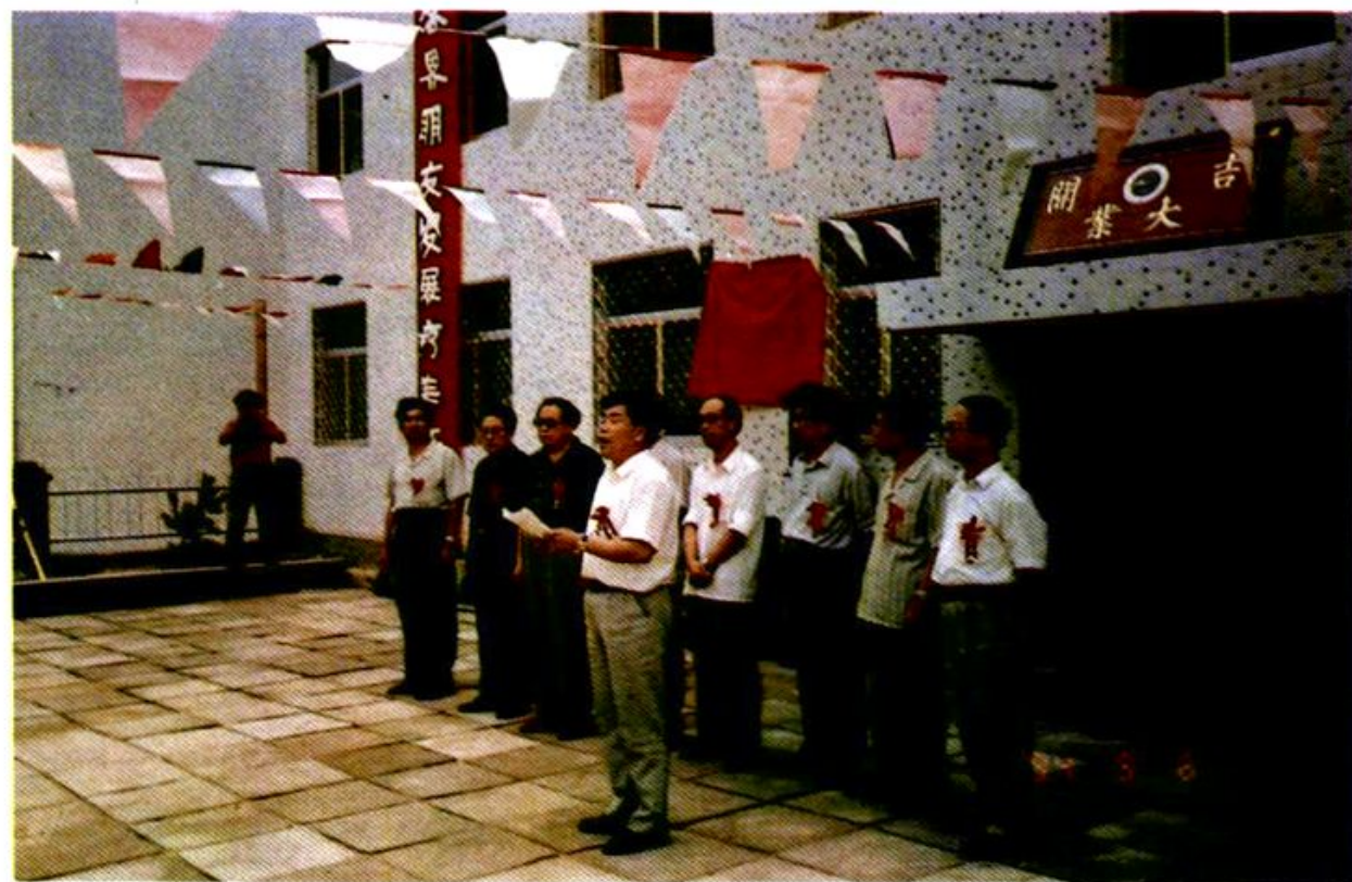
佳木斯市威海干部疗养院宏张开业