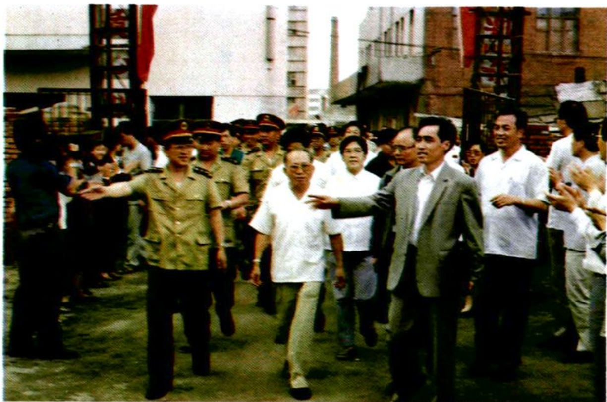
总政治部副主任于永波、省委副书记周文华视察我市军转干部住宅楼