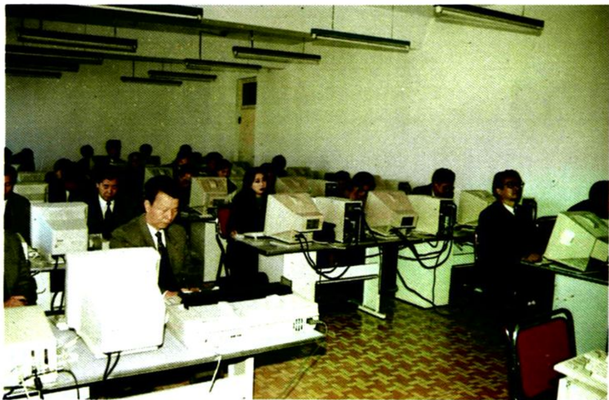
市行政干校举办微机培训班