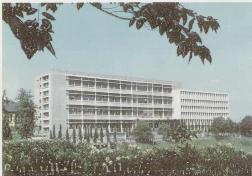
◀ 重庆大学图书馆，1982年获四川省 70年代优秀设计三等奖