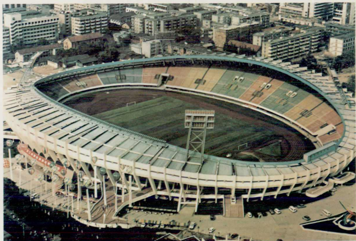
▲成都市体育场，1993年获国家铜质奖