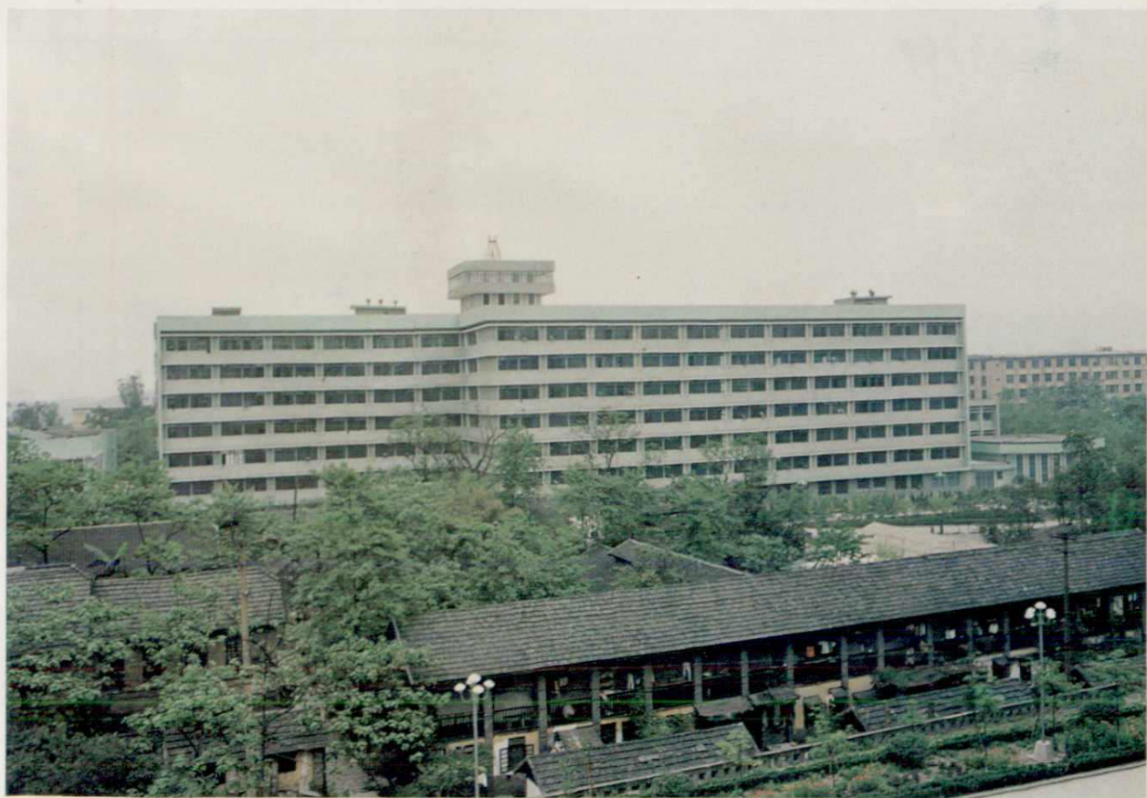
▼重庆大学综合实验楼及光机所，1987年获部级全国优秀教育建筑表扬奖