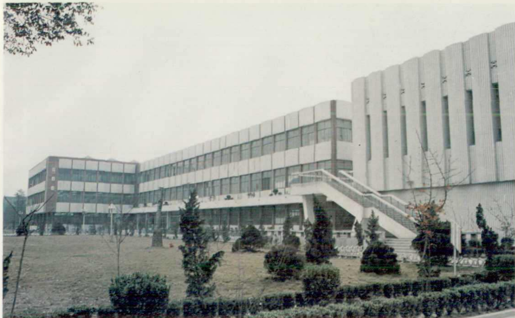
▲ 四川大学图书馆，1983年获 中建总公司优秀工程设计三 等奖