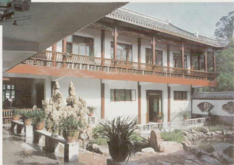
▼ 峨眉山旅游服务部(工艺美术商店), 1986年获四川省城乡建设优秀工程设计表扬奖