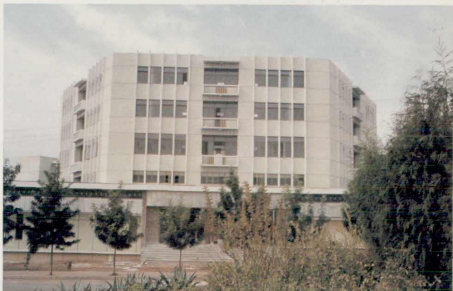
▶ 西昌民族贸易商店，1984年 获中建总公司优秀工程设计 一等奖