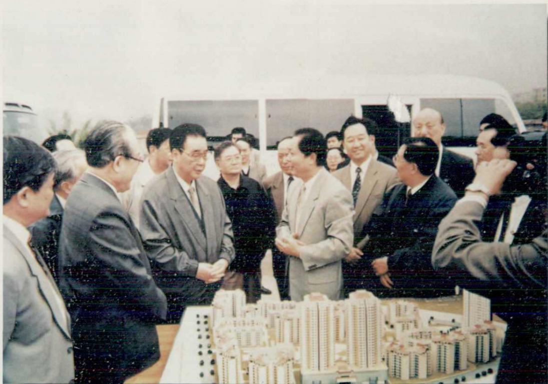
▲1996年10月17日，李鹏同志参观重庆洋河小区模型