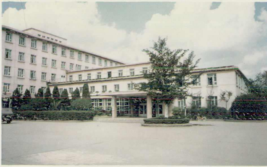
◀ 成都中医学院附属医院门诊部，1984年获城乡建设环境保护部优秀设计表扬奖