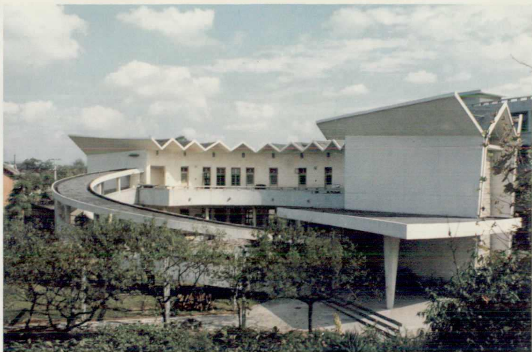
▲四川省实验幼儿园，1982年获四川省70年代优秀设计三等奖