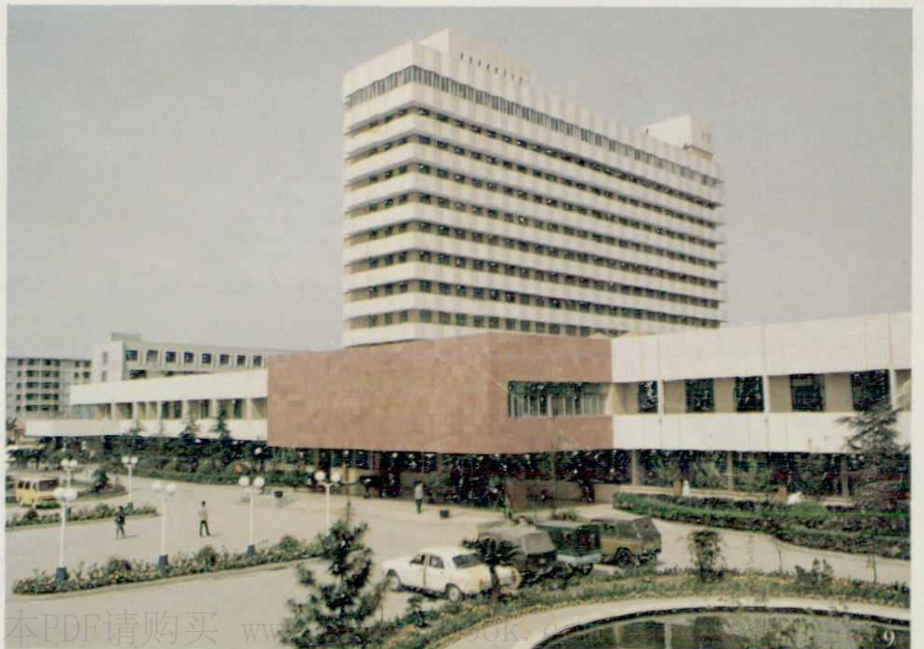
▶ 四川省肿瘤医院，1989年获建设部优秀设计二等奖