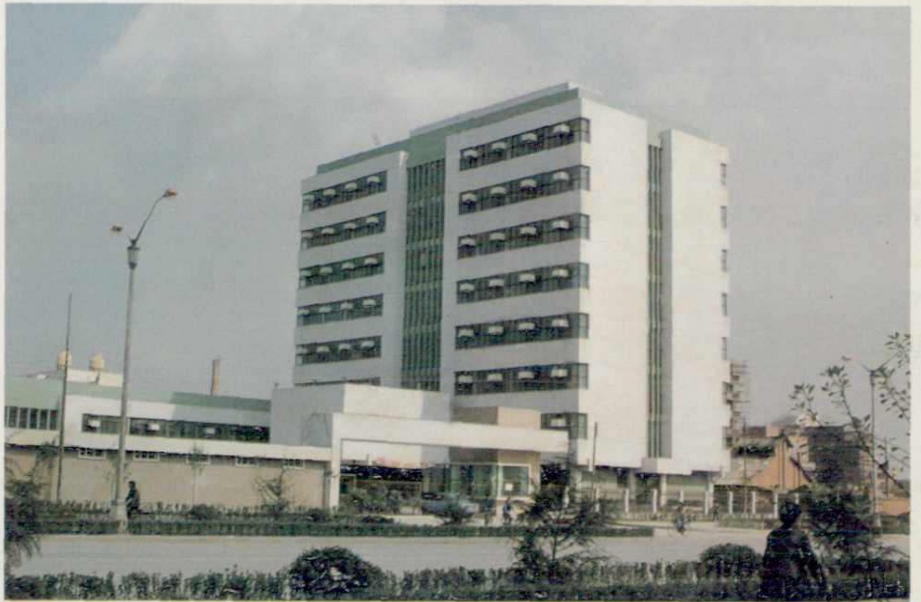
▶ 成都计划生育技术干部培训中心，1986年获城乡建设环境保护部优秀设计三等奖