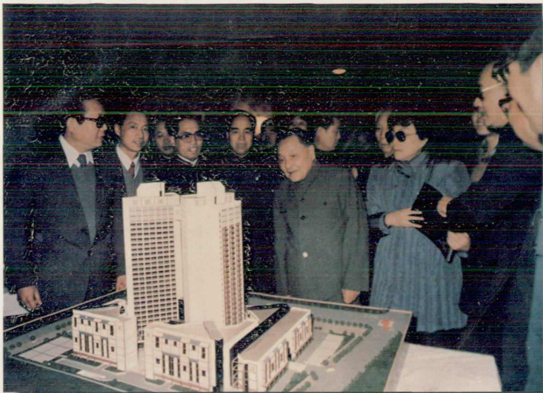
▲1986年2月13日，邓小平同志参观北京四川大厦模型