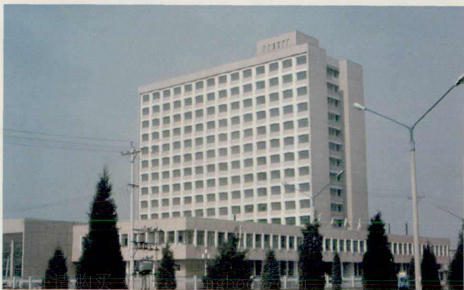
▶ 唐山饭店，1984年获中建总 公司优秀工程设计二等奖