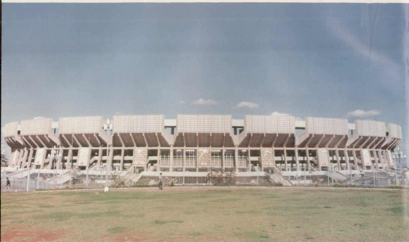
▲肯尼亚国家体育中心体育场，1989年获建设部优秀设计二等奖