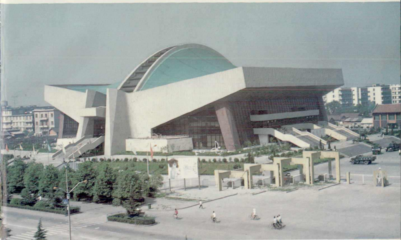
▲四川省体育馆，1991年获国家银质奖