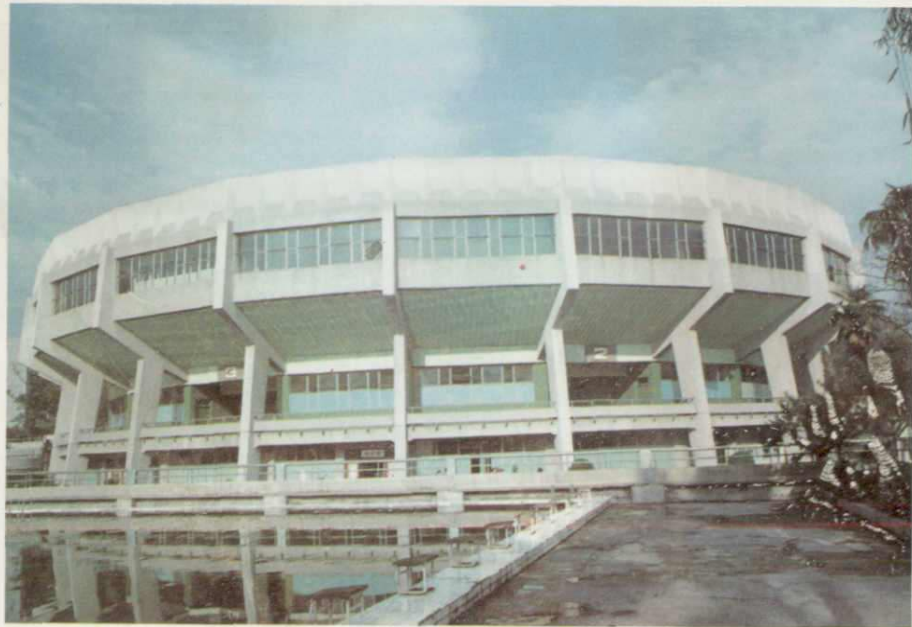
◀ 成都城北体育馆，1982年 获国家优秀设计奖