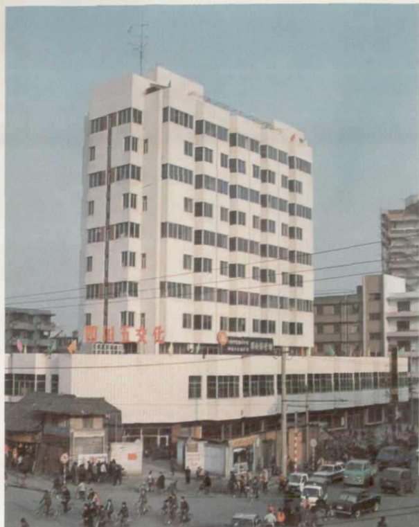
◀ 四川省五金文化公司, 1988年获四川省城乡建设优秀工程设计三等奖