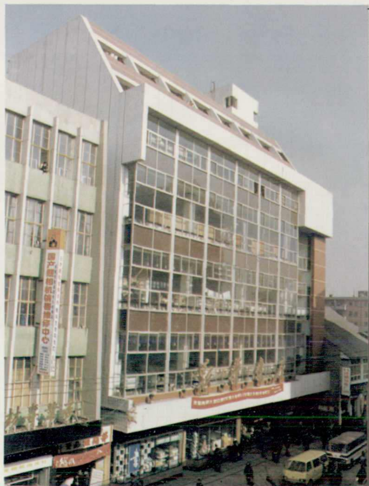
◀成都新华书店春熙路营业大楼， 1985年获四川省优秀设计二等奖