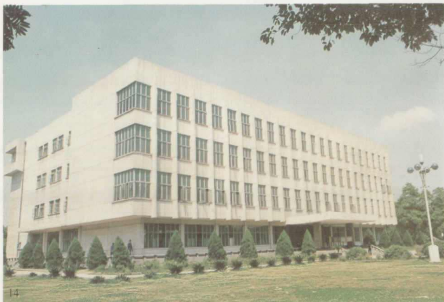
◀ 华西医科大学图书馆, 1983年获中建总公司优秀工程设计三等奖