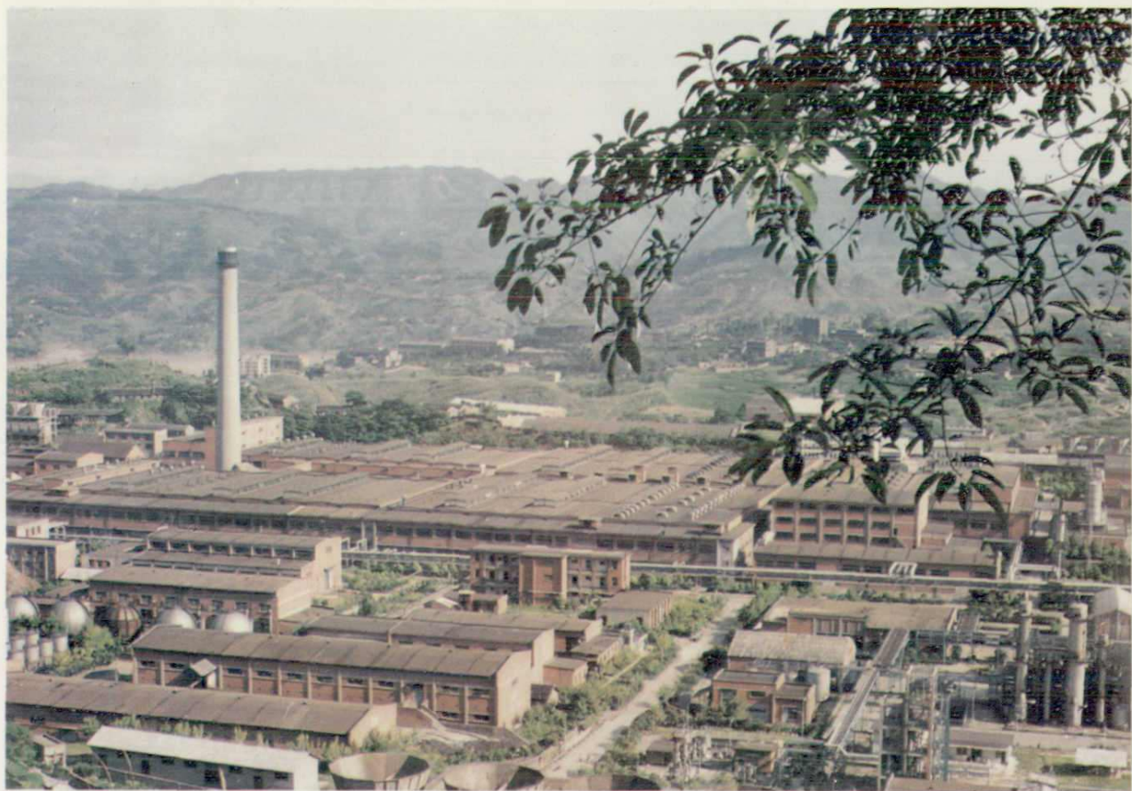
▲四川维尼纶厂纺丝分厂