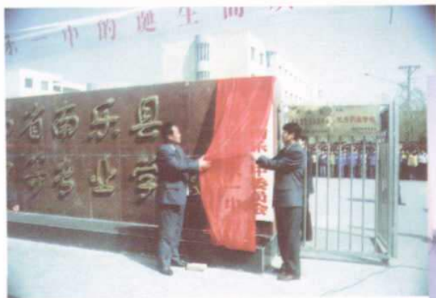
▲ 2000年，县一中、职专联合办校，县领导为新的南乐一中揭牌