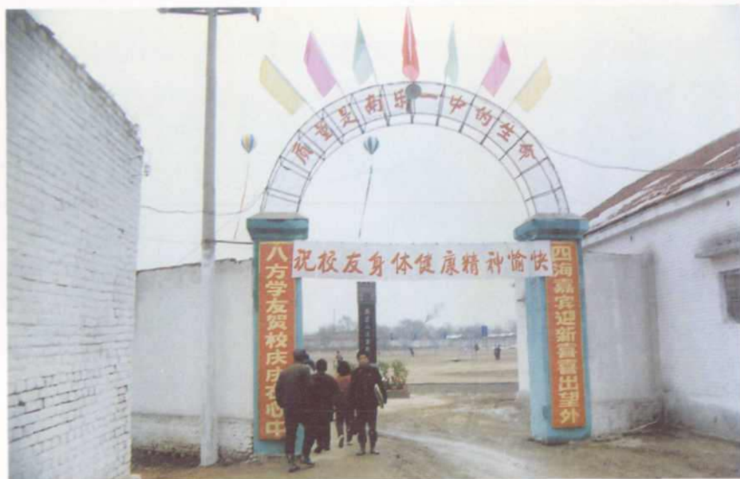
▲ 七十年代的一中西大门

NAN JIANG UNIVERSITY OF AERONAUTICS AND ASTRONAUTICS