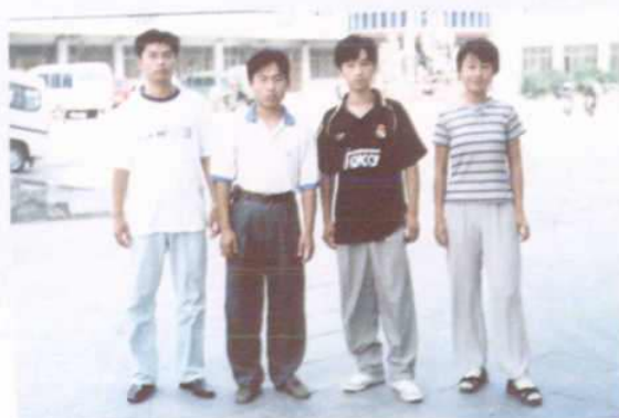
▲ 2000年升入清华、北大、人大、科技大的部分学生