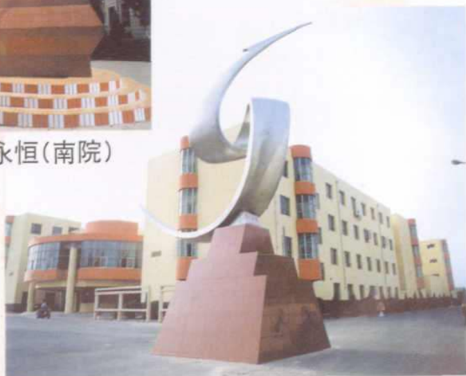
▲ 校标——日月永恒(南院)