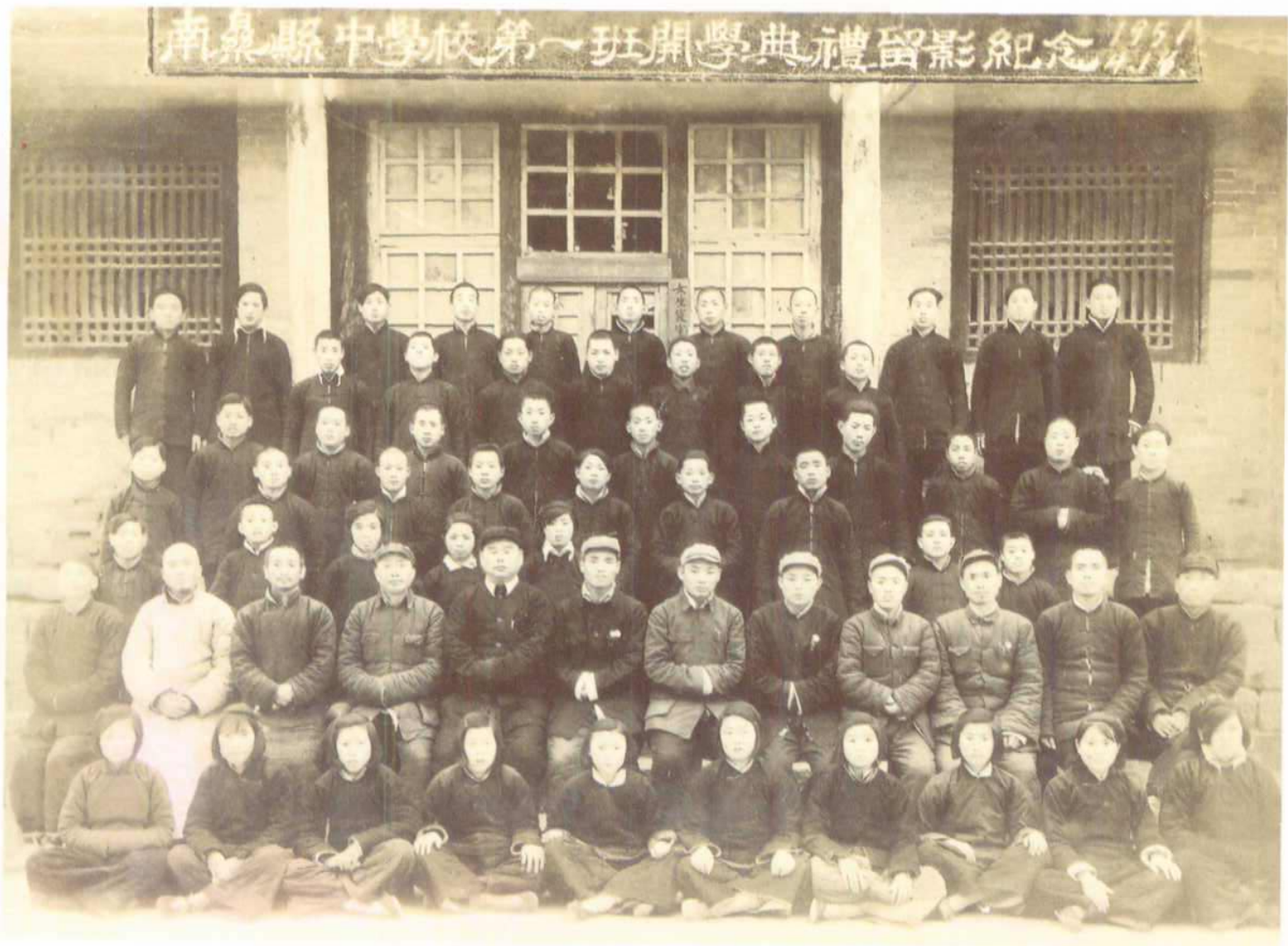
南樂縣中學校第一班開學典禮留影紀念 1951