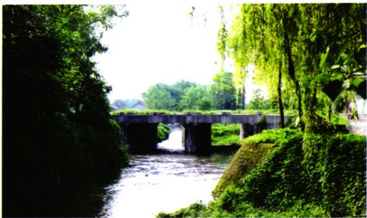
一期工程竣工后的双麟桥