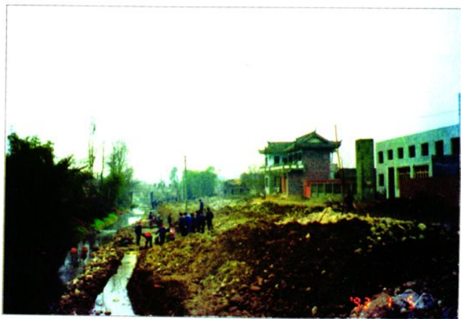
建设中的滨河路北岸