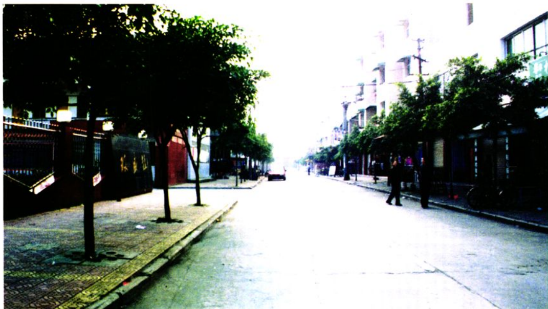
建成后的春苑路