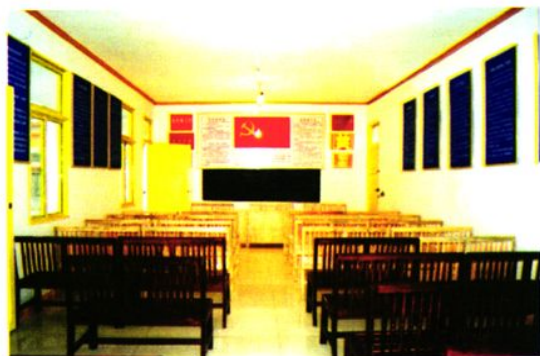
白龙村党员活动室