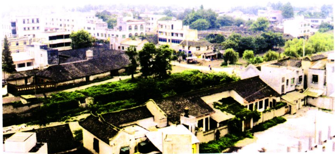
2000年双盛小城镇鸟瞰