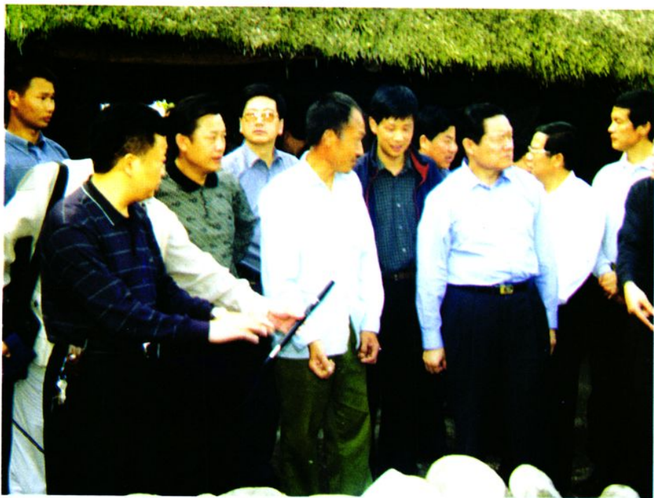
2002年10月2日省委书记周永康(右三), 市委书记方小方(右五)到农科村视察灾情。