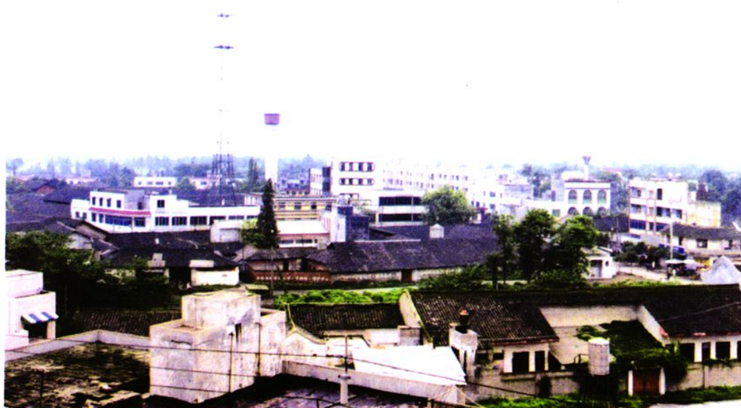
2000年双盛小城镇鸟瞰