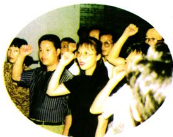
新党员宣誓