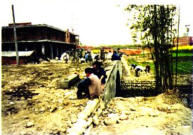
建设中的春苑桥