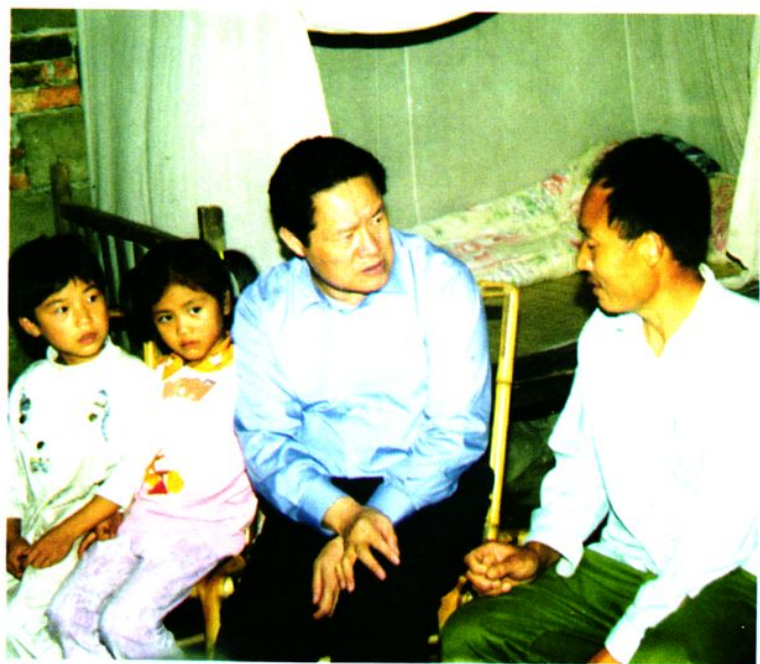
周永康与灾民亲切交谈