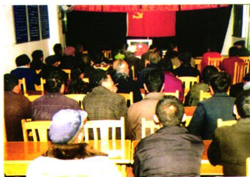
永宁村党员电教室