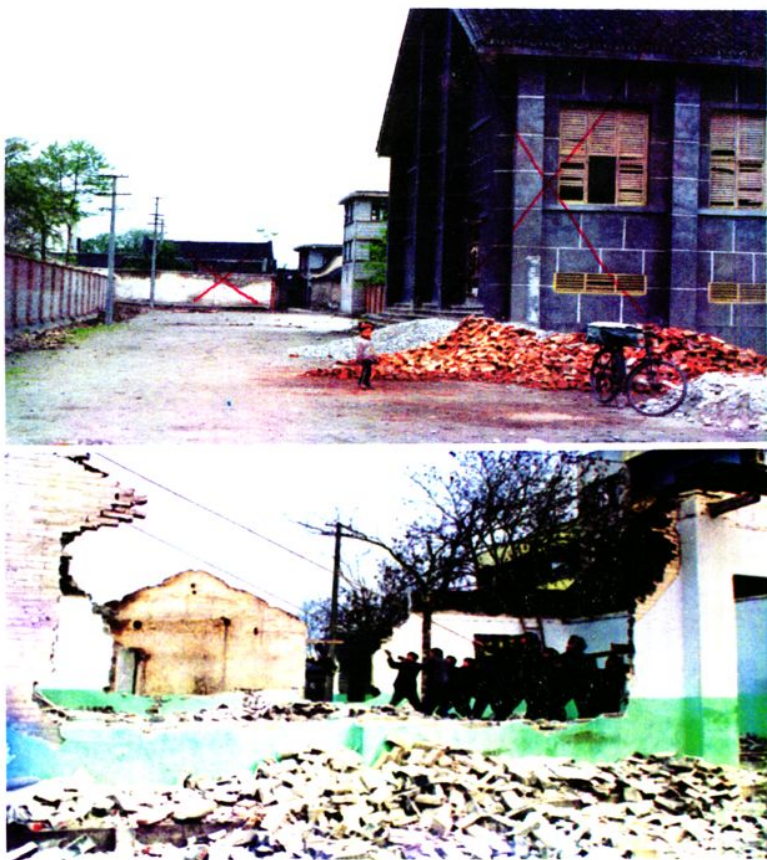
建设中的春苑路