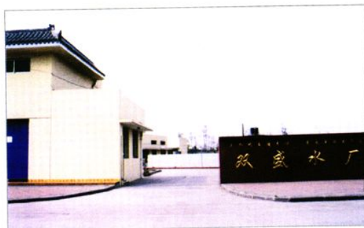
双盛水厂