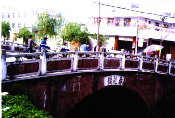
建成后的春苑桥