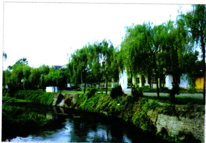
建成后的滨河路北岸