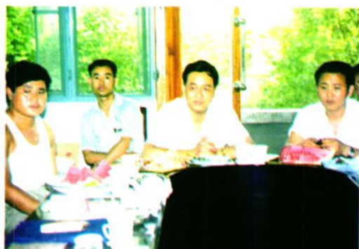
专家和领导参加评审