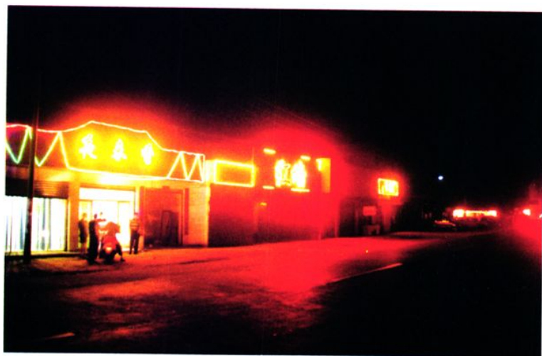
小城镇夜景