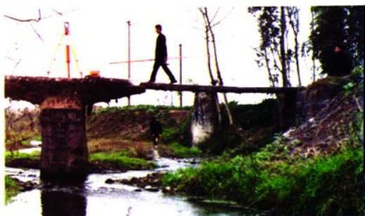
建设前的双麟桥