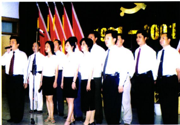
颂歌献给党