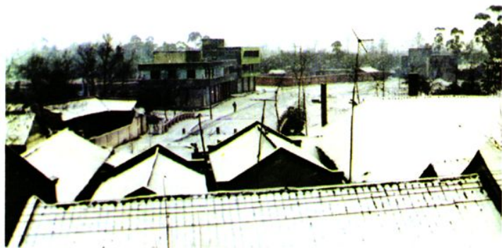
1991年双盛小城镇鸟瞰