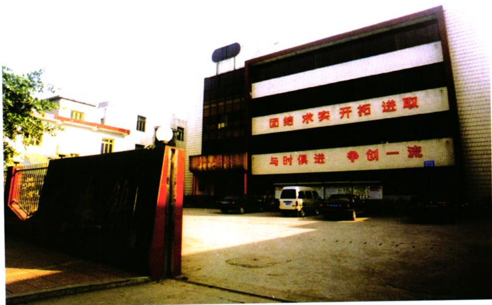
镇党政机关办公楼