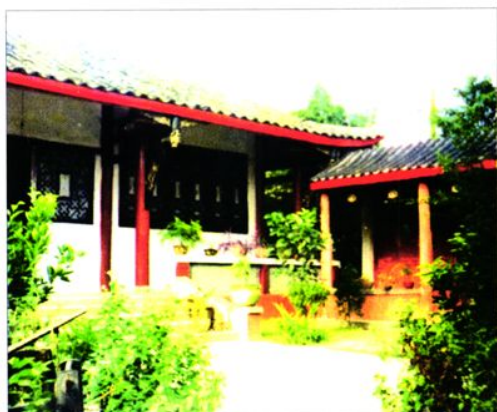
仿古民居 (史泽秀摄)