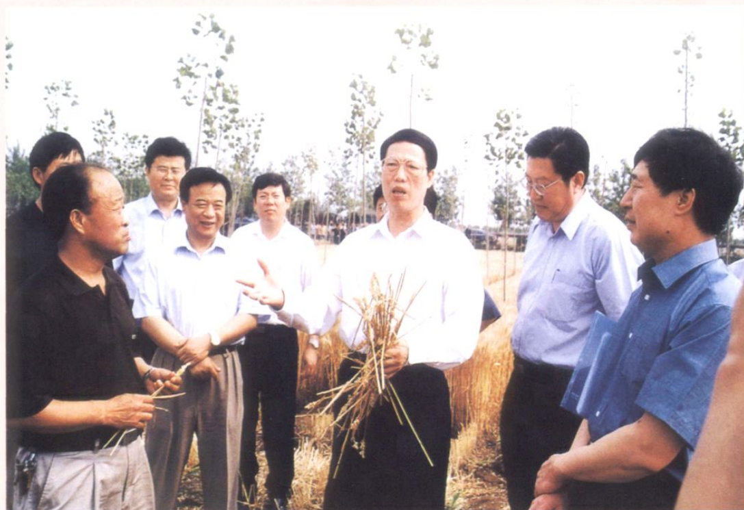
2003年6月16日，省委书记、省人大常委会主任张高丽（右三）视察张店区工作