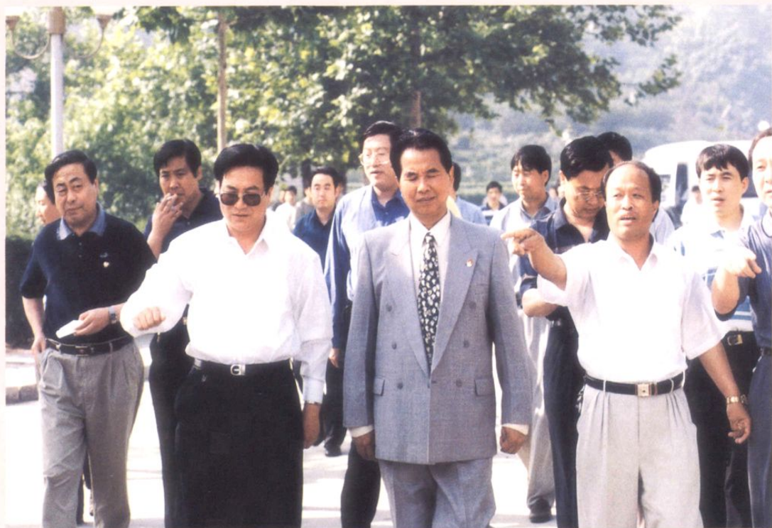
2000年6月25日，中共中央政治局委员、省委书记吴官正（前排右二）视察张店区工作