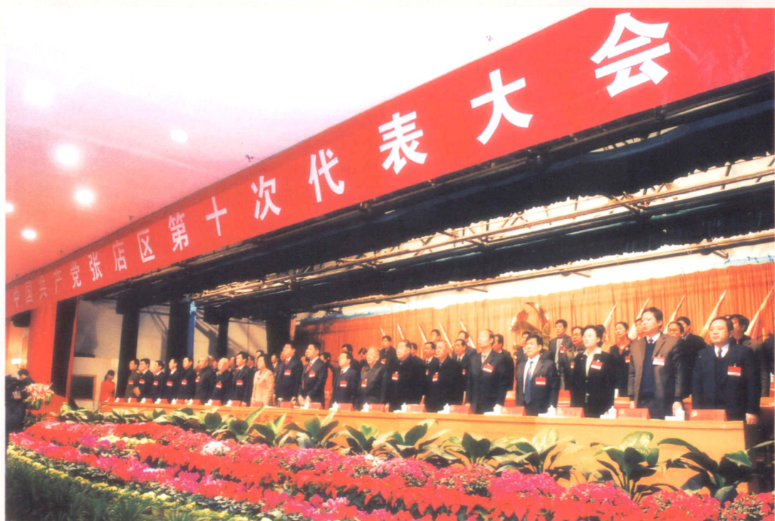
2007年2月4日，区第十次党代会开幕式