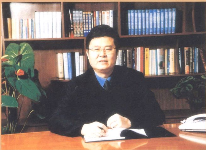
区委书记、区人大常委会主任 许建国