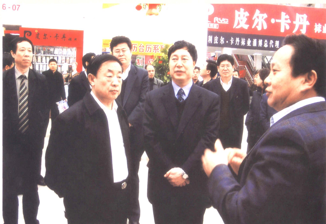
2006年3月24日，省委副书记、省政府省长韩寓群（前排左一）到张店视察义乌小商品城