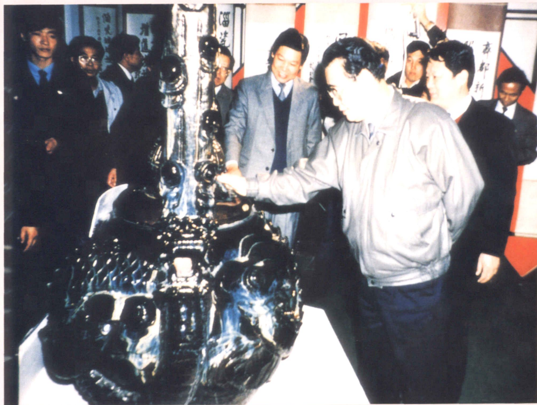
1990年9月5日，国务院总理李鹏（右一）参观第一届淄博陶瓷琉璃艺术节工艺品展