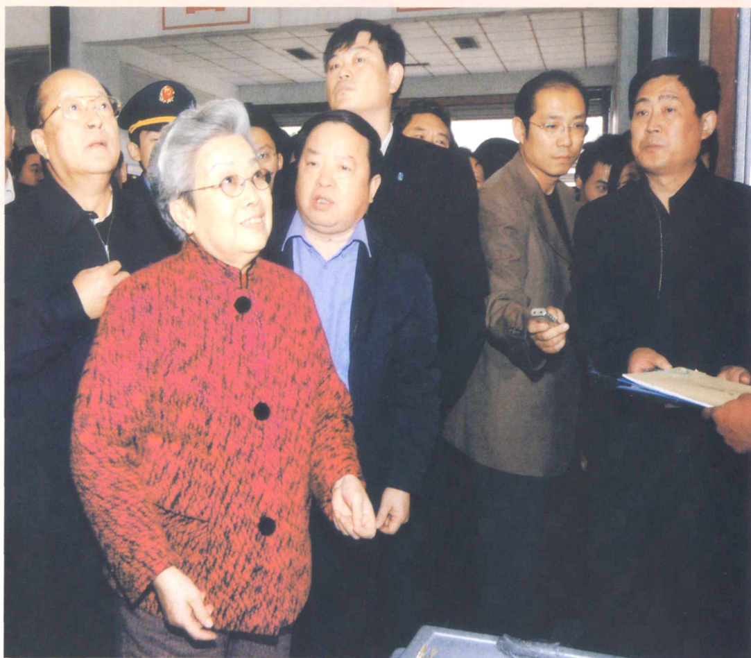
2007年10月24日，国务院副总理吴仪（左二）视察鲁中蔬菜批发市场