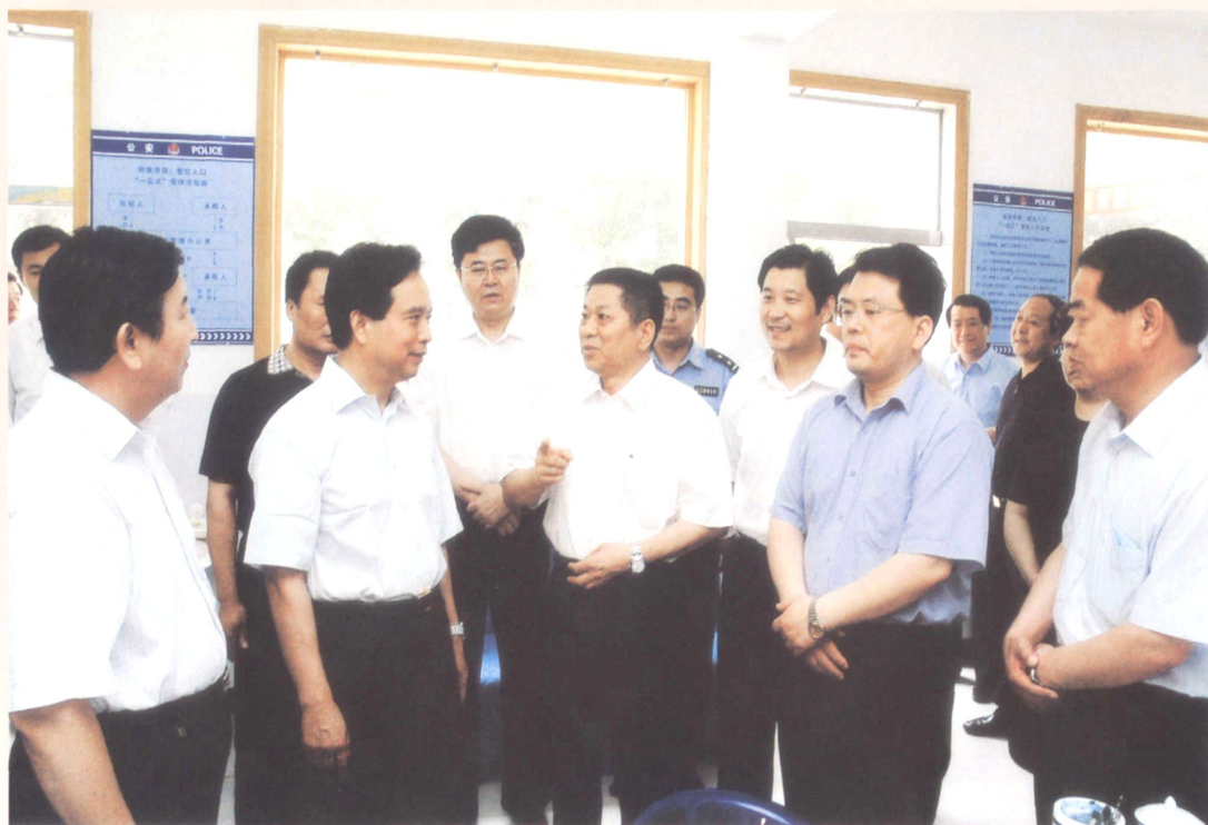
2007年6月8日，省委书记、省人大常委会主任李建国（前排左二）视察张店社区工作