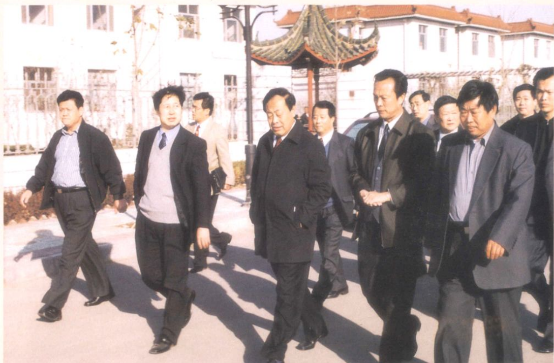
2001年11月15日，市委书记阎启俊（前排右三）到张店区调研