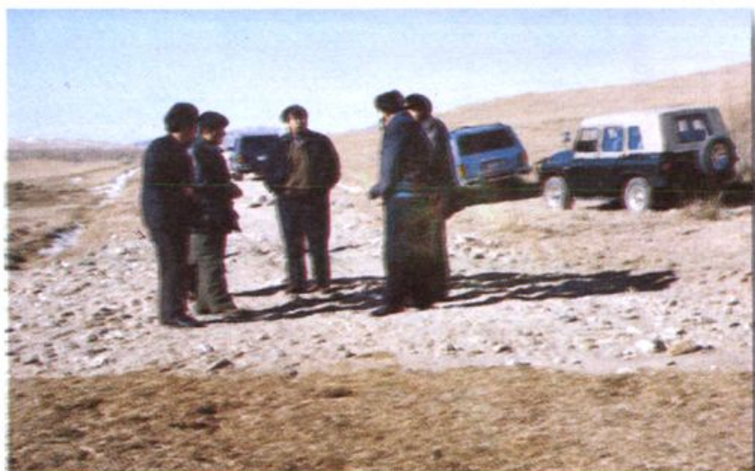
旗领导督促检查乡村公路