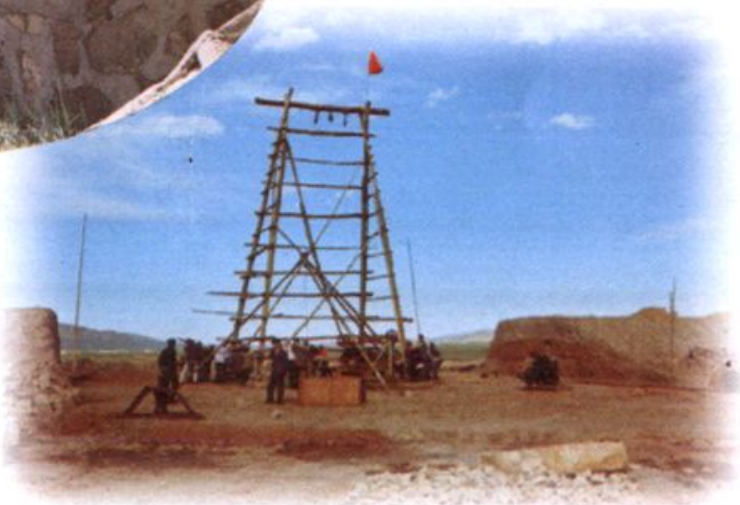
灌柱桩桥施工现场