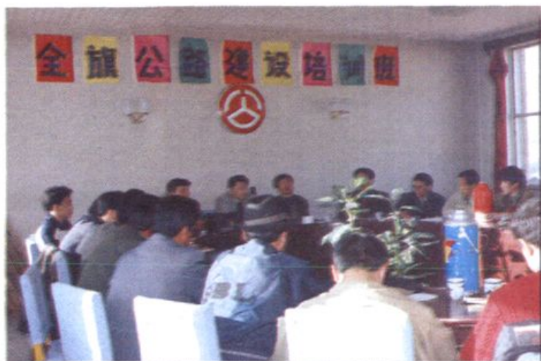
全旗苏木(乡)公路建设培训班