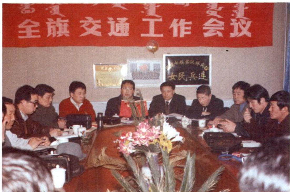
全旗交通工作会议