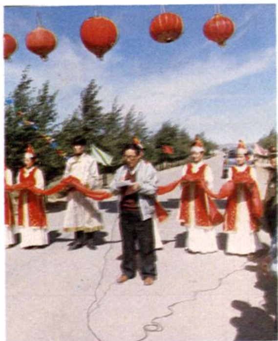
宝赛公路白宝段砂石路改造黑色路面竣工通车