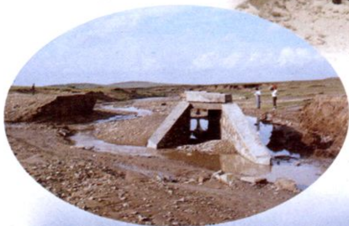
98年公路水毁—满沽线乌宁巴图河渠段