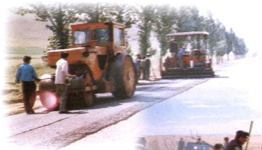
机械化油路面摊铺