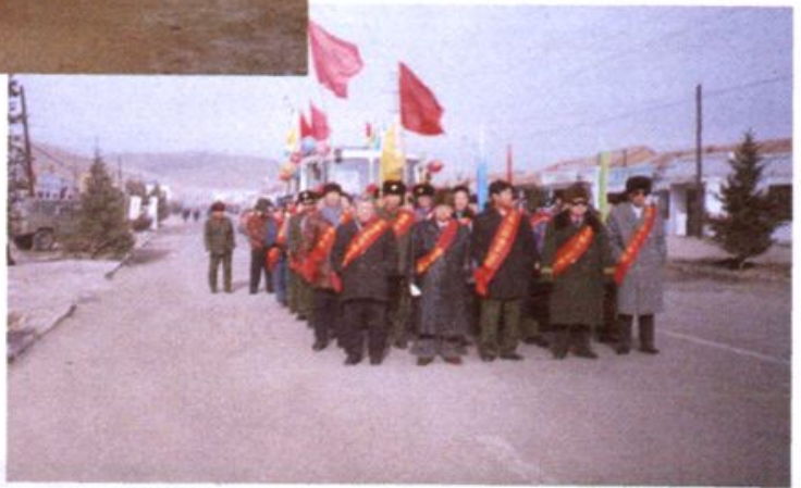
旗六大班子领导、交通系统干部职工走上街头开展《公路法》宣传活动