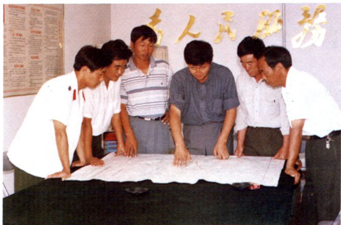
交通系统领导班子研究工作