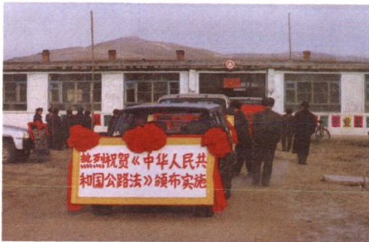
旗交通局组织开展《公路法》宣传