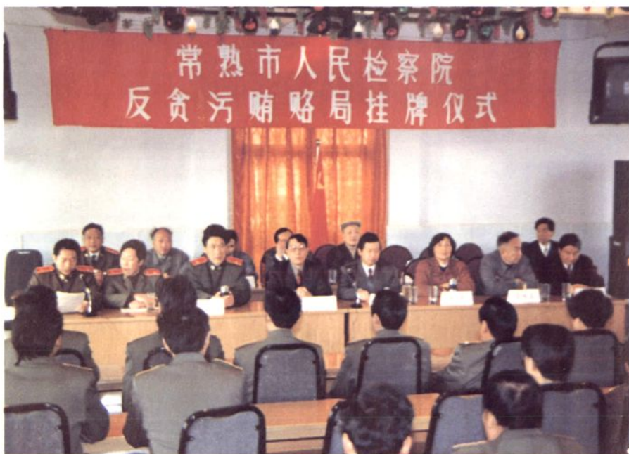
1995年12月5日，常熟市人民检察院举行反贪污贿赂局挂牌仪式。