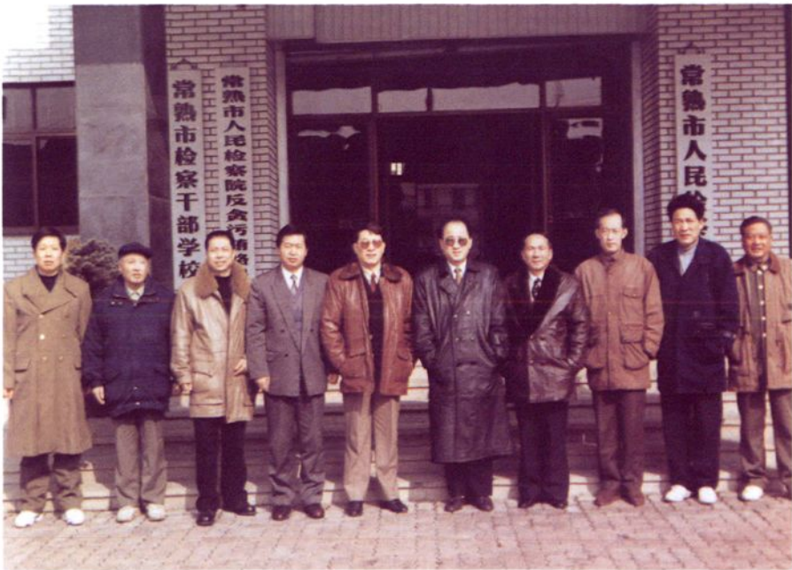
1996年1月16日，最高人民检察院副检察长张穹检查常熟市人民检察院时 与中共常熟市委、常熟市检察院和江苏省、苏州市检察院等领导合影。 左起：朱建声 谈世诚 倪家梁 戈炳根 万昌立 张穹 张品华 储小平 俞树申 张仟