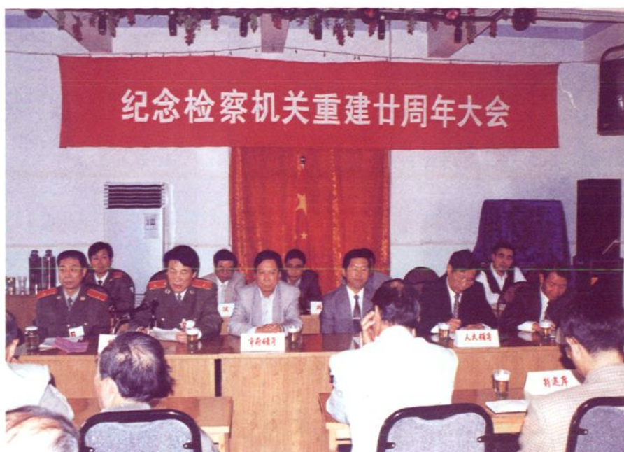
市委副书记戈炳根、市政府副市长俞惠良、市人大常委会副主任言穆胜、市政协副主席石昌宝、检察长俞树中、副检察长倪家梁、张仟、朱建声在纪念检察机关重建二十周年大会上。(摄于1998年10月23日)