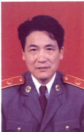
常熟市人民检察院检察长 俞树申(1995.2- )