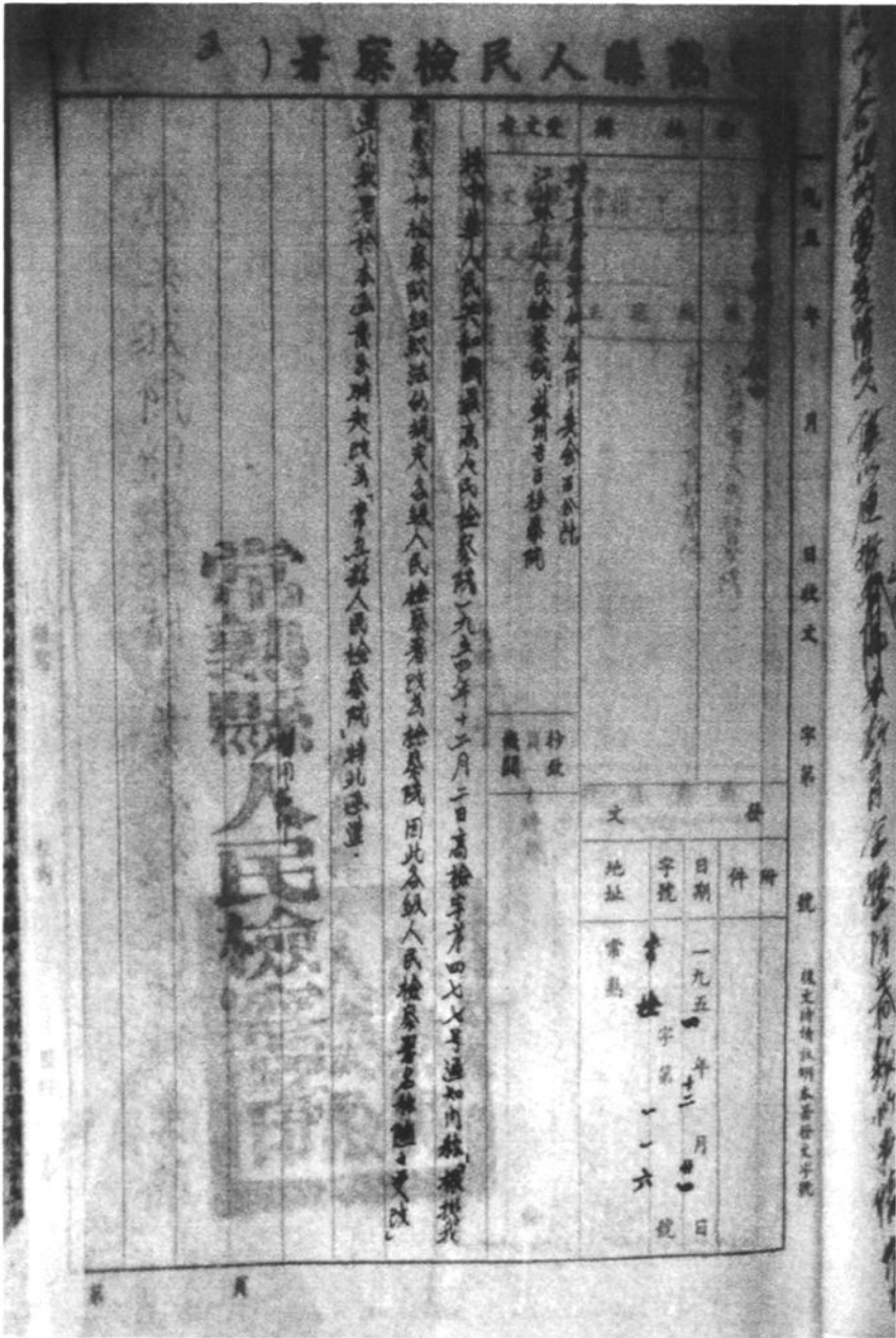
1954年12月21日，常熟县人民檢察署改名为常熟县人民檢察院。