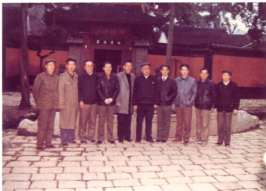
最高人民检察院副检察长张思卿在视察期间 与常熟市人民检察院检察长顾保成等领导合影。