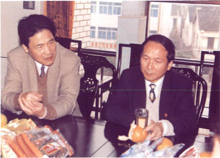
1996年11月8日，江苏省人民检察院检察长张品华 来常熟市人民检察院视察。