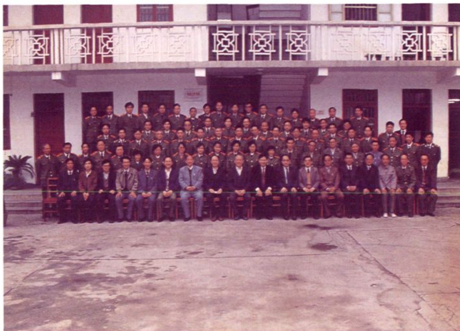
1991年4月28日，最高人民检察院检察长刘复之 与常熟市人民检察院全体干警合影。