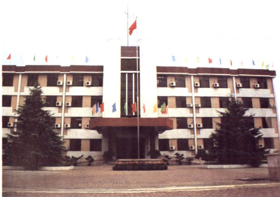
常熟市人民检察院新落成的办公大楼金沙江路10号(1993年10月)