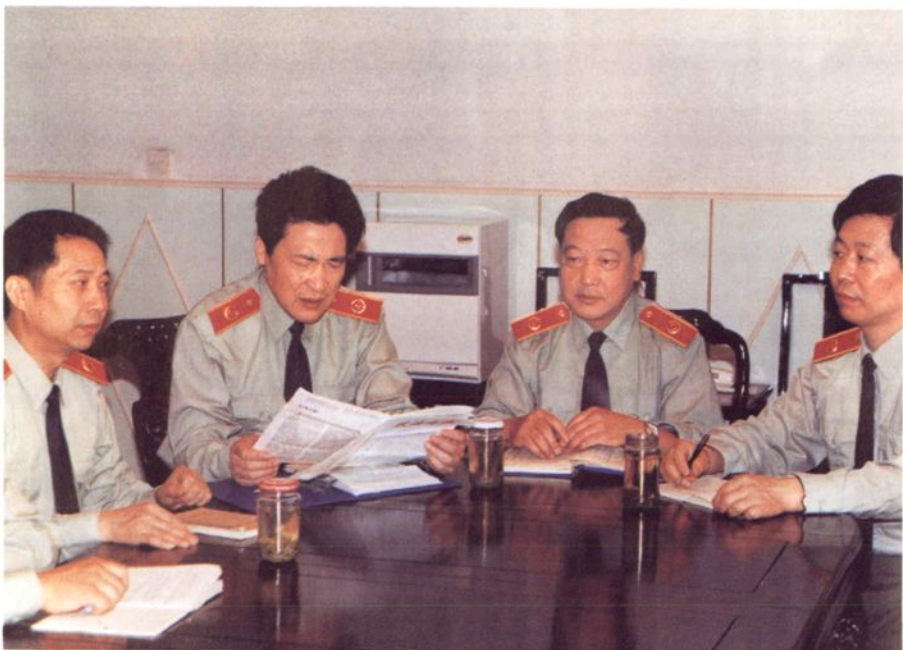
常熟市人民检察院召开党组成员会议。