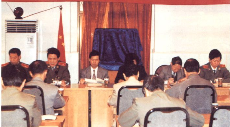
1998年5月17日，常熟市人民检察院召开聘请特约检察员会议。