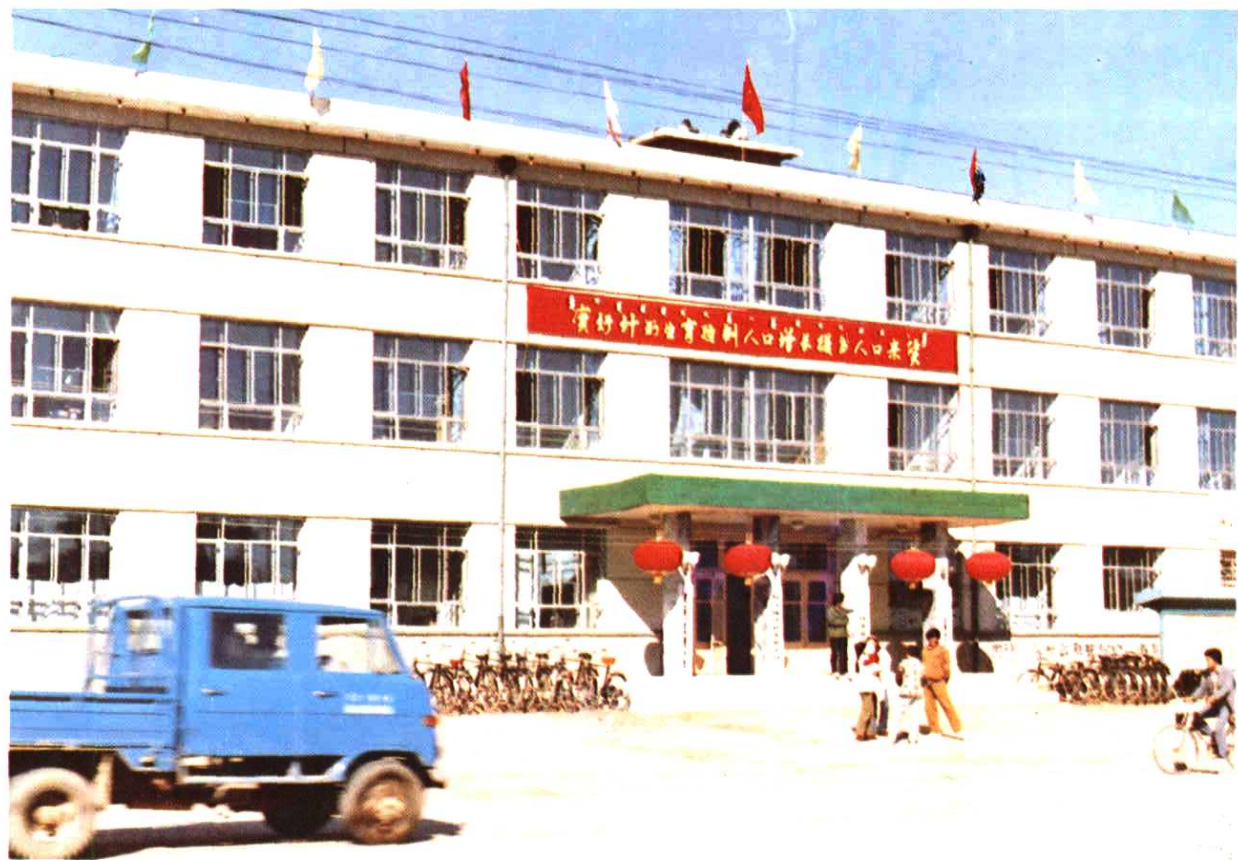
敖汉旗计划生育委员会办公楼