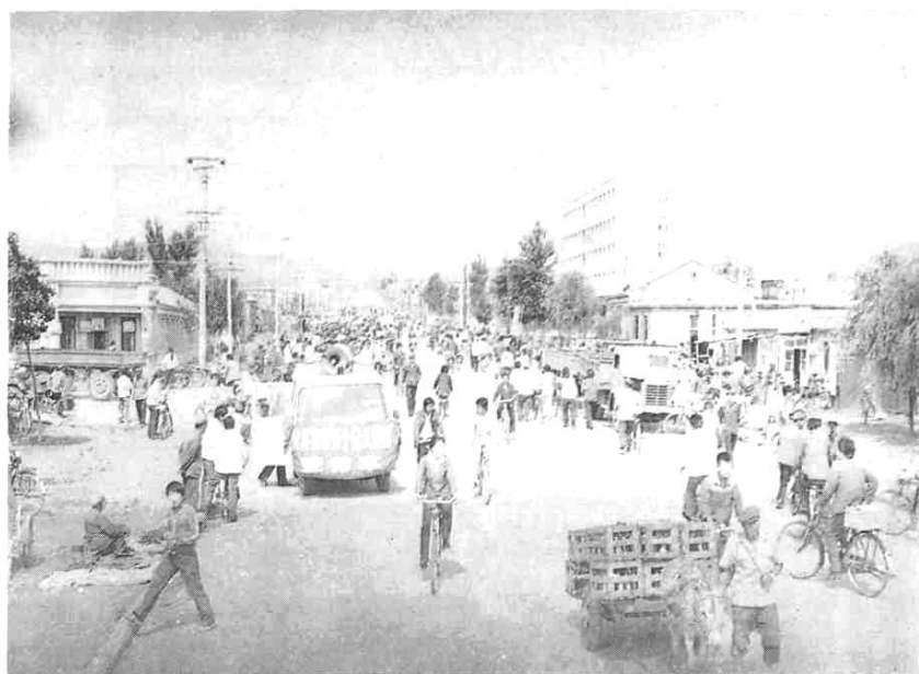
计划生育委员会宣传车在街头宣传