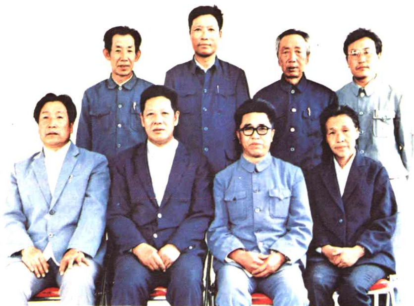
《敖汉旗人口志》审稿人员合影