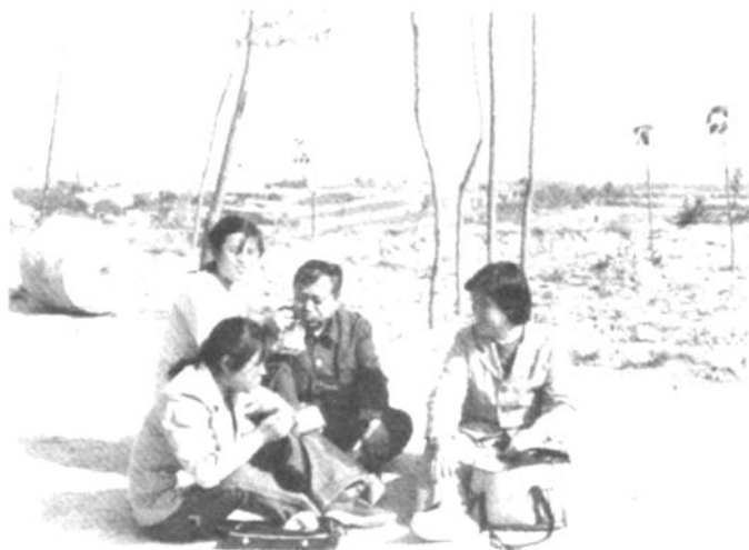
调查建陵 休息期间用餐