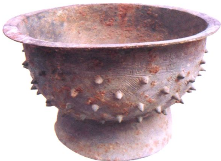
(三) 泔河坝出土西周铜簋