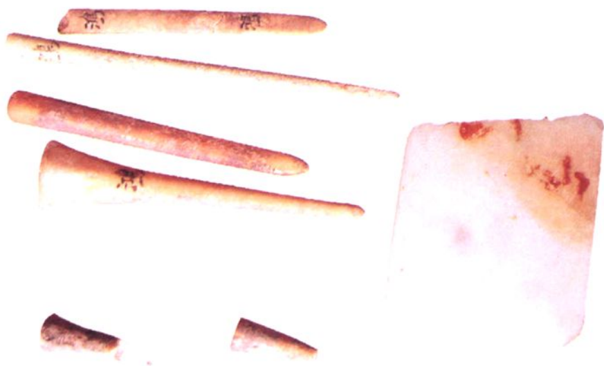
(一) 鸿沟遗址出土骨、玉器