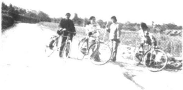
1987年作者同家人 调查建陵回归时情景