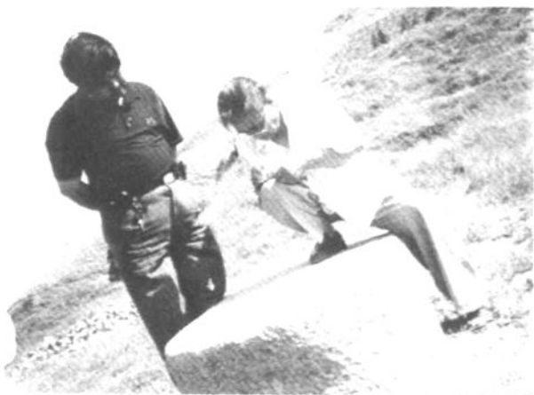
2003年同家人 调查昭陵时情景