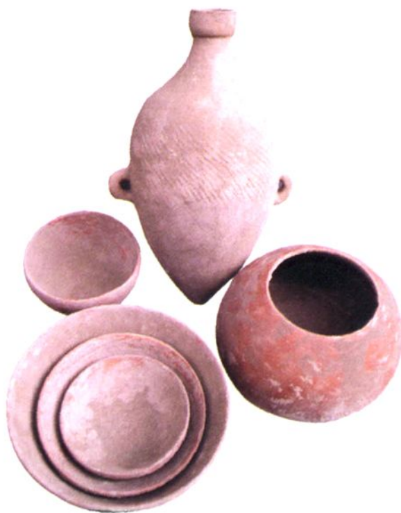
(二) 宁家遗址出土陶器