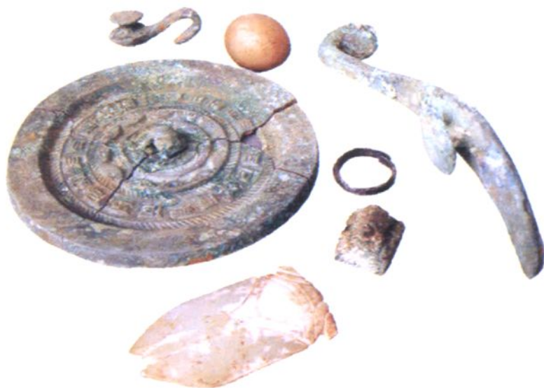
(四) 泥河大桥出土铜镜、玉蝉