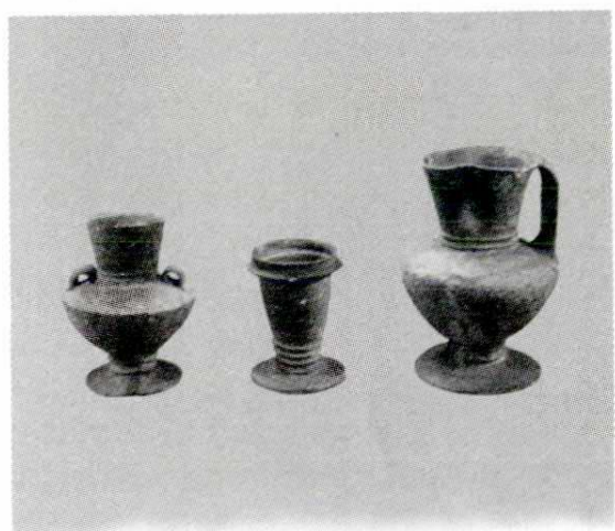
觶、杯、壺（新石器时期）