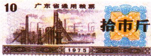
60、70年代国家、广东省粮票式样