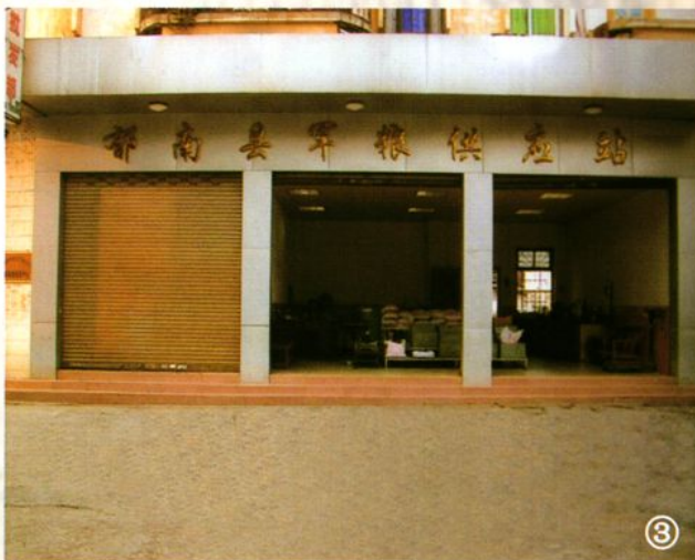
③郁南县军粮供应站、粮油贸易总公司