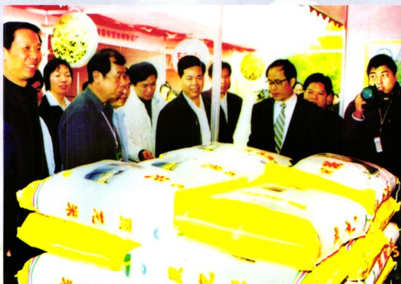
市委书记郑利平（右三）、市长欧真志（右五）、市委副书记叶志容（左二）等市领导对罗定市米业品牌“聚龙米”赞口不绝。