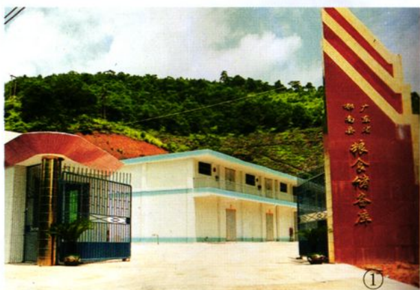
①郁南县粮食储备库