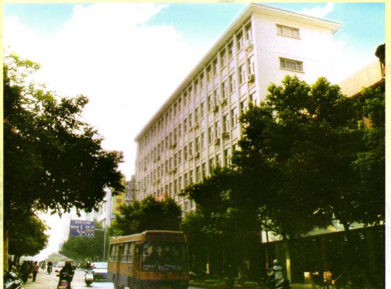
市粮食局办公大 楼全景