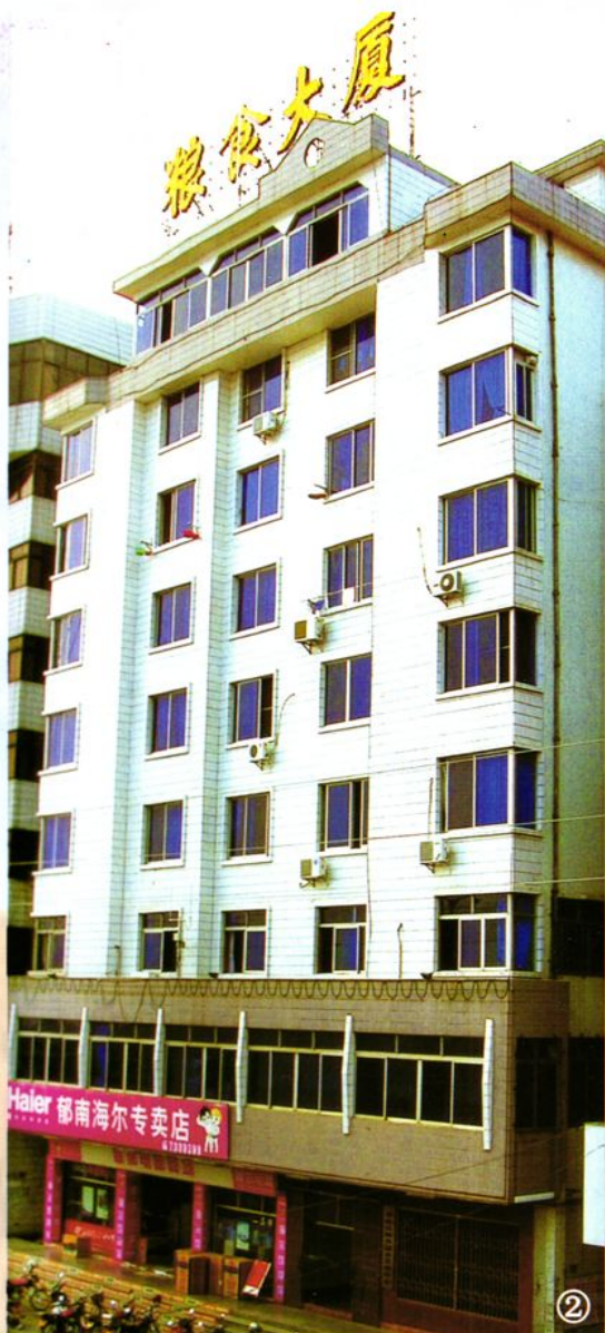
②郁南县粮食大厦全景