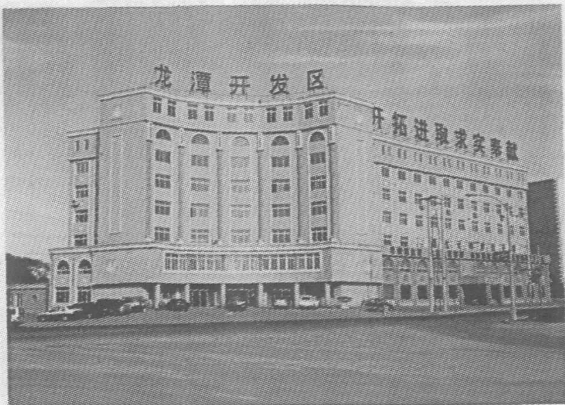
龙潭区经济开发区办公大楼