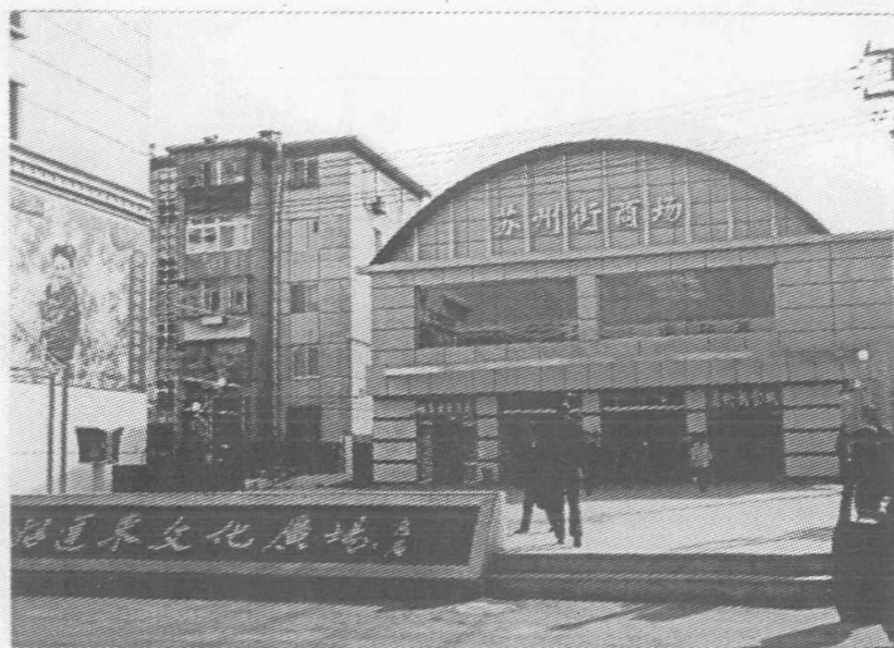
龙潭区土城子街道辖区“苏州街商场”