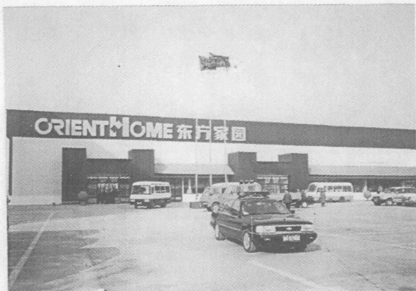
龙潭区土城子街道辖区“东方家园”