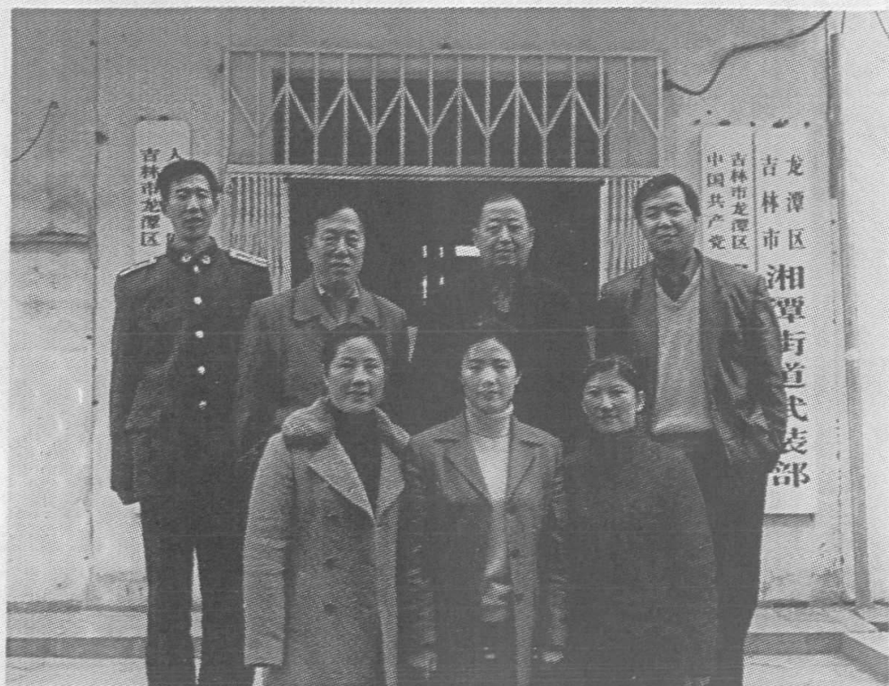
吉林市龙潭区土城子街道班子成员合影