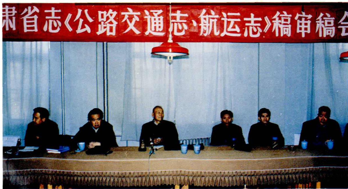
全国政协常委、省地方史志编委会主任王秉祥（左3）在《甘 肃省志·公路交通志》、《甘肃省志·航运志》审稿会议上作重要讲话