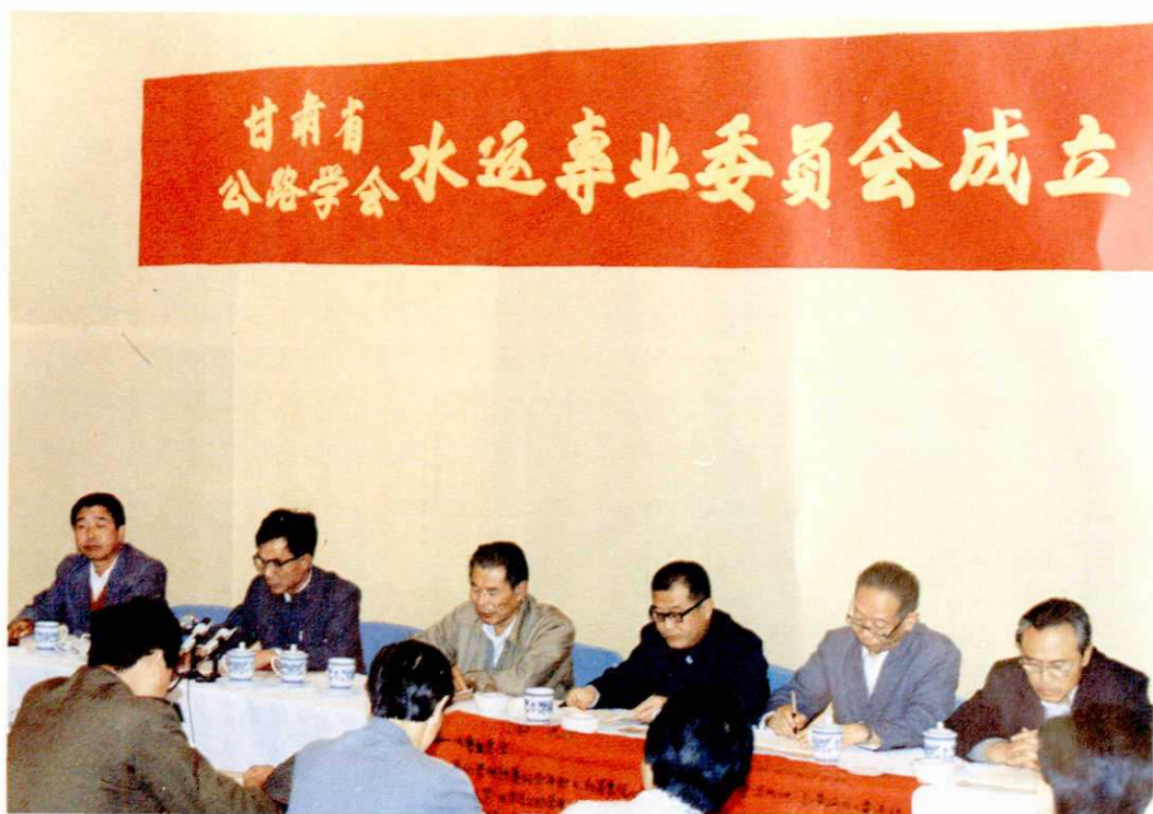
甘肃省公路学会水运专业委员会成立大会