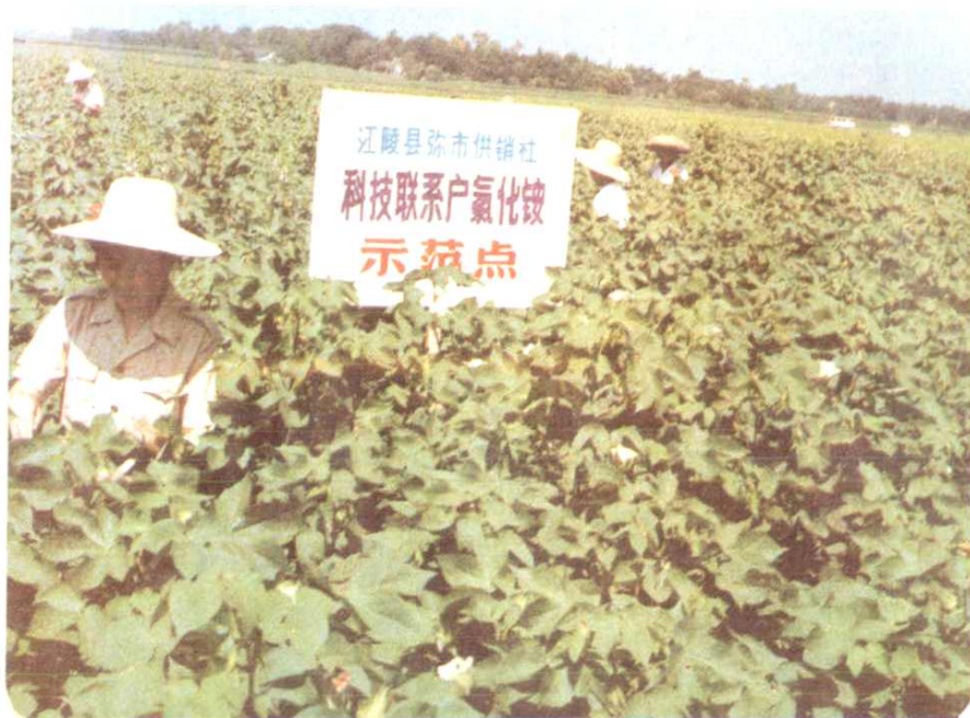
江陵县弥市供销社科技下乡