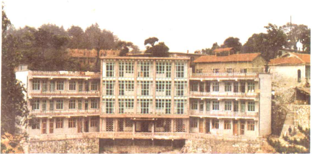
湖北省供销合作社联合社九宫山休干所