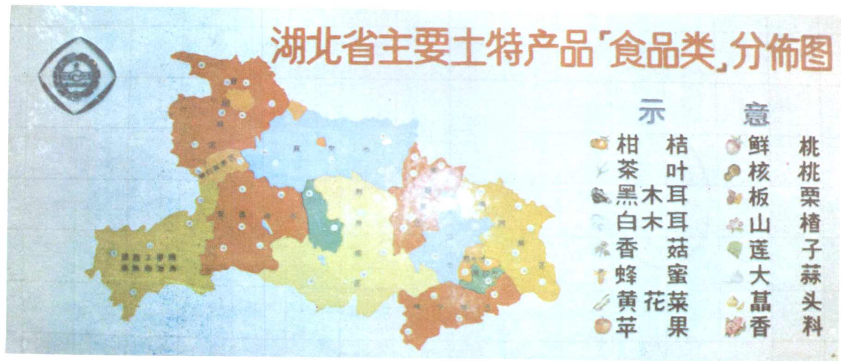
湖北省主要土特产品“食品类”分布图