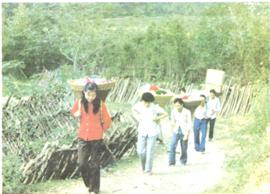
南漳县长坪区供销社职工背篓送货上山