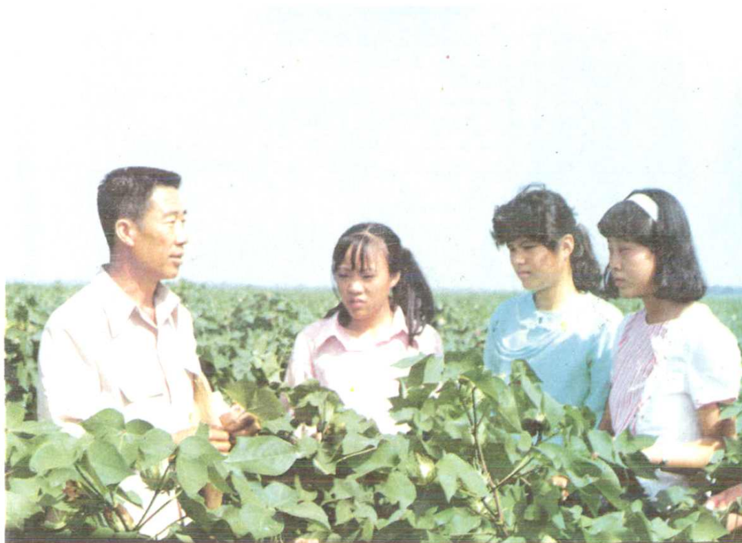
枣阳县罗岗供销社技术员向棉农传授防治红铃虫的新技术