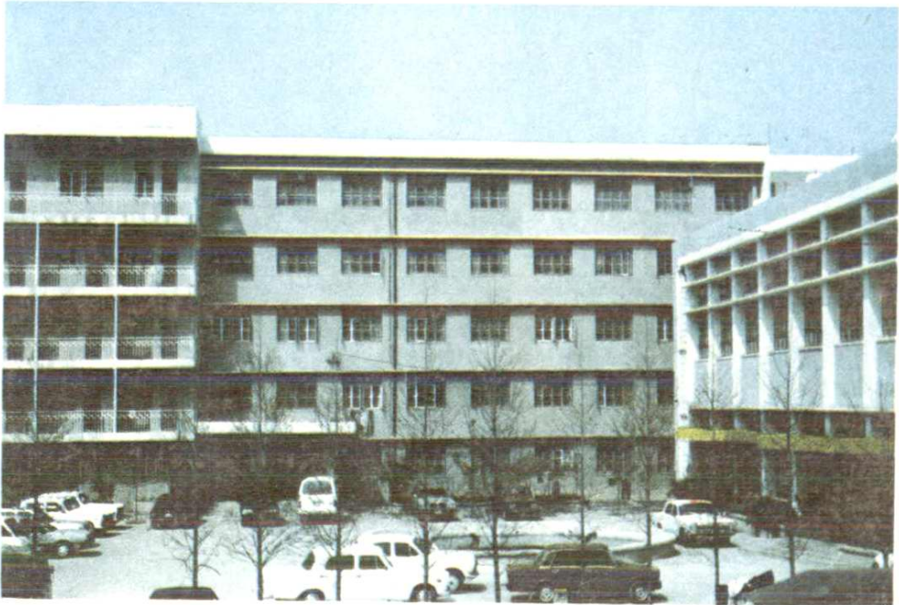
湖北省供销合作社联合社汉阳十里铺招待所