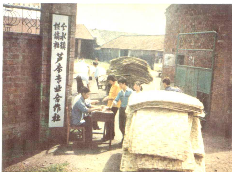
我省最早的一个专业合作社—— 汉川县分水县芦席专业合作社