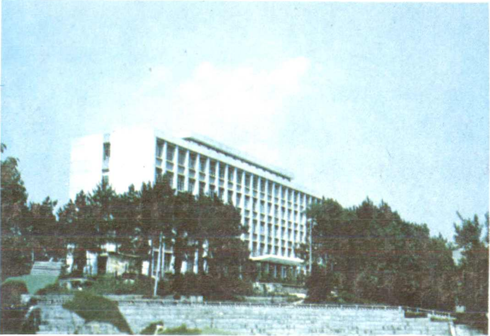
湖北省供销合作学校教学大楼