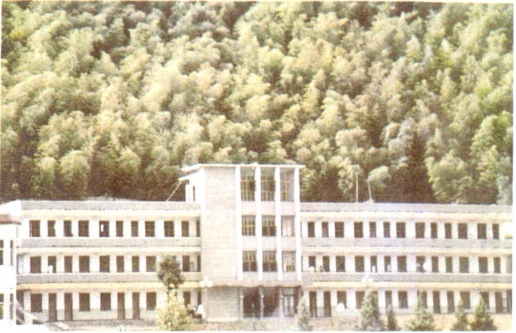
湖北省供销合作社联合社荆沙（崇阳县）休干所