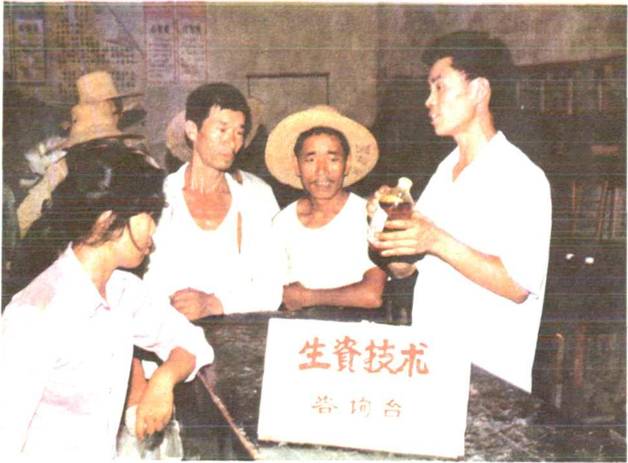
松滋县八宝供销社农资技术员向农民传授 合理使用化学农药知识