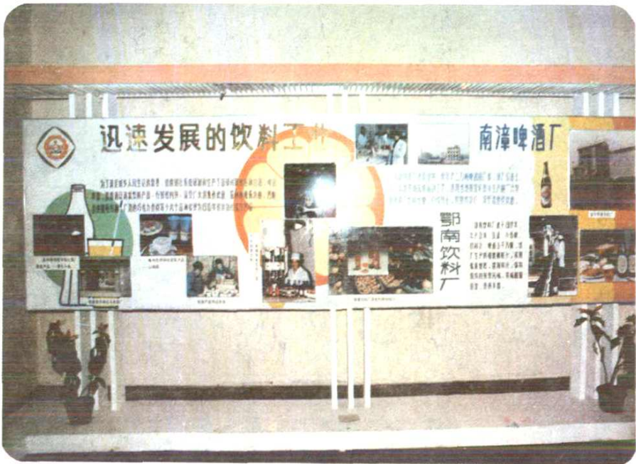
湖北省供销社商办饮料工业迅速发展 ——赴京展览图解之一