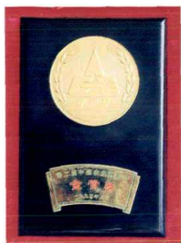
被山东省评为“特优” 的红富士苹果，又荣获中 国农业博览会金奖