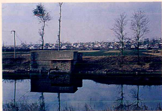
配套的水利设施，遍布在村庄周围