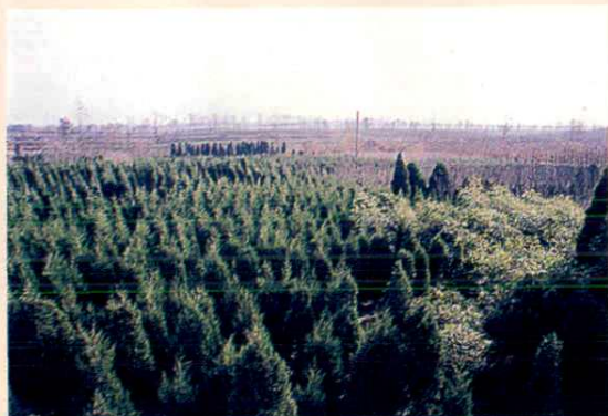
开发出来的苗圃既有为本村大面积绿化培植的苗木 又有从各地引进的优质果树品种