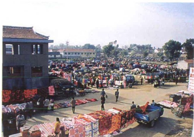
霞坞大集历史悠久，如今更是喧闹繁华