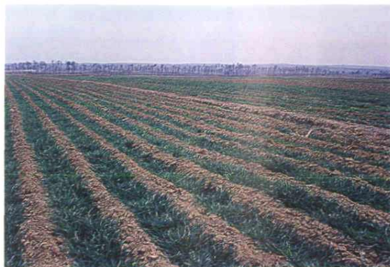
昔日春天白茫茫，夏日水汪汪的盐碱涝洼地成为稳产高产田。这是凤翅岭上的一片麦田