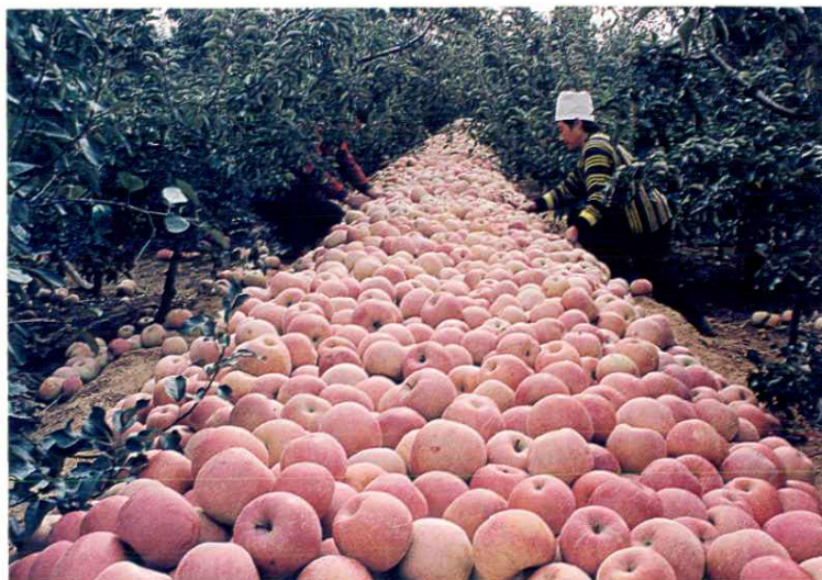
仅果业一项，1997年人均收入达1300元