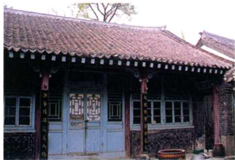
设在旧宅院内的卫生所