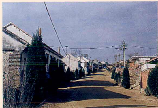
清洁宽阔的街道和座落有序的住宅