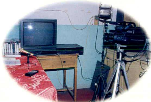
村里自办闭路电视节目