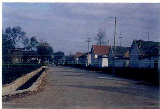
宽畅的街道 整齐的住宅