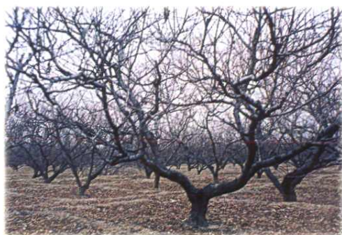
依靠科学技术发展起来的优质桃园