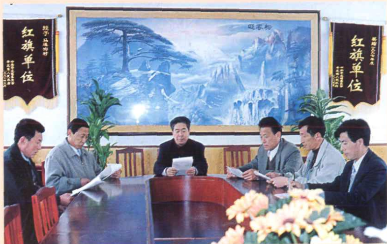
团结奋进的领导班子