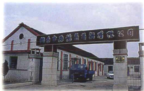
飞龙葡萄酒有限公司