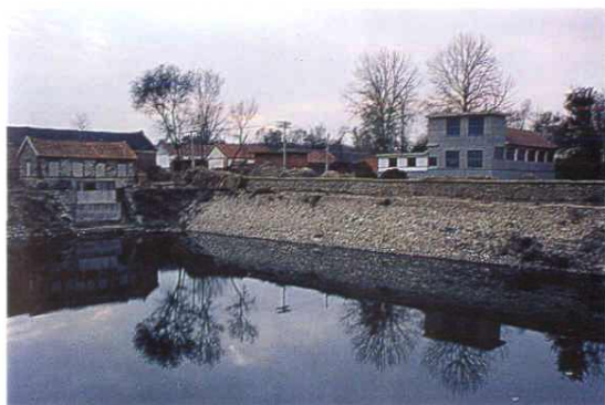
配套的水利设施，使全村基本实现水利化