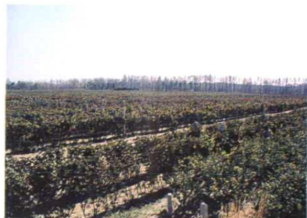
大沽河畔千亩葡萄果园，将优质葡萄源源送进张裕葡萄酒厂