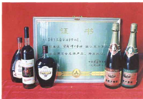
飞龙葡萄酒有限公司生产的葡萄酒及获得的奖牌