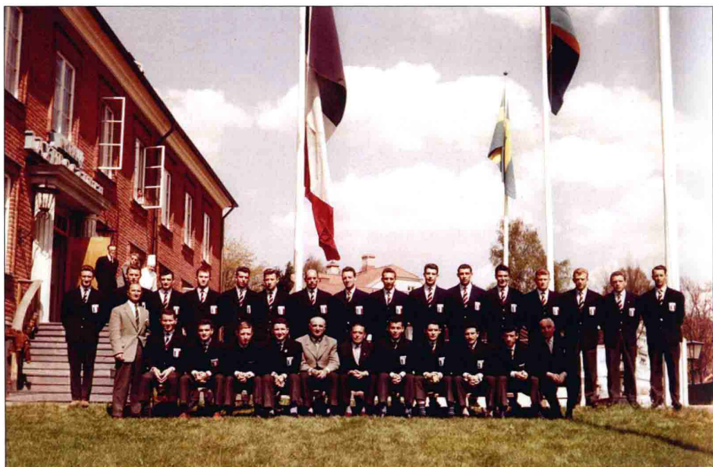
人才济济的法国队获得在瑞典举办的1958年世界杯第三名，方丹在6比3大胜西德队的季军争夺战中，一人攻进4球。