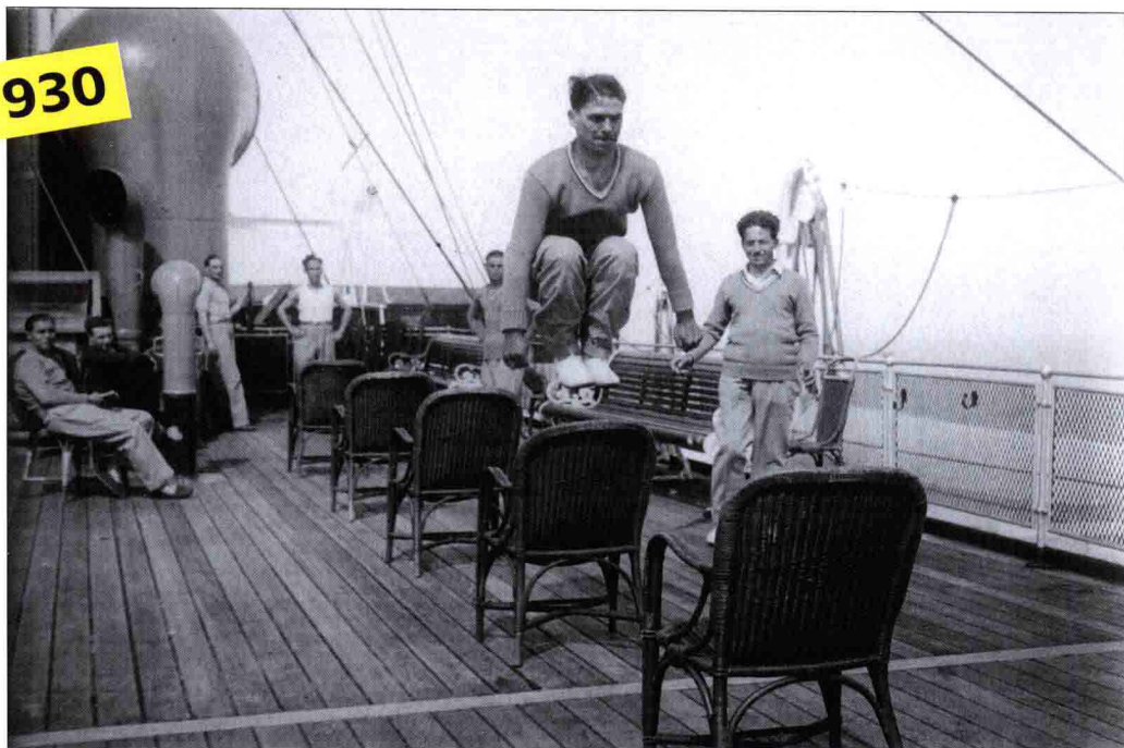
在前往乌拉圭的邮轮上，法国球员德尔富（Edmond Delfour）利用船上有限条件进行训练，可惜的是法国队未能在小组中出线。