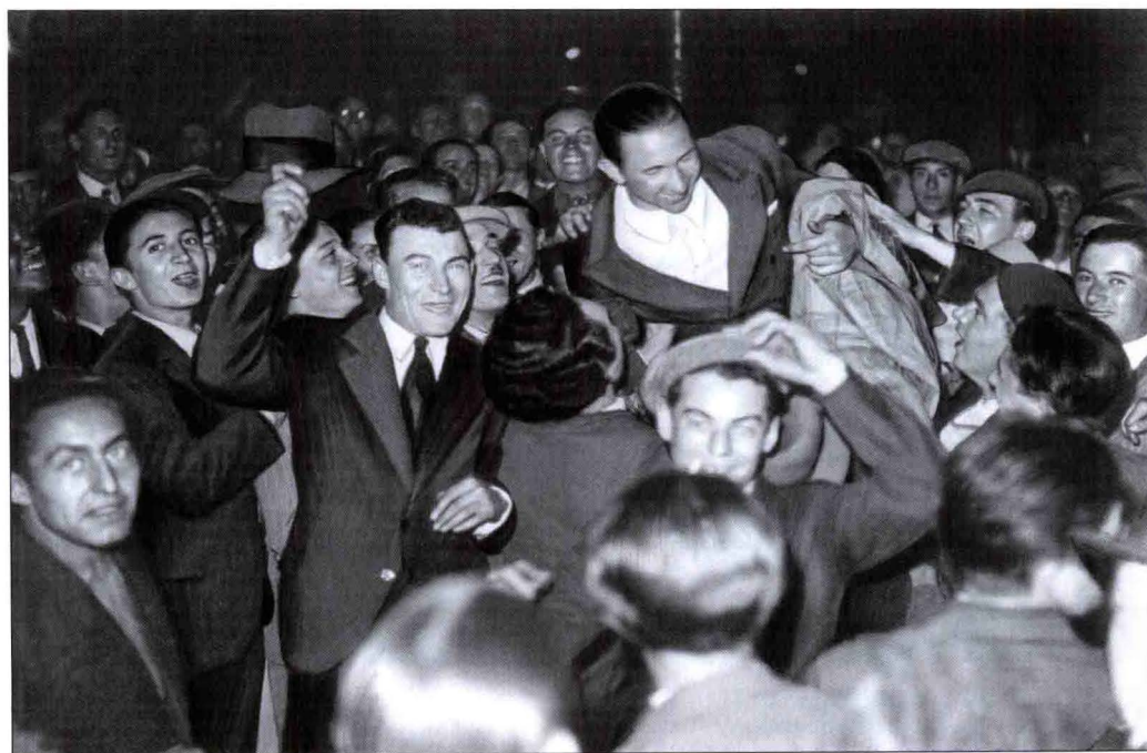
法国队抵达都灵后，受到球迷的热烈欢迎，他们将在以意大利法西斯头子贝尼托·墨索里尼名字命名的球场内进行比赛。