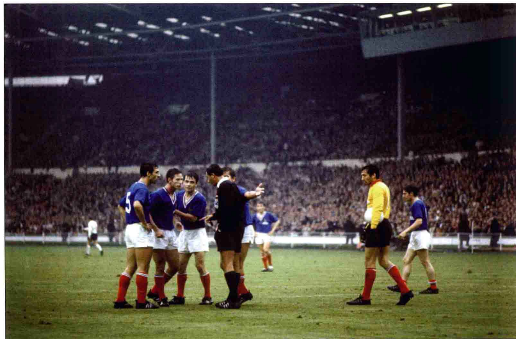
法国队在本届世界杯上是唯一一支拥有3名主教练的球队，3场比赛居然采用了3种战术，结果未胜一场（1平2负）。