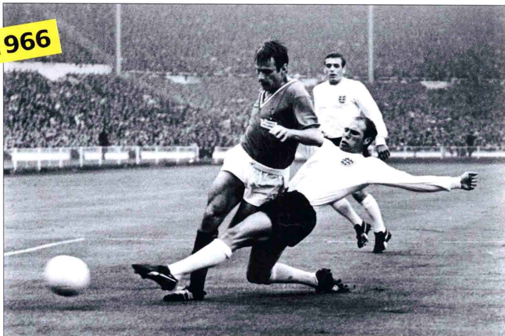
法国中场球员贡代（Philippe Gondet，左）与英格兰后卫雷·威尔逊（Ray Wilson），结果法国队在温布利球场0比2败北。