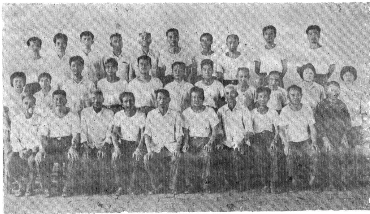
政协信丰县第五届委员会常委合影