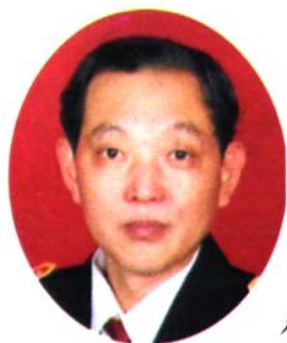
本志编写人李京洲