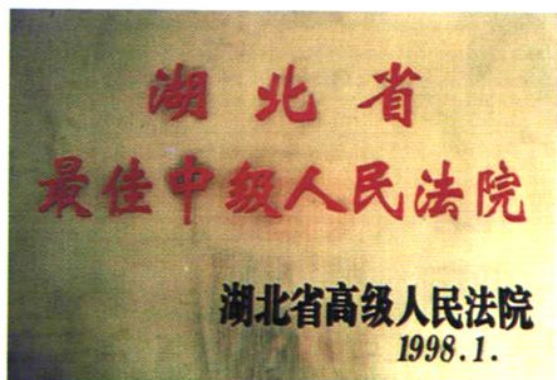
1998 年 1 月，黄冈市中院荣获湖北 全省最佳中级人民法院称号