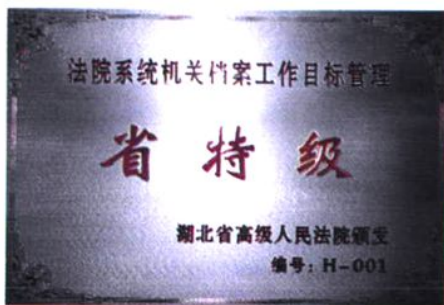
黄冈市中院档案管理，1999 年 10 月评为湖北全省特级