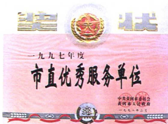
黄冈市中院评为 1997 年度黄冈市 直优秀服务单位