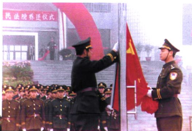
黄冈市中院机关于1997年 11月20日举行乔迁仪式。图为举行 升旗和宣誓列队。