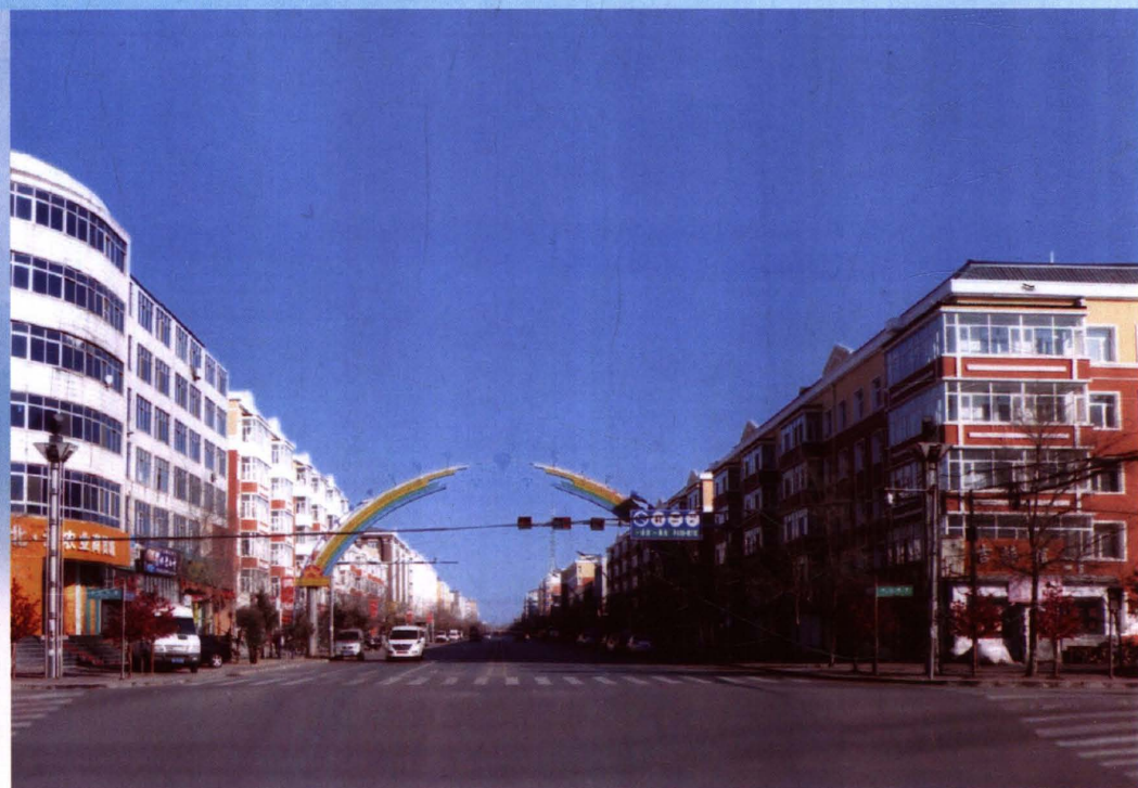
青冈县中央大街街景