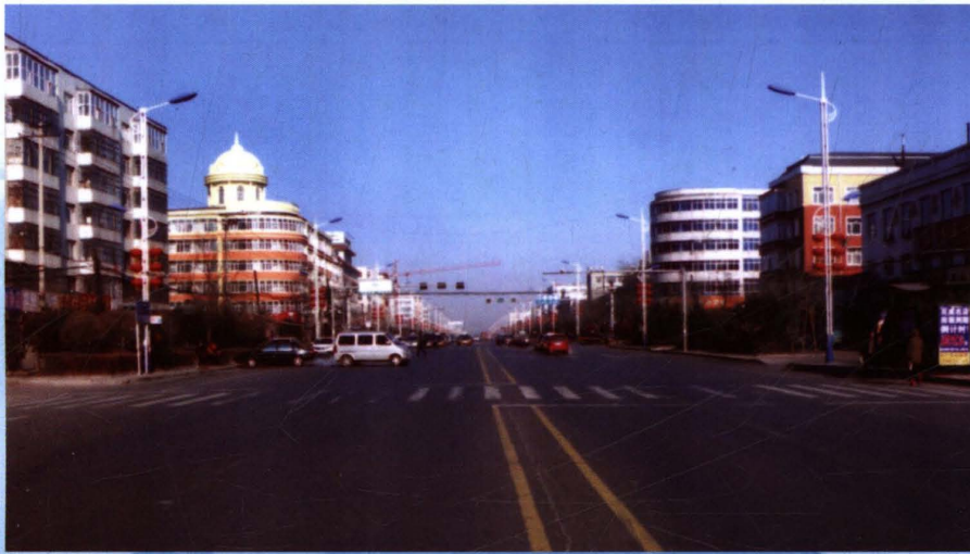
哈一黑公路青冈段