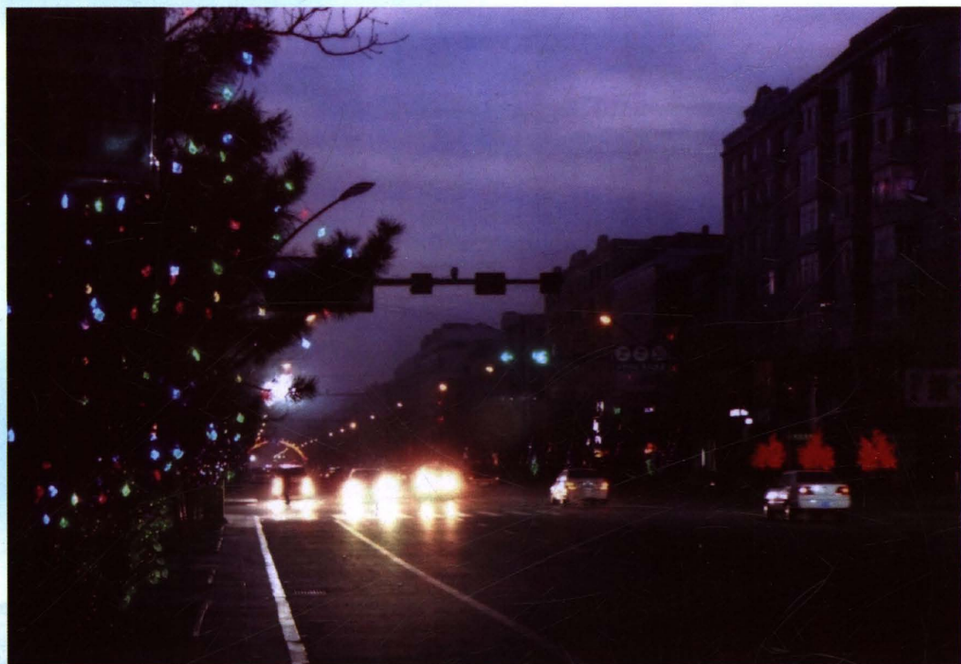
青冈县中央大街夜景