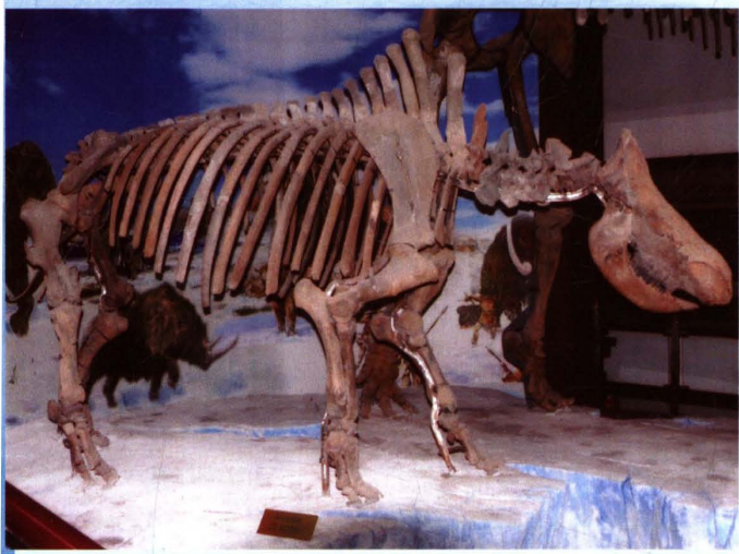
青冈县博物馆 披毛犀