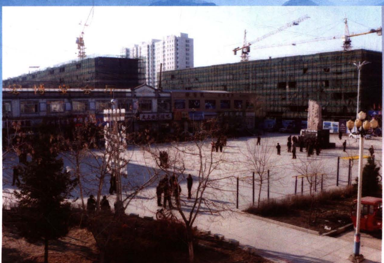
青冈县怡 景家园小区