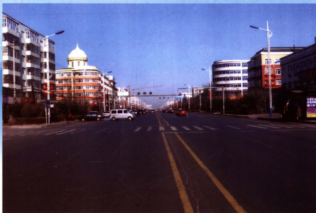
哈一黑公路青冈段