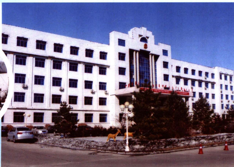
中共青冈县委、县人民政府办公大楼