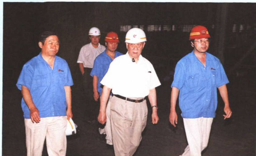
2003年8月29日，国家民政部原部长崔乃夫（右二）到中型型钢厂检查指导工作。