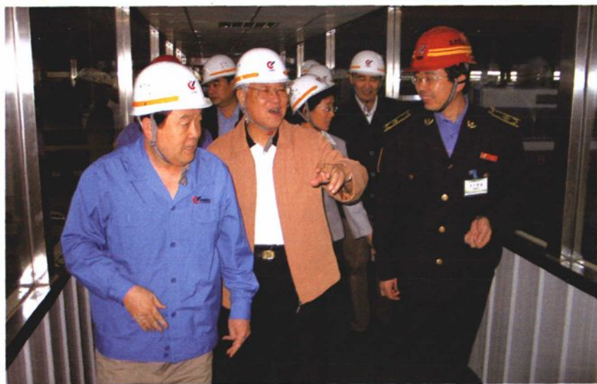
2005年9月22日，山东省人大常委会原主任赵志浩（中）参观大型H型钢生产线。