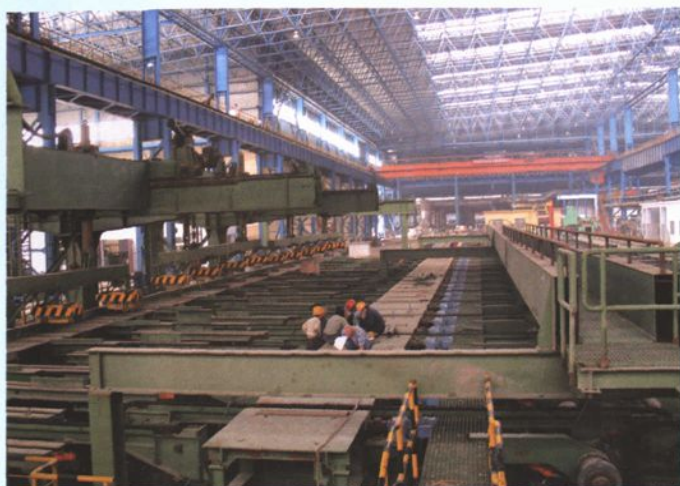
大型H型钢码垛机调试场景