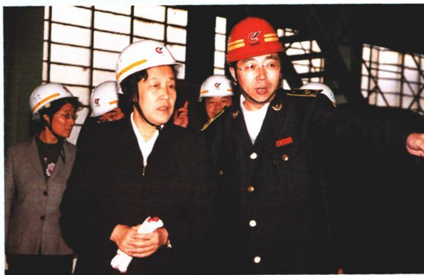
2003年11月3日，中共山东省副书记、省政协主席吴爱英（前右二）到中型钢厂检查指导工作。