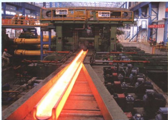
大型H型钢生产线生产场景