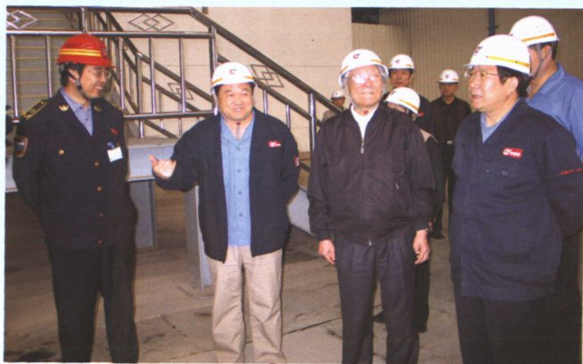
2005年9月26日，中共山东省委原书记苏毅然（左三）到中型型钢厂检查指导工作。