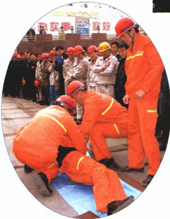
2005年10月27日，组织职工进行煤气安全知识培训。图为煤气中毒急救演练。