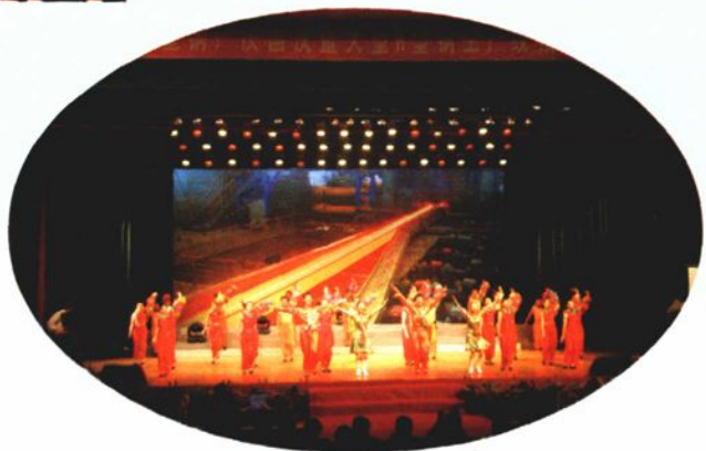
2005年9月29日，在莱钢工人文化宫举行庆国庆暨大型H型钢生产线投产文艺晚会。