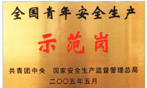
2005年5月，中型型钢厂获全国青年安全生产示范岗称号。