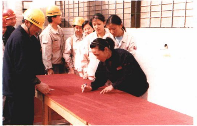
2001年5月，举行“安全手拉手”承诺签字仪式。