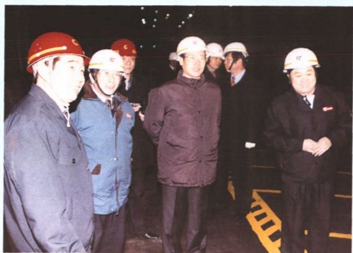
2002年1月15日，中共山东省委书记、代省长张高丽（中）到中型型钢厂检查指导工作。