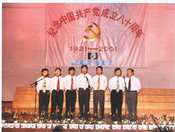
2001年6月，举行庆祝中国共产党成立80周年文艺演出。