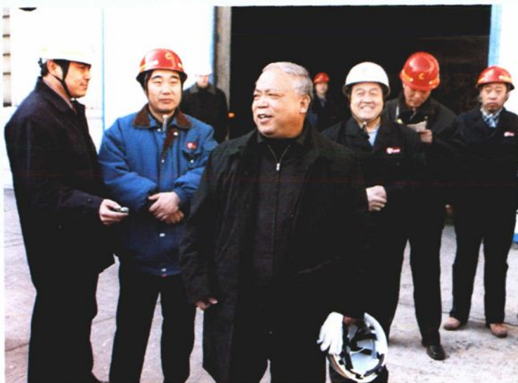
2002年1月1日，中共山东省副书记王修智（左三）到中型钢厂慰问一线职工。