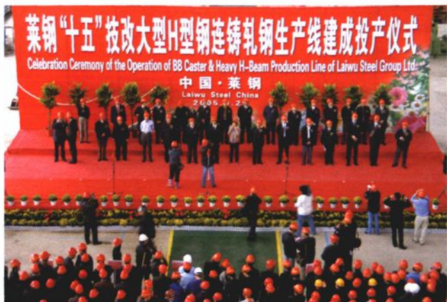
2005年9月29日，举行大型H型钢生产线投产仪式。