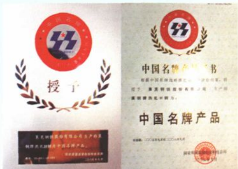
2005年9月，H型钢获中国名牌产品称号。