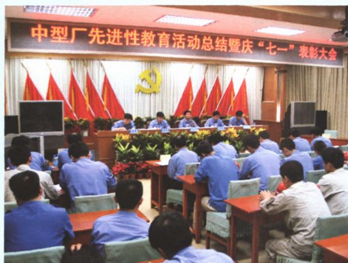
2005年6月30日，召开保持共产党员先进性教育活动总结暨庆“七一”表彰大会。