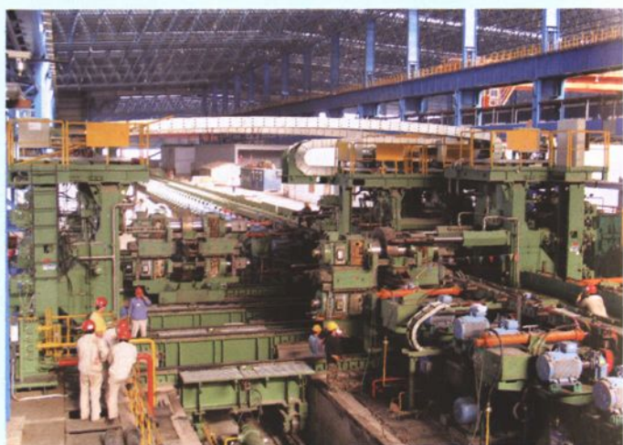
大型H型钢轧机实现自动化换辊