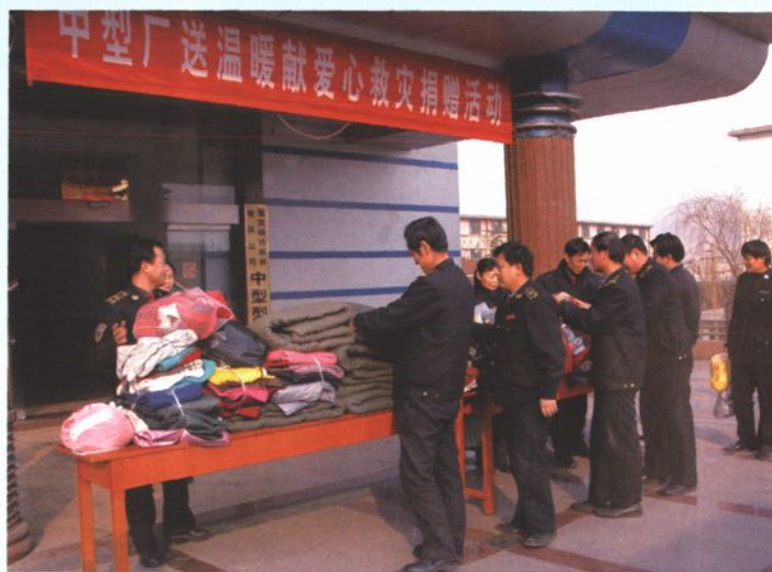
2005年12月19日，中型钢厂举行送温暖献爱心救灾捐赠活动。