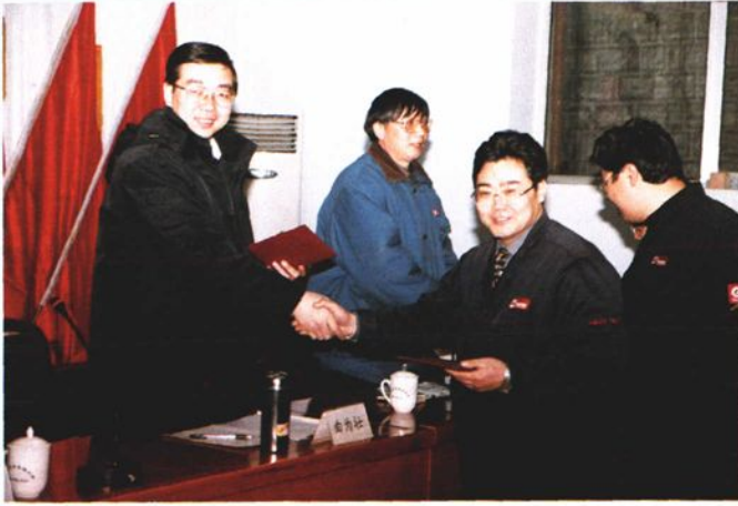
每年一度的年度安全环保工作会议