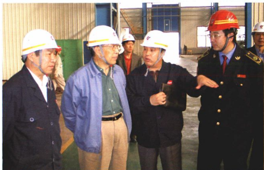
2005年10月16日，山东省人大原副主任马仲才（左二）参观大型H型钢生产线。