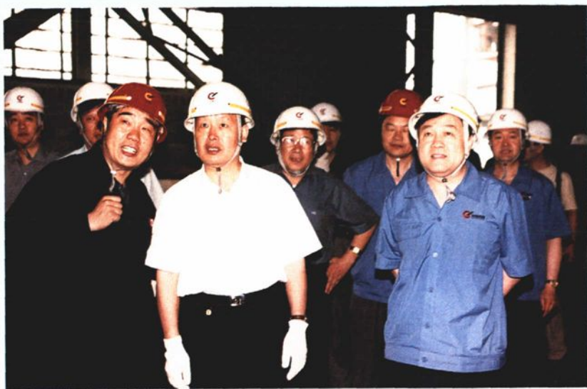
2001年6月22日，中共山东省委书记陈建国到中型钢厂视察。