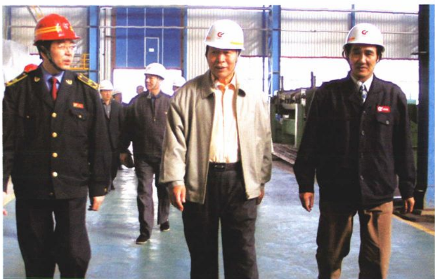
2005年10月14日，国家司法部原部长高昌礼（中）参观大型H型钢生产线。