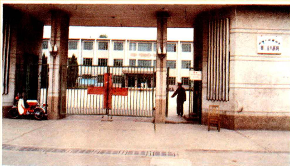
中国人民解放军第二五八医院