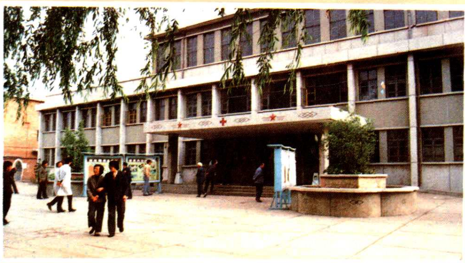
原晋东南地区第二人民医院