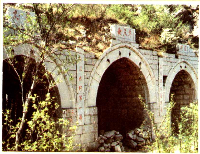
卢医山上的卢医石庙