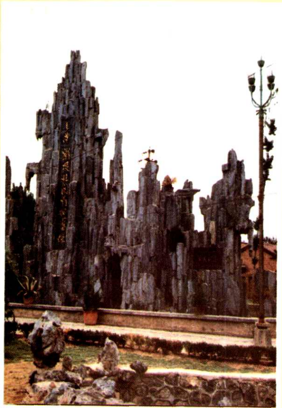
上党战役北关战地旧址