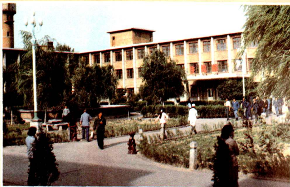
太行白求恩国际和平医院