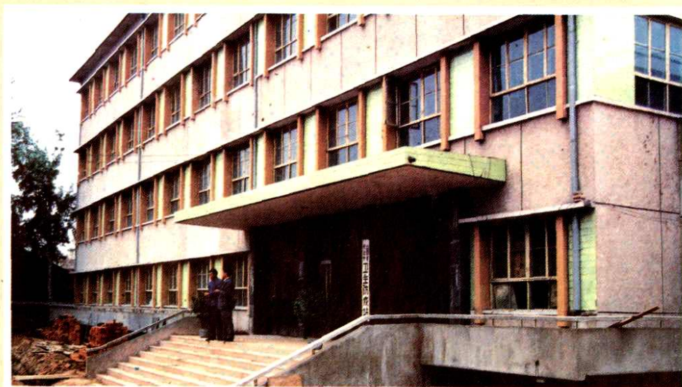
长治市卫生防疫站