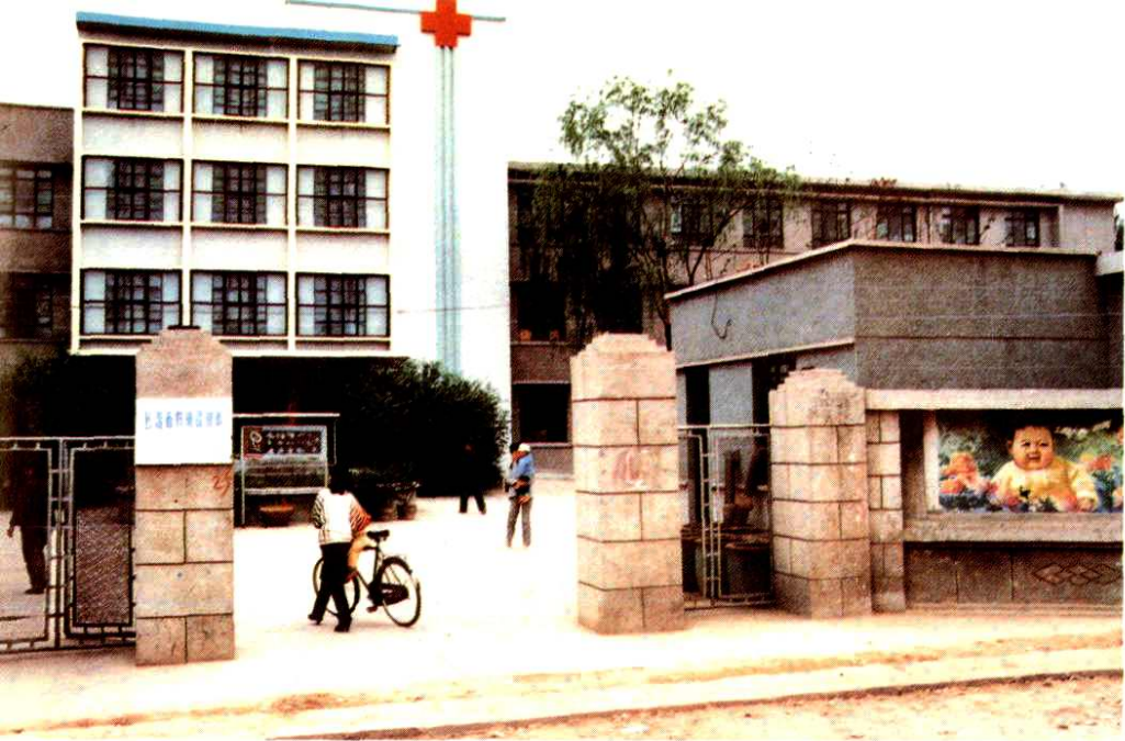
长治市妇幼保健院