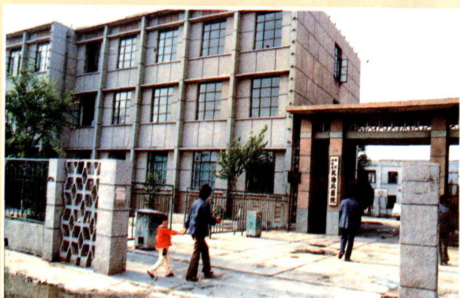
郑州铁路局长治北医院