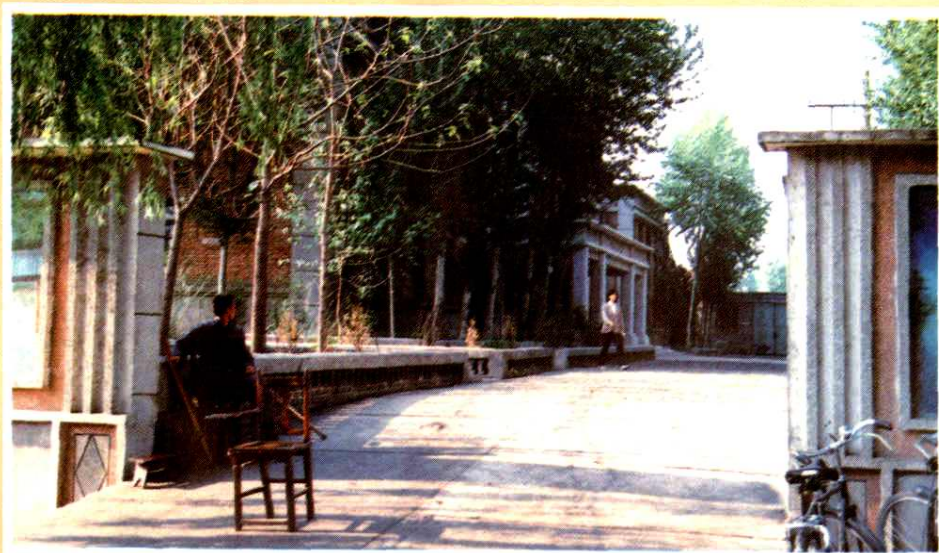
长治市第二人民医院