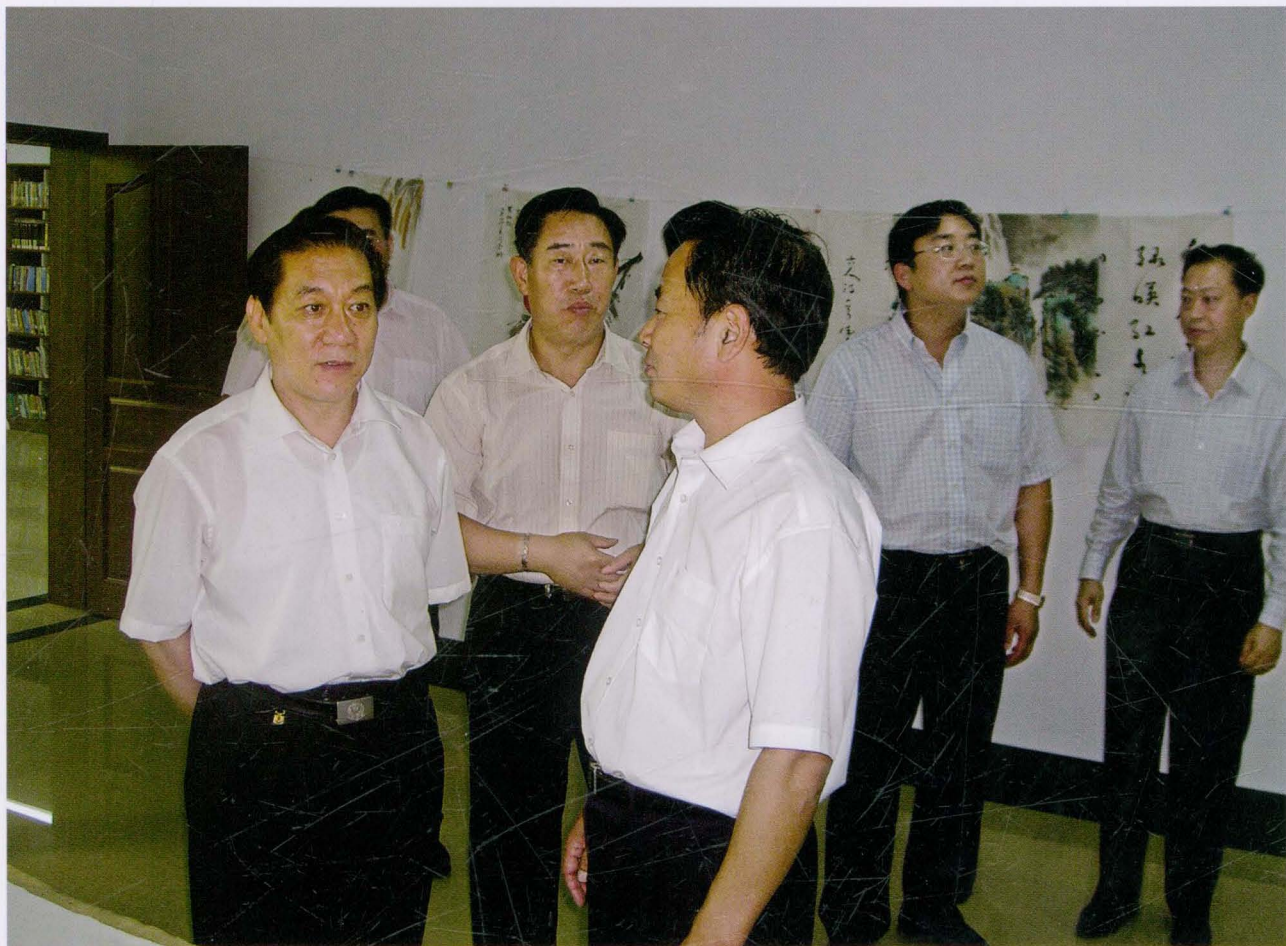
2006年7月5日，中共山东省委副书记高新亭（左一）视察王家村社区。