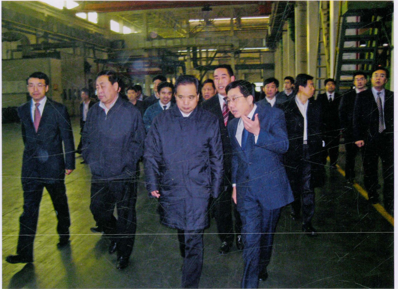
2007年11月26日，中共山东省委书记李建国（左三）视察青岛特汽集团。