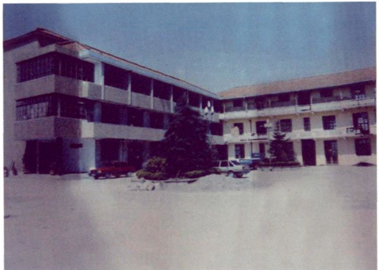
上世纪90年代初厂房