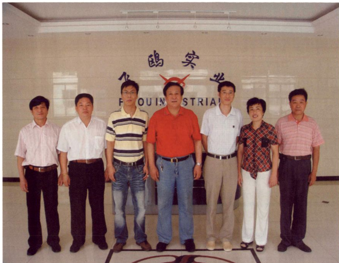
公司领导班子合影。