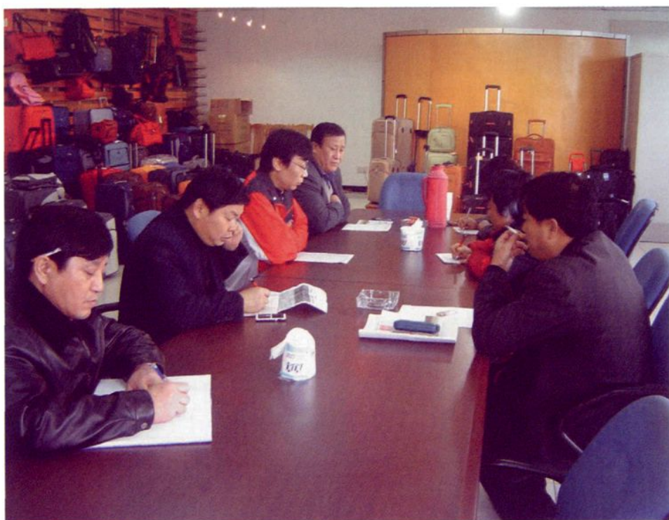
公司领导班子学习