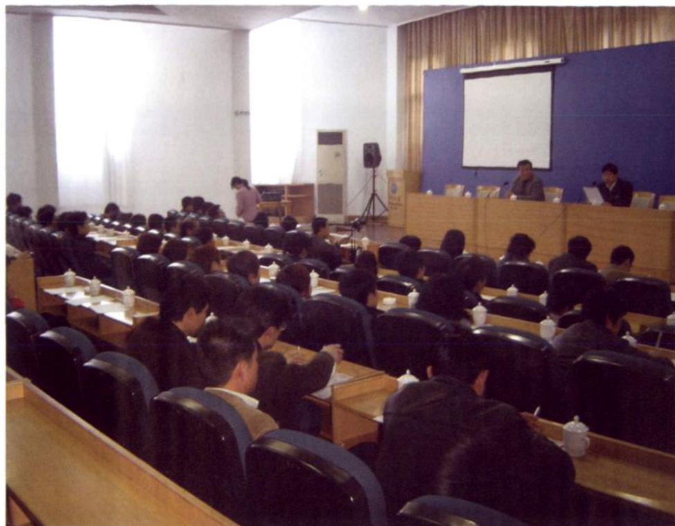
2007年2月20日假座浙江横店召开经济工作会议