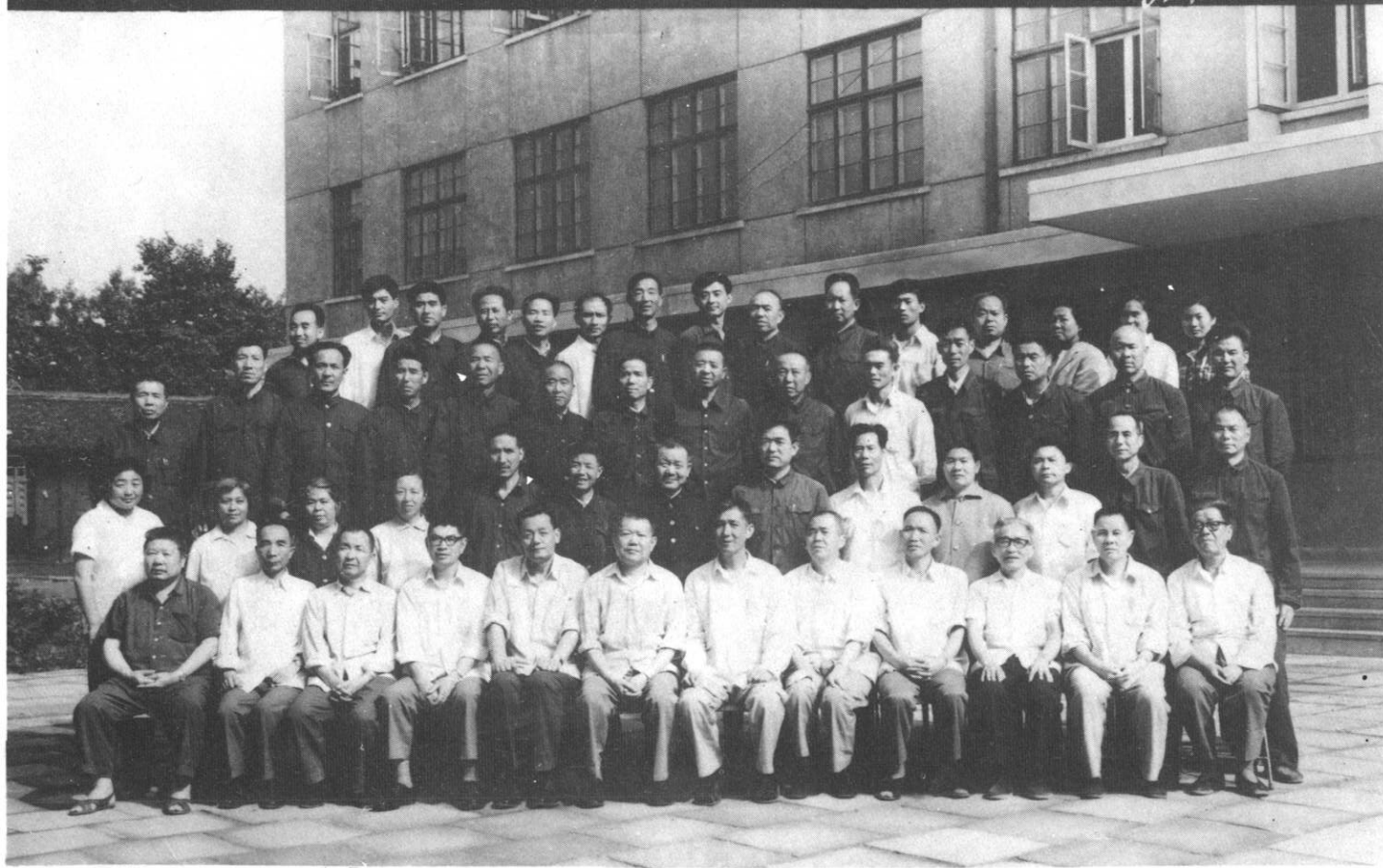
宝鸡市八届人大常委会第一次会议合影