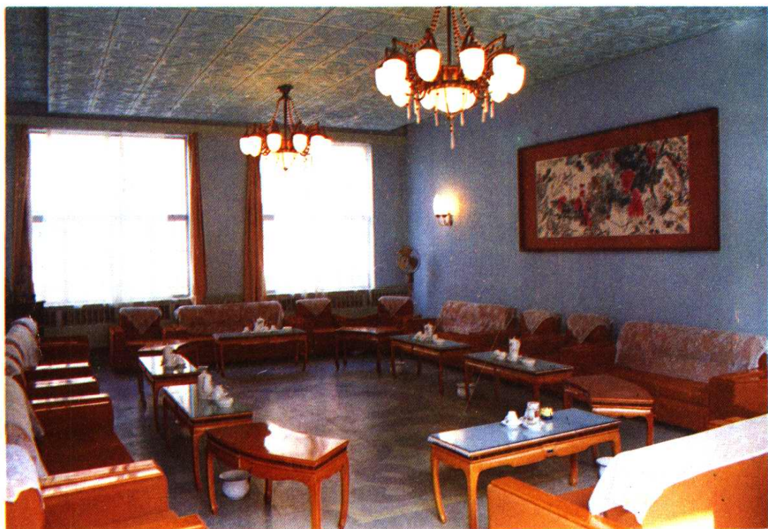
市人大常委会主任会议室