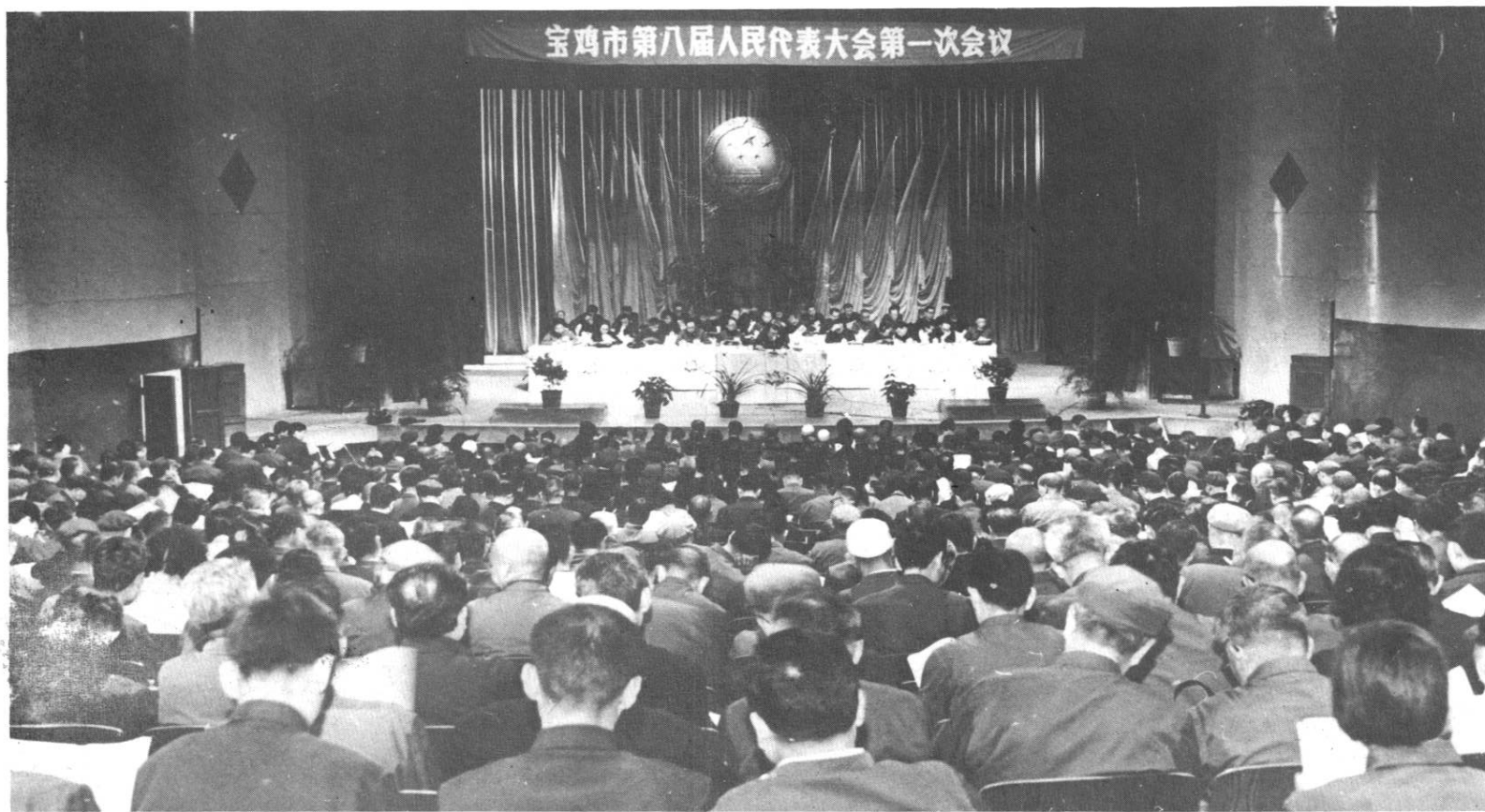
宝鸡市第八届人民代表大会第一次会议