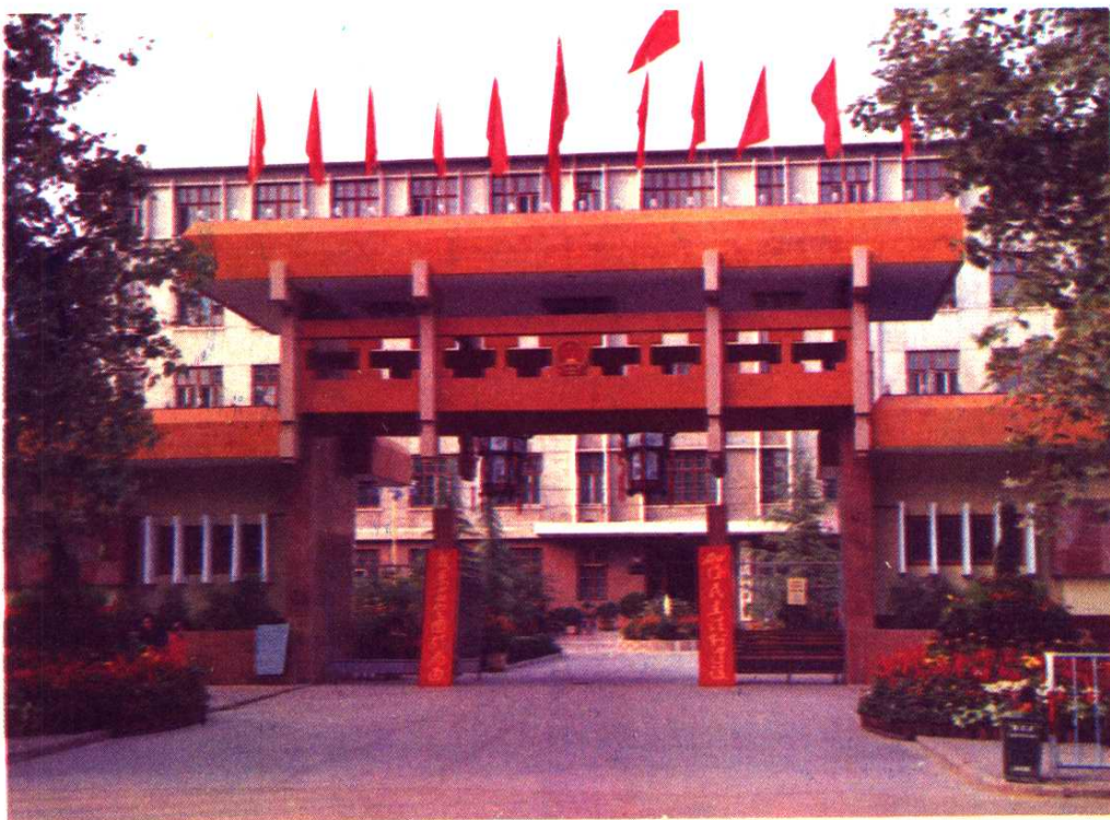
市人大常委会机关大门