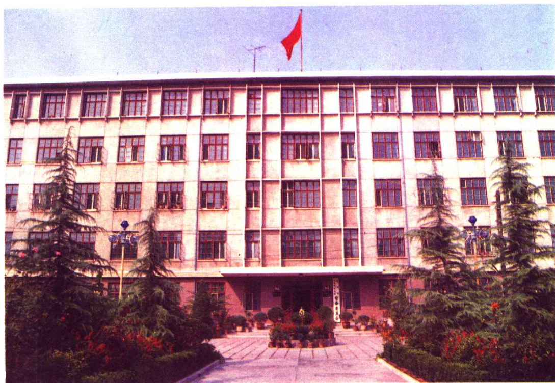
市人大常委会办公楼