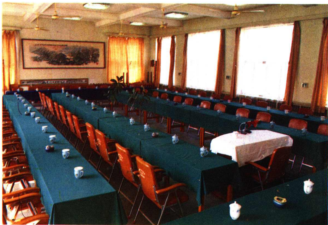
市人大常委会会议室