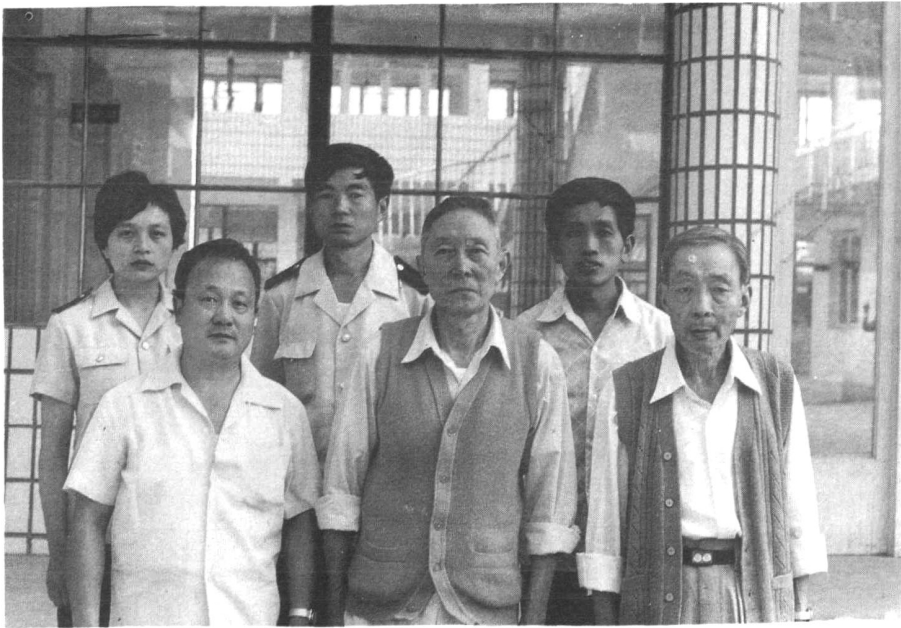
全体编撰人员：从左至右