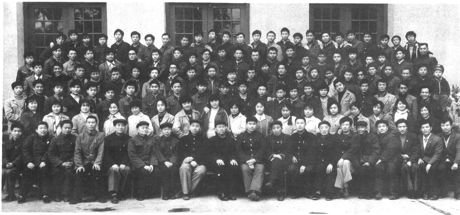
一九八五年区乡财政清帐结帐会议