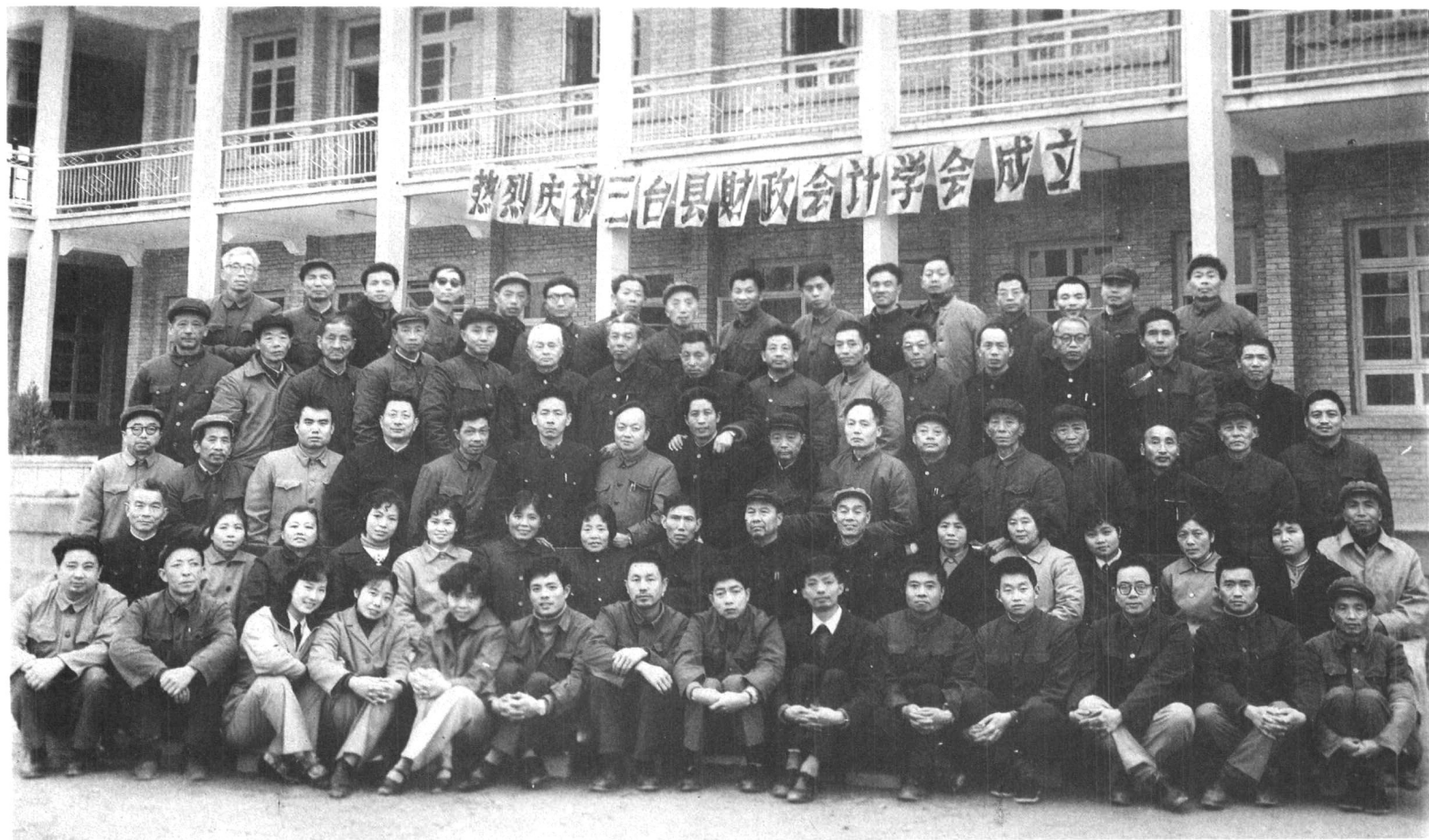
一九八二年财政会计学会成立大会