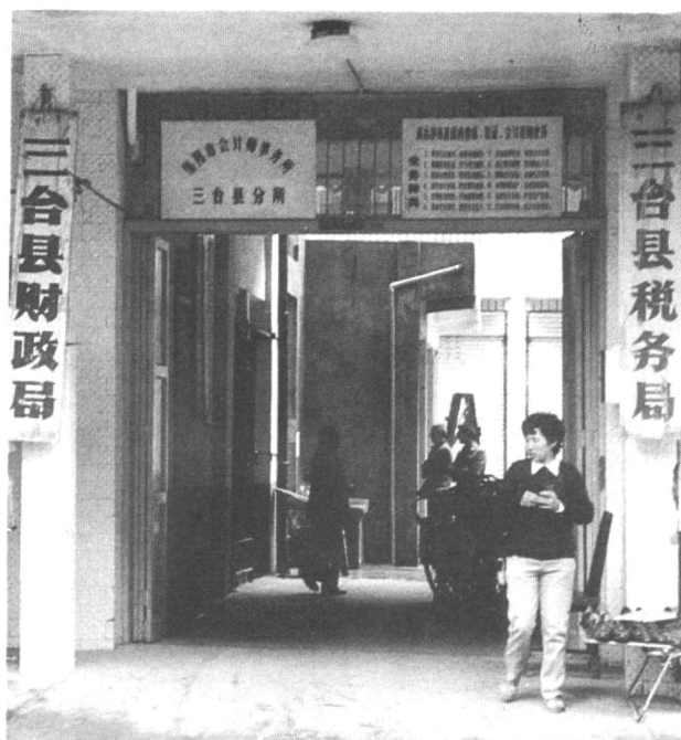
财政局办公大楼正门