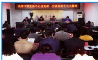
党委书记讲党课——宣讲 十九大精神