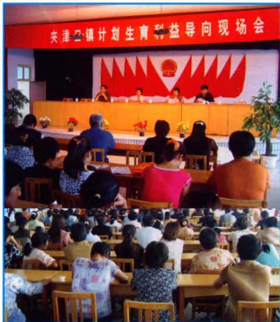
夹津口镇计划生育利益导向现场会