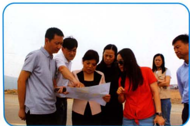
绿城集团到夹津口镇考察旅游投资项目