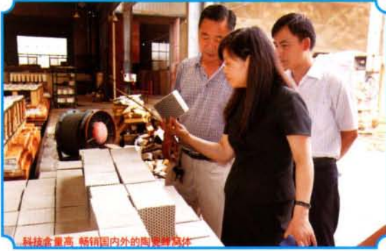
科技含量高，畅销国内外的陶瓷球磨机