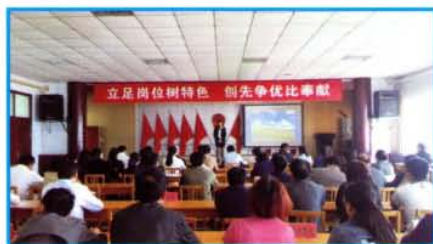
夹津口镇举办“立足岗位树 特色 创先争优比奉献”主题演讲 比赛