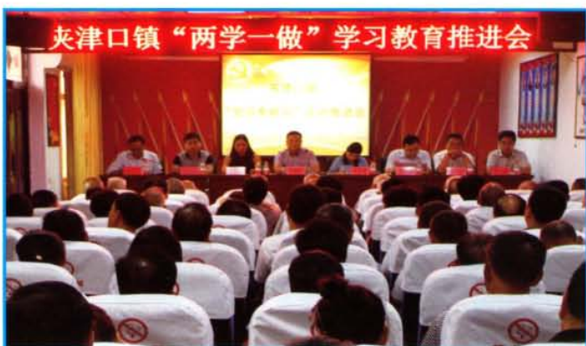
夹津口镇“两学一做”学习教育推进会