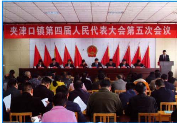
夹津口镇第四届人民代表大会第五次会议