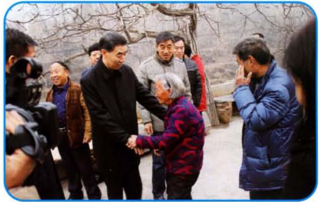
副省长王铁到韵沟村看望贫困户