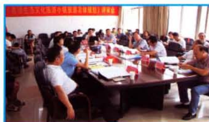
《嵩顶生态文化旅游小镇旅 游总体规划》评审会