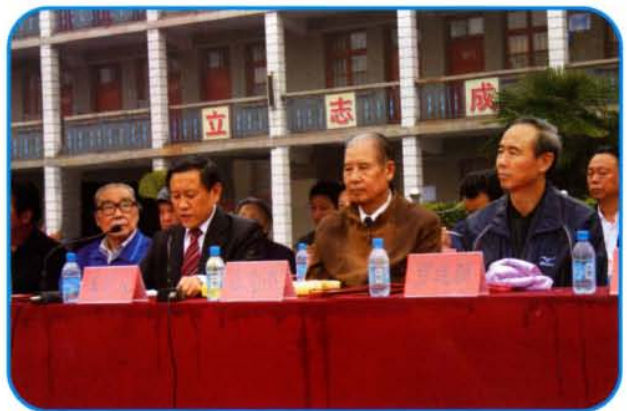
2005年5月4日，抗战老兵张志杰，原河南省委副书记韩劲草，河南省委常委、常务副省长王明义，副省长贾连朝在之朴中学纪念张之朴将军牺牲60周年大会上