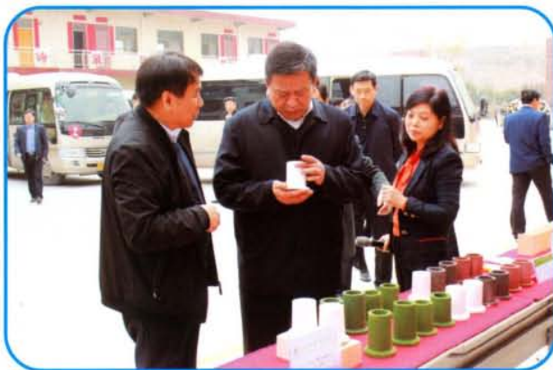
市委书记袁三军到夹津口镇观摩工业转型升级项目