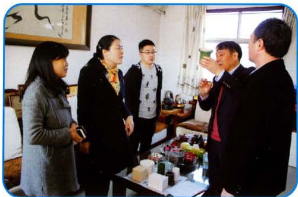
副市长景秀香到企业察看工业项目