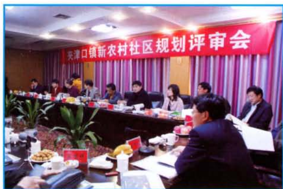
夹津口镇新农村社区规划评审会