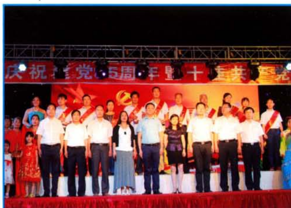
庆祝建党95周年暨十佳共产党员颁奖典礼