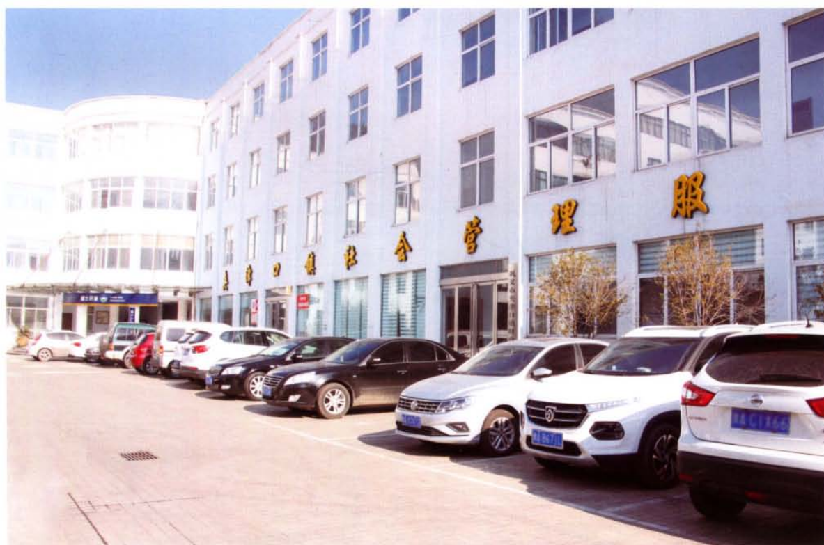
夹津口镇社会管理服务中心