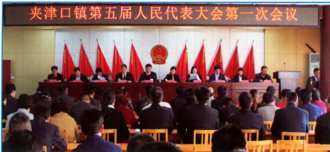
夹津口镇第五届人民代表大会第一次会议