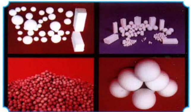
高铝质陶瓷蓄热球和篦子砖