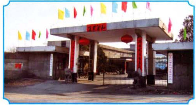
兴化矿业有限公司