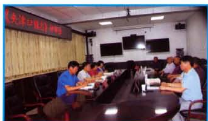
《夹津口镇志》评审会