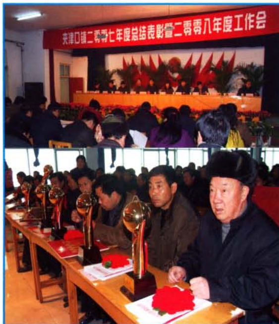
夹津口镇2007年度总结暨2008年度工作会