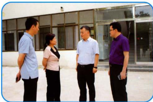
副市长刘军杰到夹津口镇调研旅游投资项目