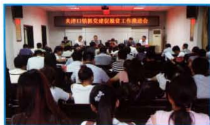
抓党建促脱贫工作推进会