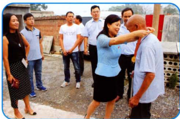
镇领导为50年以上党龄党员授牌