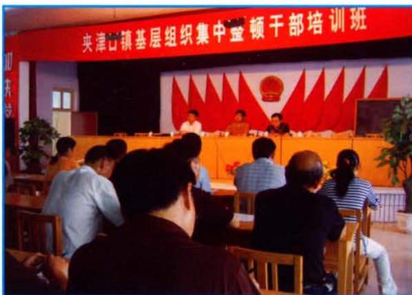
夹津口镇基层组织集中整顿干部培训班