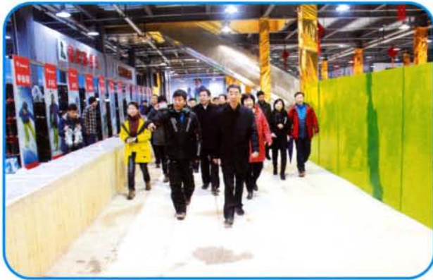
副省长王铁到嵩顶滑雪度假区调研