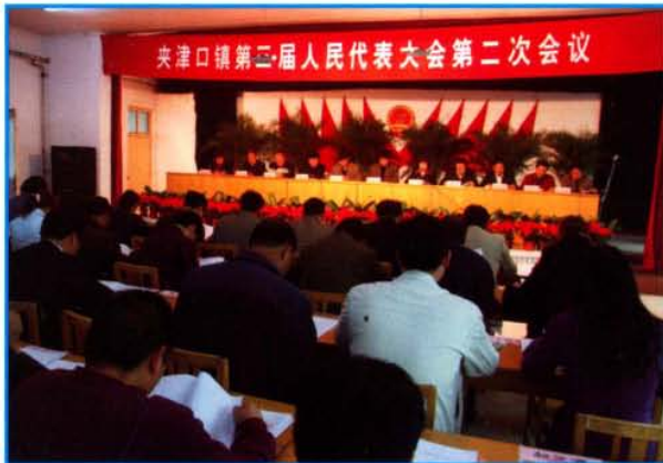
夹津口镇第三届人民代表大会第二次会议