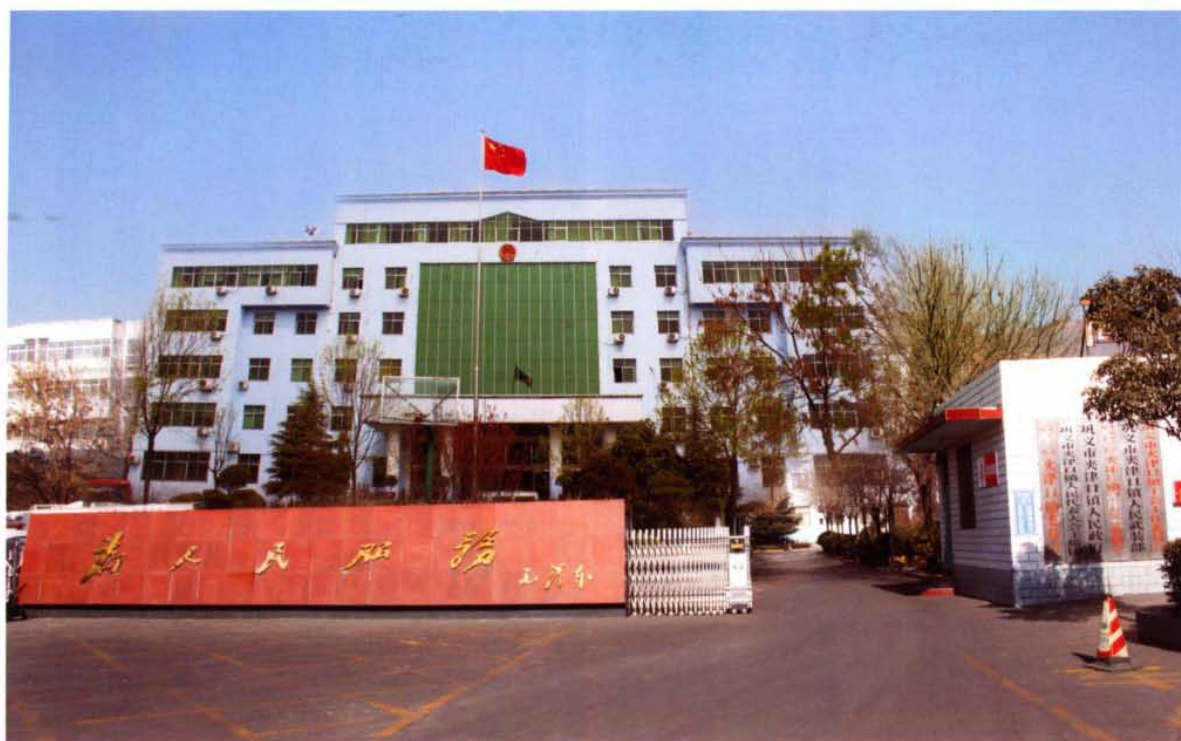
夹津口镇人民政府