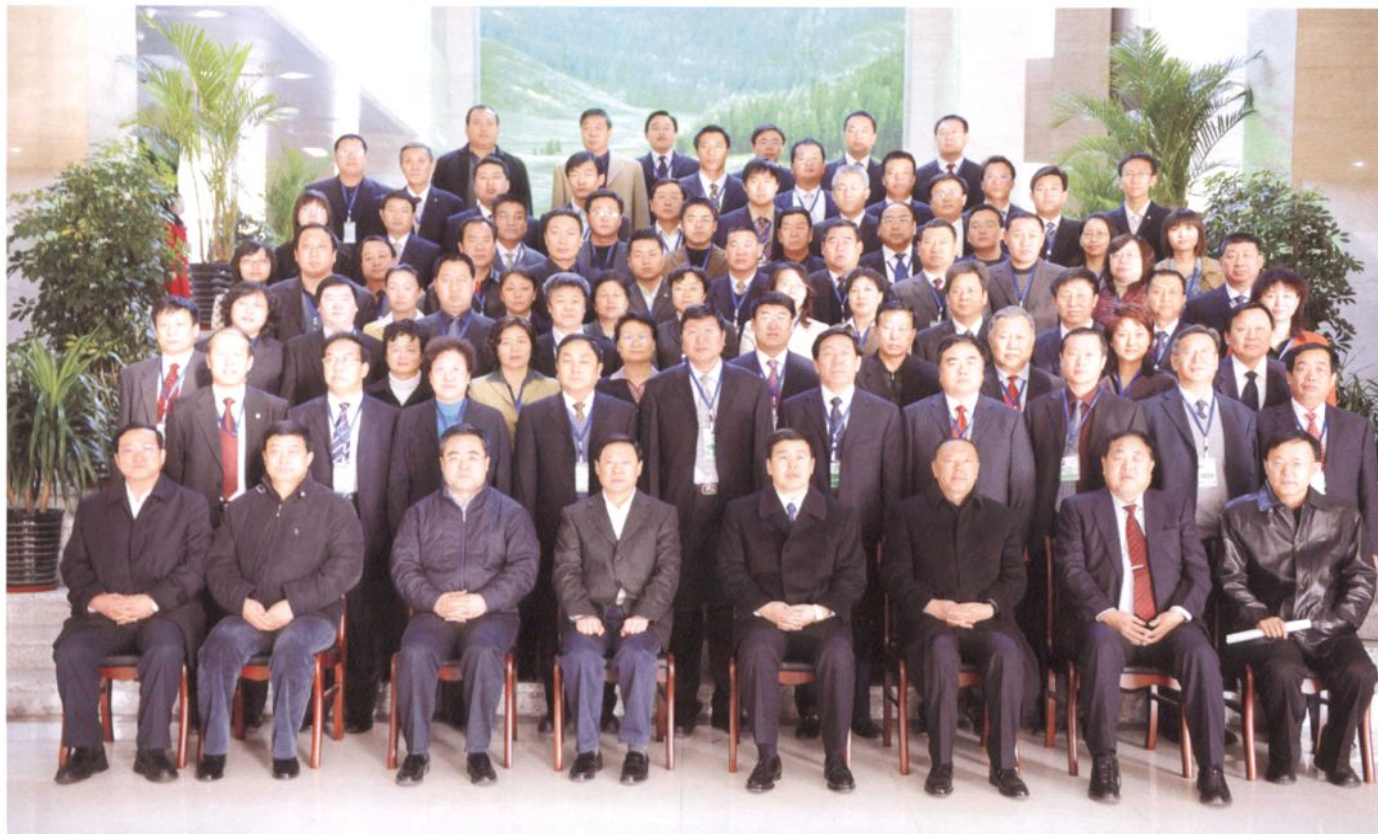
自治区党委书记储波(前排左四)、自治区政府主席巴特尔(前排左五)等自治区领导与自治区环境保护局机关干部及直属单位领导合影。