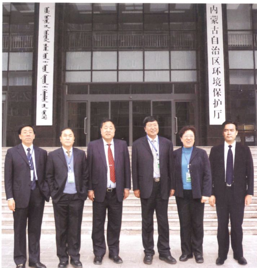
内蒙古自治区环境保护厅领导班子