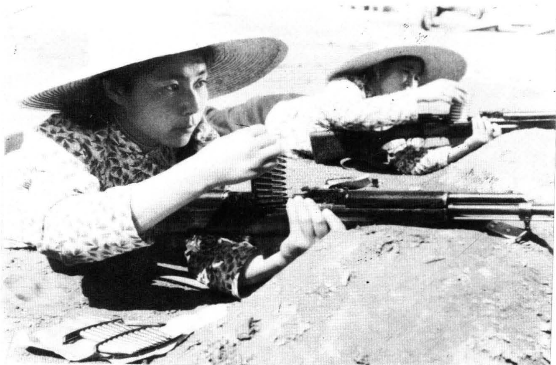
1964年6月15日刘延凤同志在北京西山向毛主席等党和国家领导人进行军事射击汇报表演时的情景。