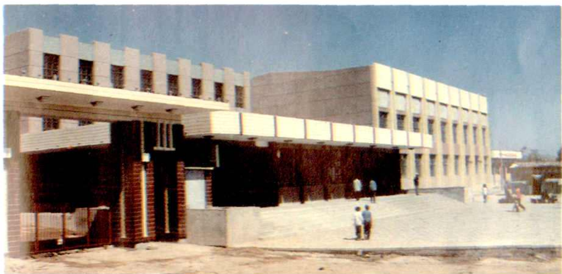
阳方口汽车站