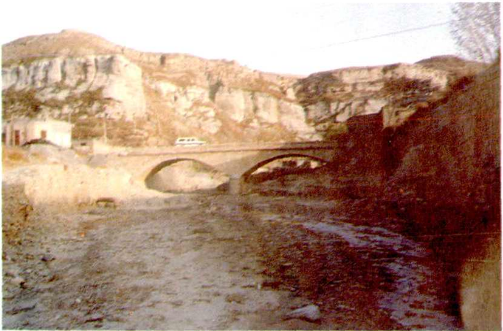
全区第一座悬砌拱桥——保德郭家滩桥