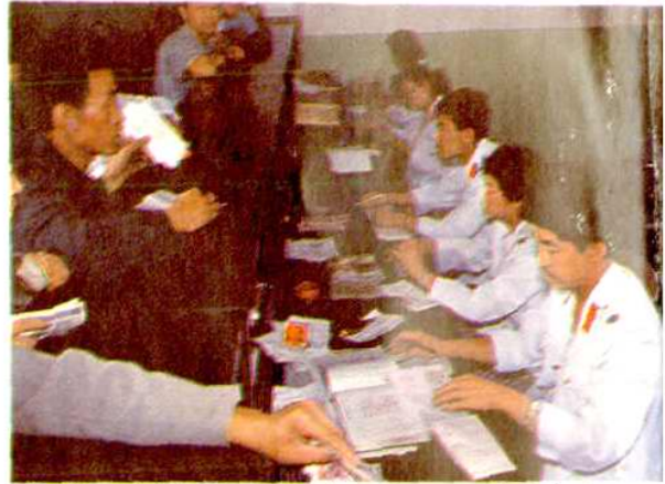
征费人员在办理室内业务