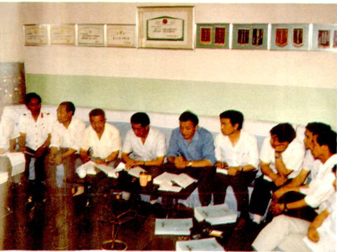
忻州地区交通局史志编委在审阅交通志稿