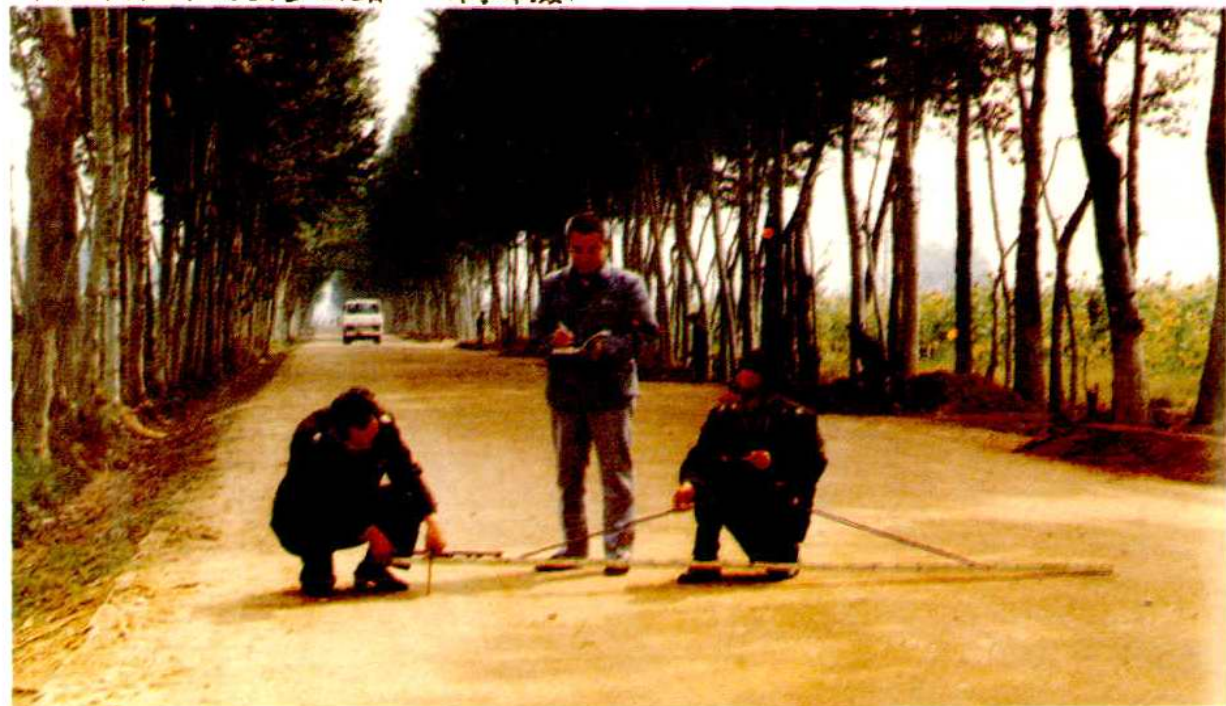
自查自检中的县乡公路