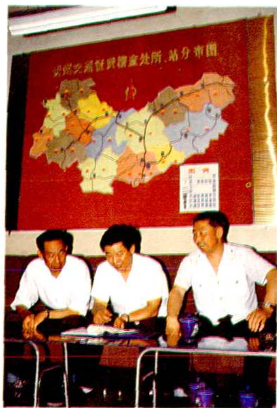
征费处领导在安排工作