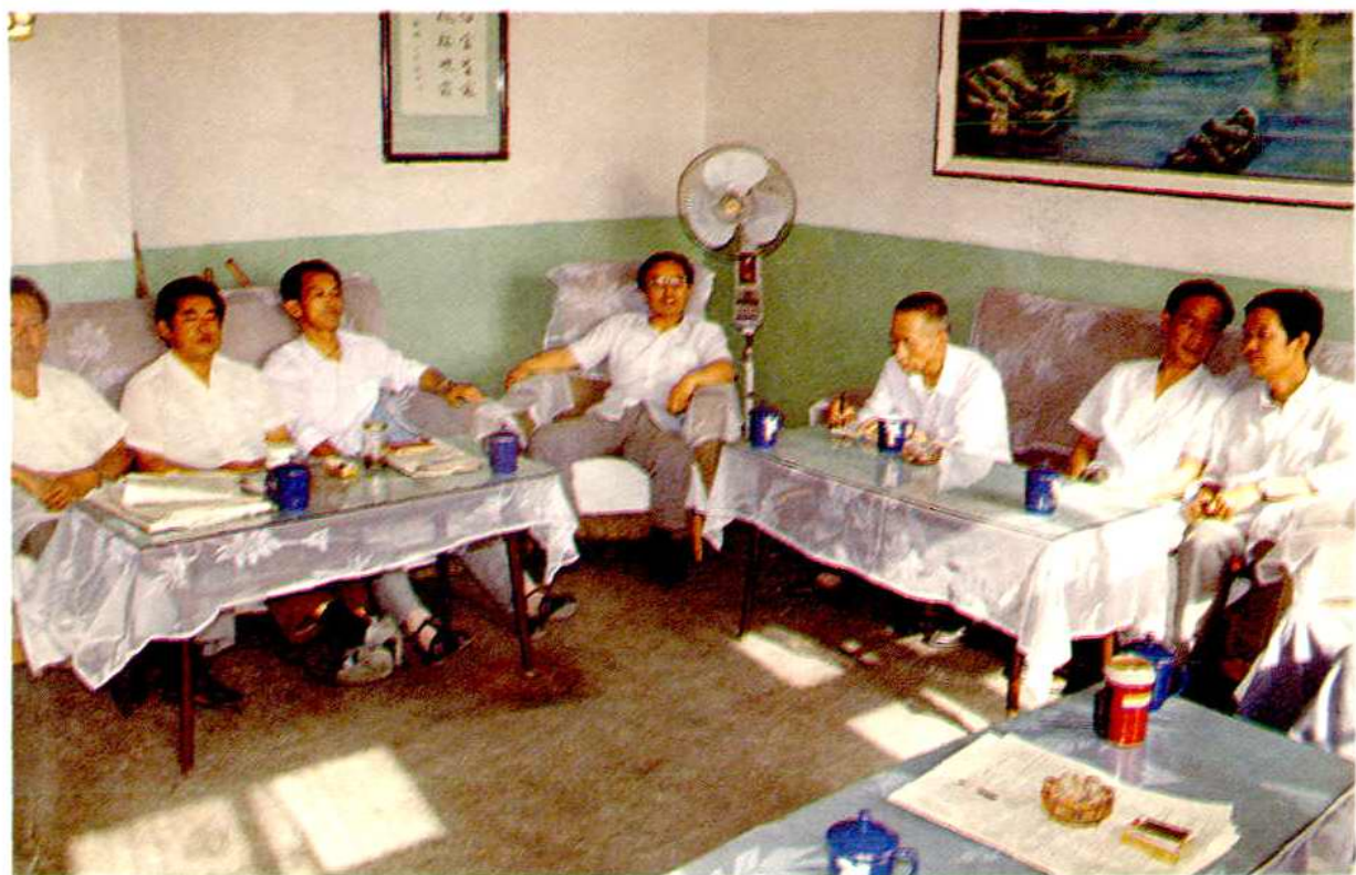
忻州公路分局在研究新形势下的干线公路建养