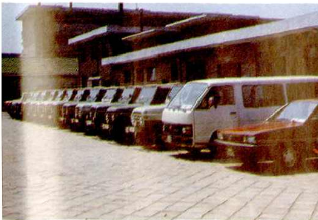
征费处使用的交通工具