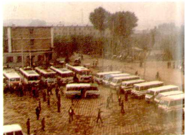
个体客运站(点)