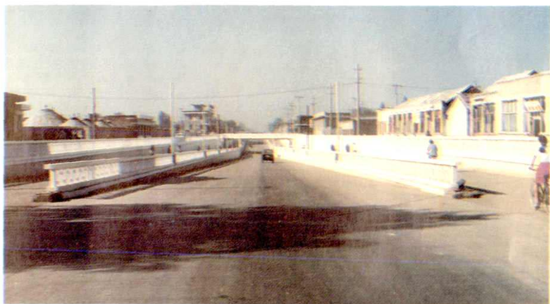
原平立交桥