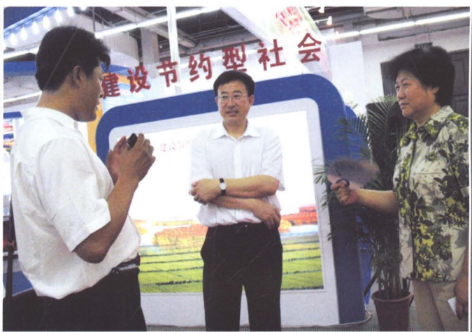
2007年7月2日，盘锦市委书记陈海波、市长陈淑珍到处调研指导工作