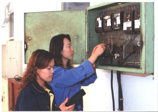
加强用电稽查，杜绝电量流失