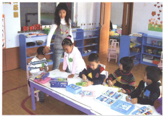
重视幼儿教育，打造幼教品牌