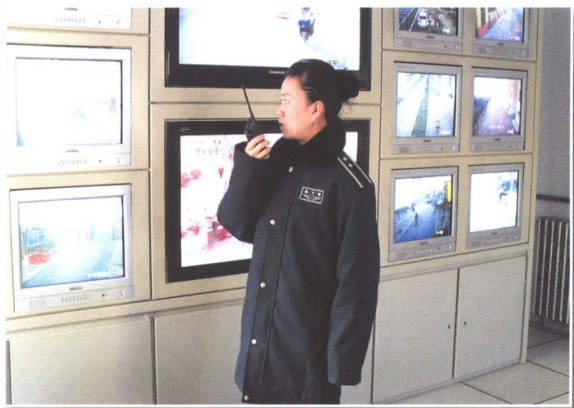
“人防、物防、技防”三结合，建设平安和谐矿区