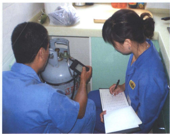
保障小区居民安全用气