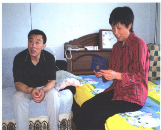
关心困难职工生活