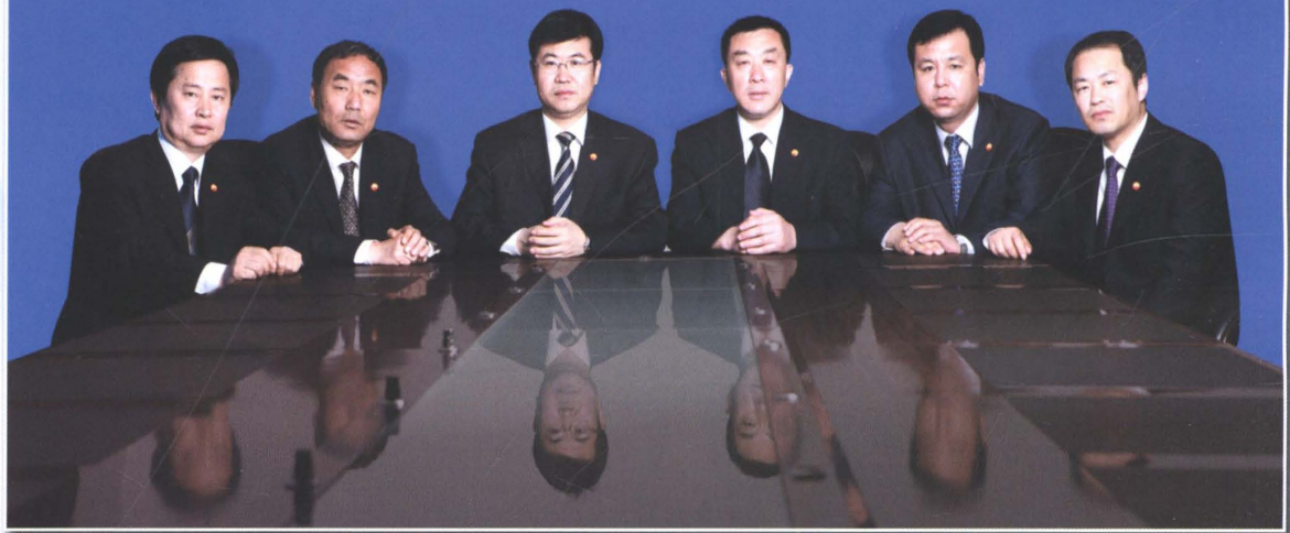
团结奋进的处党政领导班子