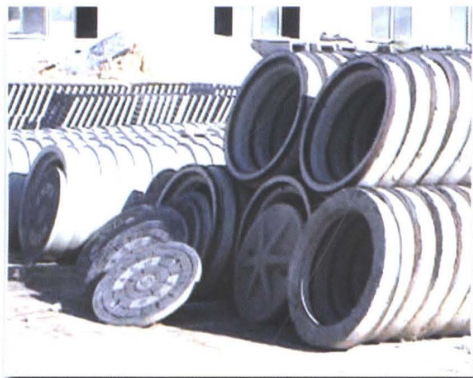
多种经营企业成为事业 处新的经济增长点