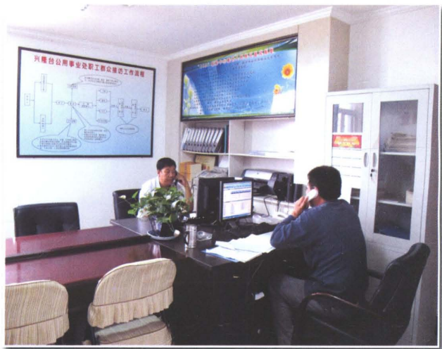
科学管理，保证处生产正常运行