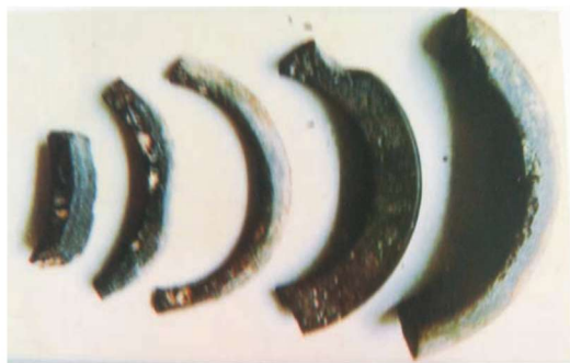
王家河出土的煤玉环（残）

煤玉打磨制作货币，历史相对较短，且是黑陶文化时期的翘楚，随着冶铜技术的发展和青铜时代的来临，玉石为币之消亡，它也完成了历史使命。