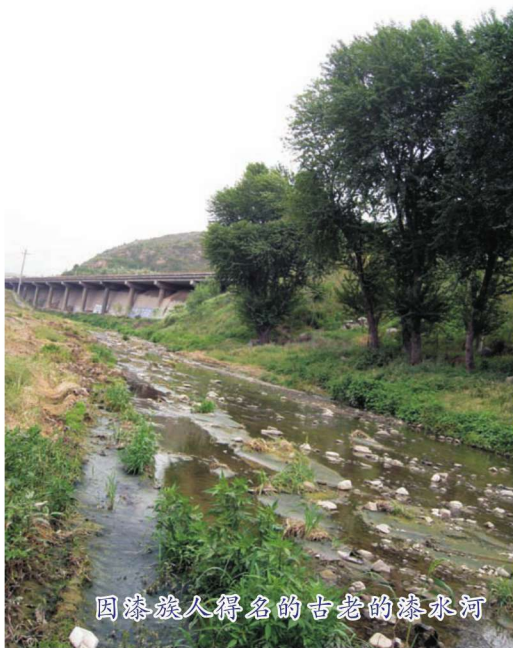
因漆族人得名的古老的漆水河

铜川漆水一名漆水河，就因漆族在这里居住而得名。铜川最早的县建于秦统一六国前，名漆垣县，垣意为墙，引申为宫室、城池和官署，意思是漆族人居住的地方。漆垣县属上郡，管辖的范围在今印台区和宜君、