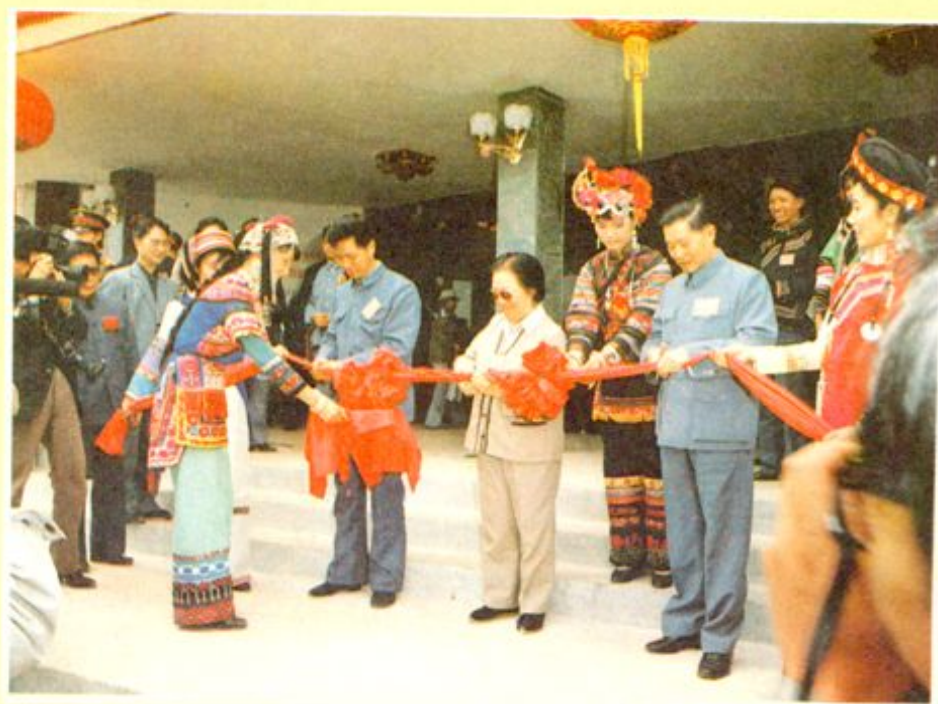
州庆期间，全国彝族服饰展 在楚雄展出。图为剪彩仪式。