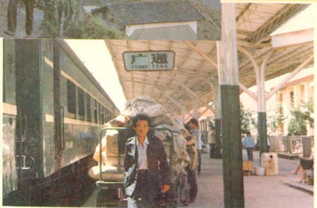
→ 全国先进邮电单位