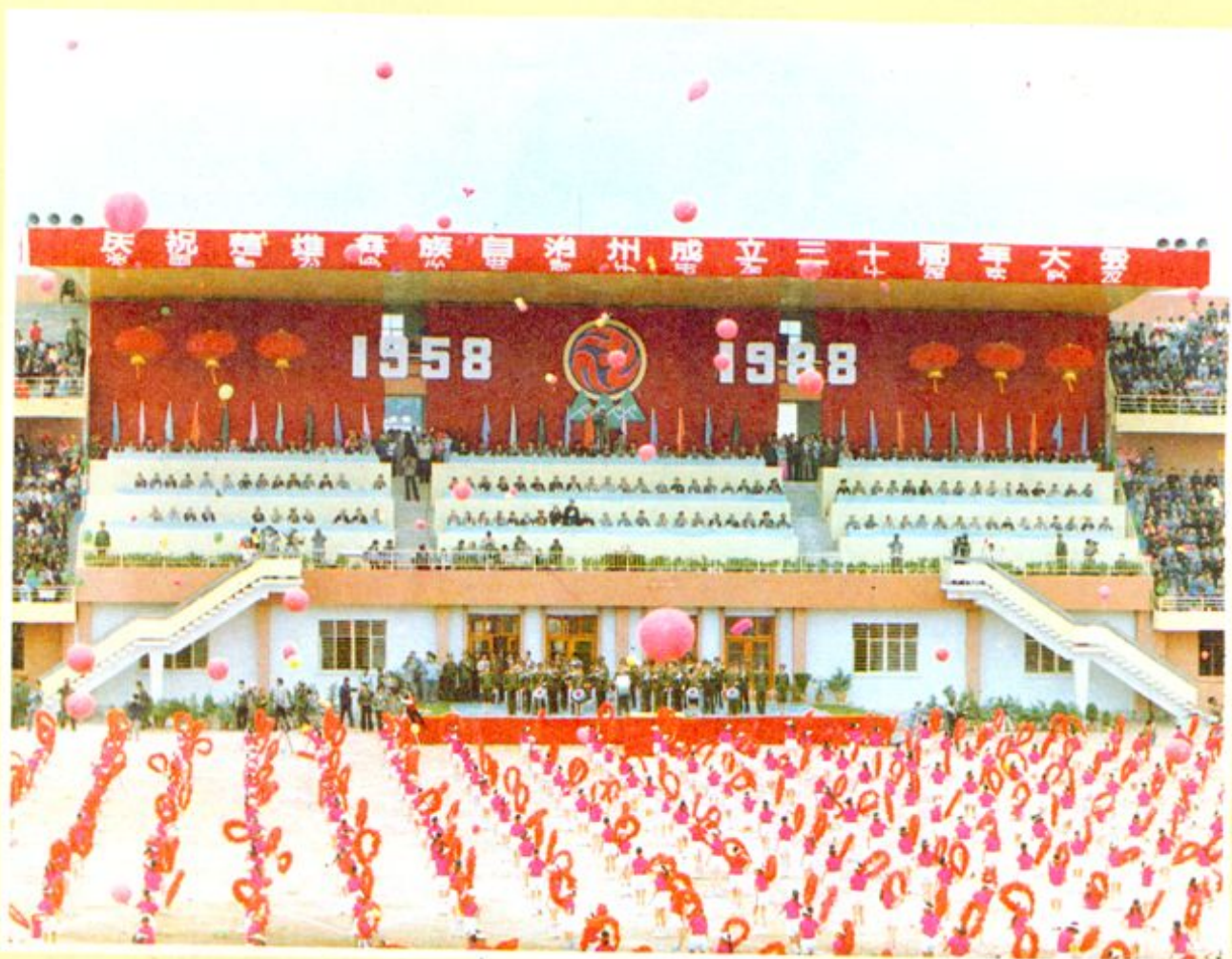
楚雄彝族自治州成立三十周年庆祝大会会场