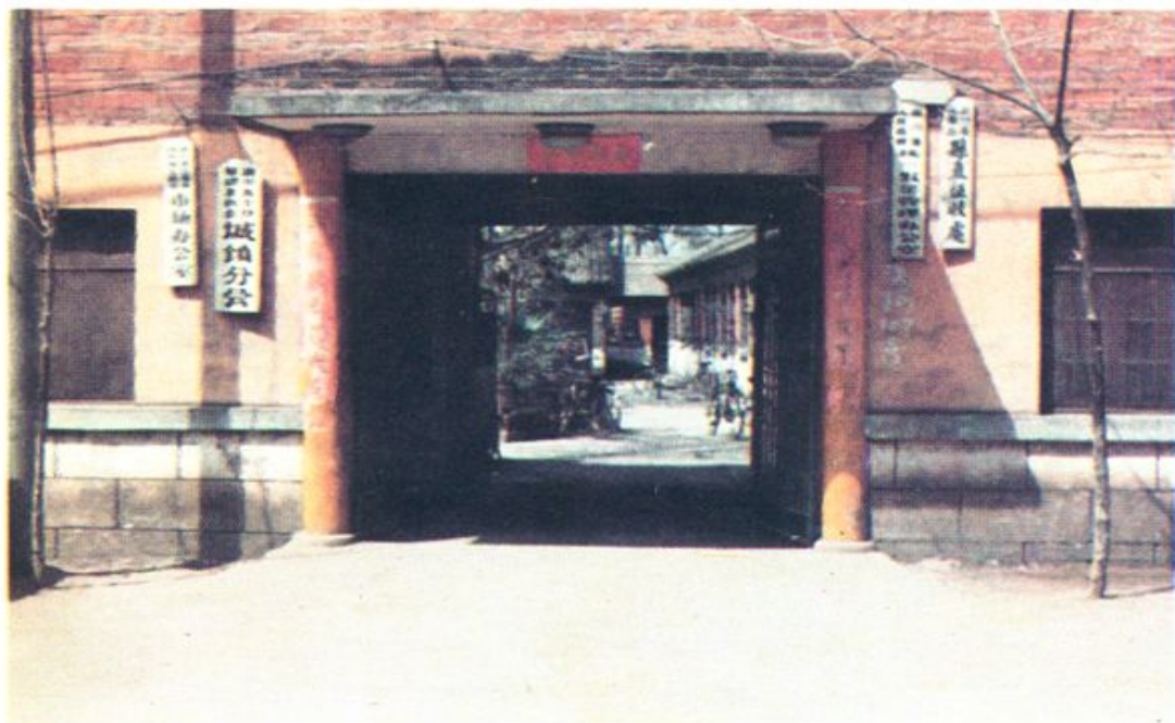
县直征收处（县局旧址）