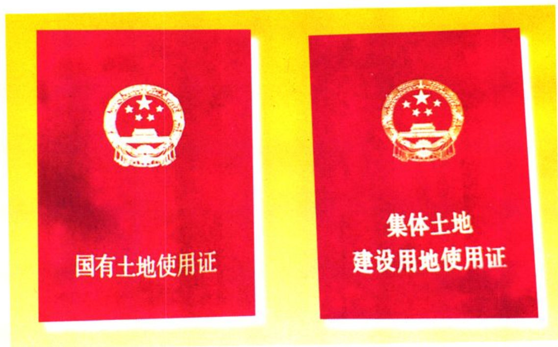
1989年至1996年底的土地使用证