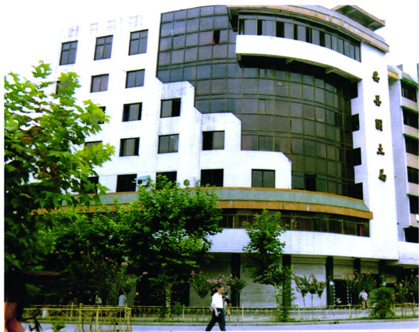
安县国土局办公大楼