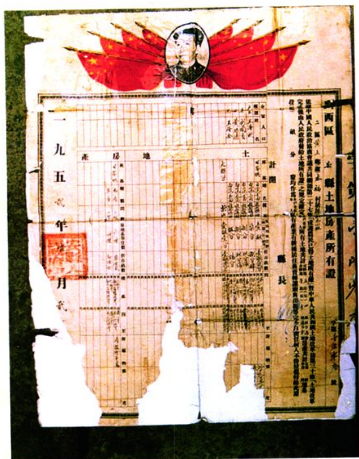
解放初期，土地使用证