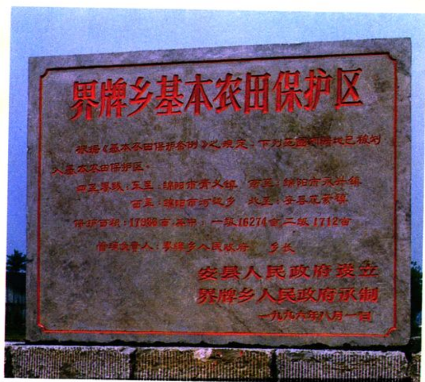
安县采取有效措施，实施《基本农田保护区规划》，切实保护划定的基本农田保护区