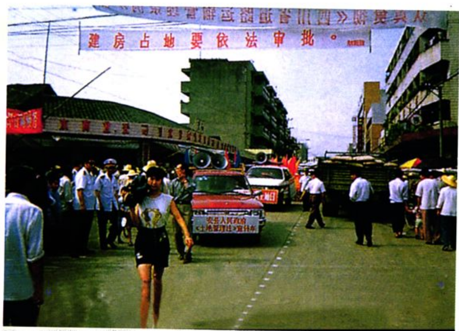
安县历来重视国土宣传工作。瞧，县人民政府的宣传车在场镇进行土地管理“两法”宣传