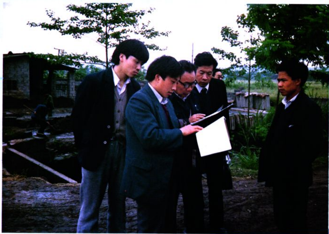
省、市国土局领导来安县实地检查土地详查工作