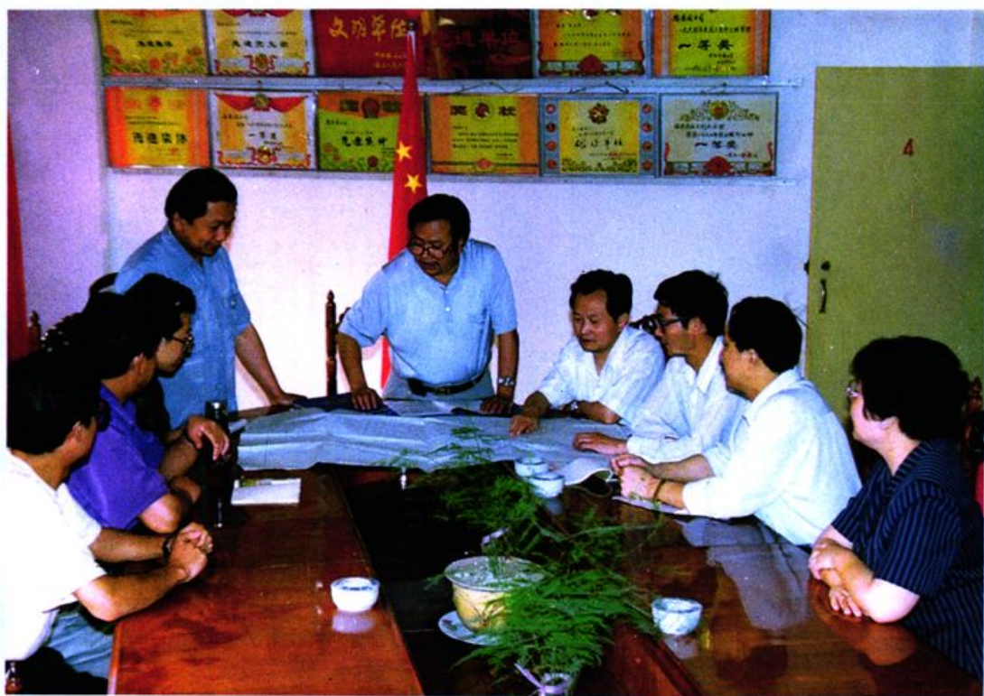
安县人民政府土地统征办全体人员正在研究建设用地统征工作