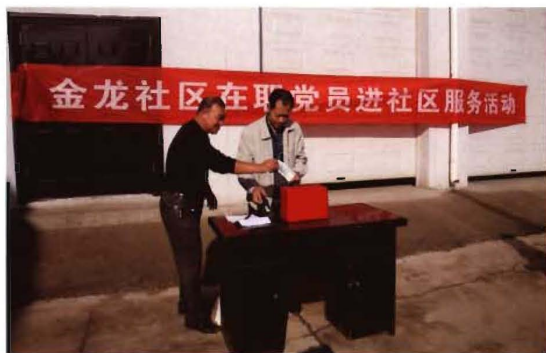
2012年,孟县交通运输局开展在职党员干部进社区捐款慰问活动