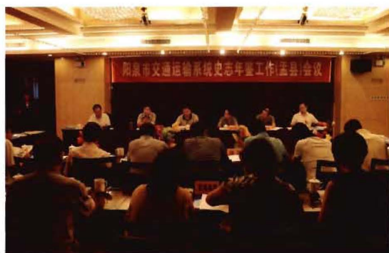
2013年8月2日,阳泉市交通运输系统史志年鉴工作(孟县)现场会议