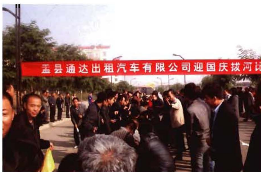
2012年9月30日,孟县通达出租汽车有限公司迎国庆拔河比赛