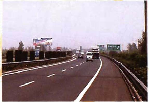
2013年3月20日，国道207线孟县段改扩建工程竣工通车