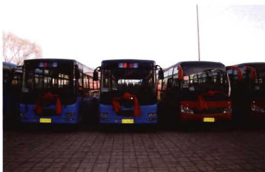
2013年12月31日,孟县首批47辆新能源公交车正式运营