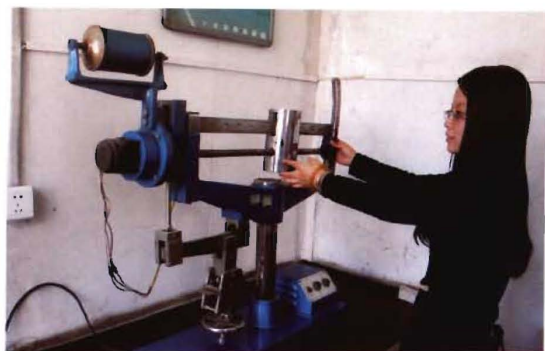
2011年，孟县交通运输局水泥混凝土强度试验