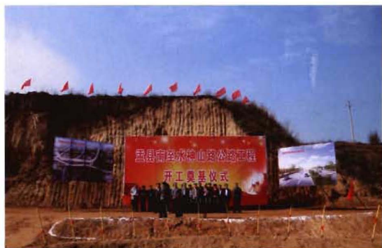
2012年6月19日,孟县南至水神山路重点公路建设工程开工奠基