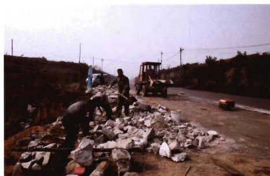
2011年,孟县交通运输局养路员工修复排水系统