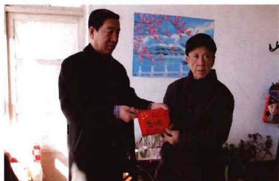
2011年,孟县交通运输党支部春节慰问特困职工