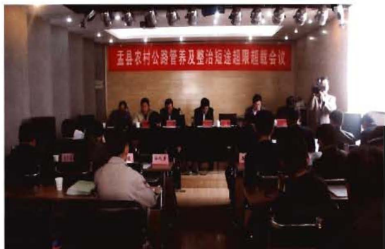
2012年4月15日,孟县交通运输局部署农村公路管养工作