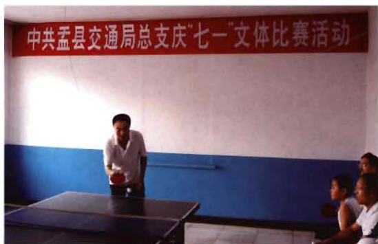
2011年6月30日,孟县交通局总支部举办庆七一文体比赛活动