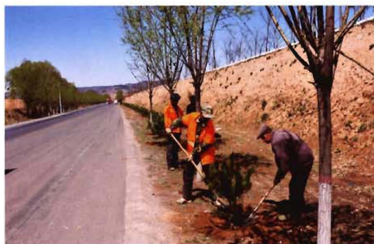
2012年,孟县交通运输局养路员工进行县公路路肩整修绿化