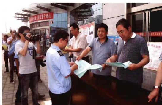
2012年6月10日,孟县交通运输局组织文明创建宣传活动