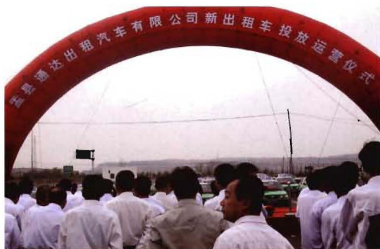
2011年5月7日,孟县130辆新增出租汽车投放运营启动仪式