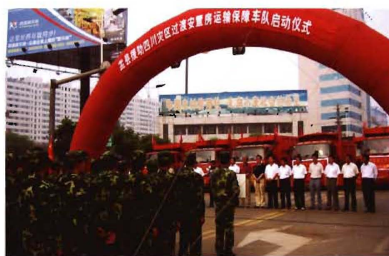
2008年7月8日,孟县交通运输系统援助四川灾区过渡安置房运输保障车队起程