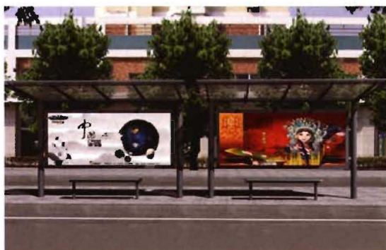
2012年,孟县新建的县城公交候车亭