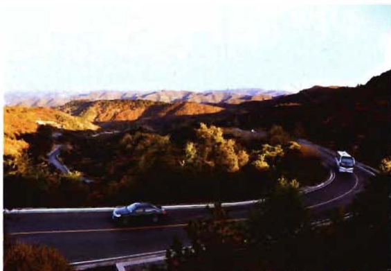
2012年,省道孟榆线孟县五里坡环山公路