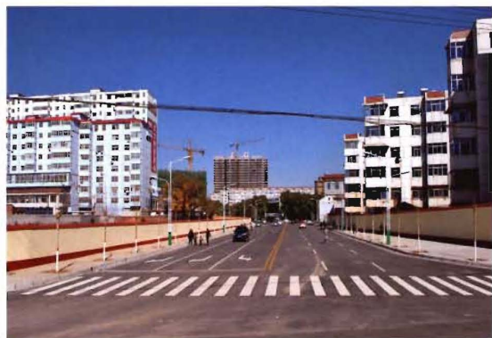
2012年,孟县县城藏山南路段