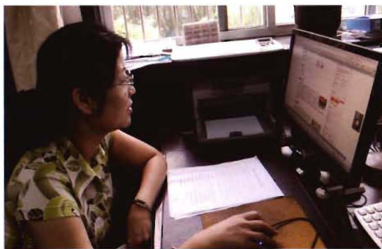
2012年6月10日,孟县交通运输局发布工程廉政承诺书