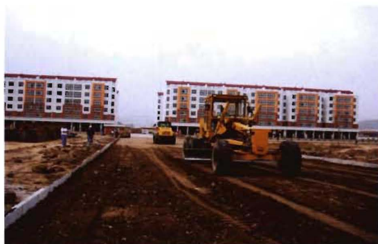
2009年,孟县村通公路路基施工现场