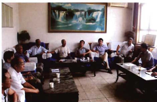
2011年,孟县交通运输局赴上社镇开展党员干部下乡驻村“六个一”活动