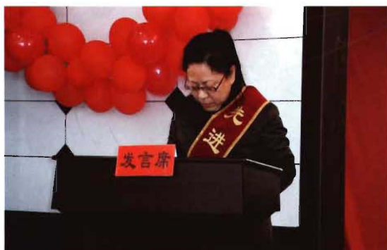
2012年1月,先进个人表态发言