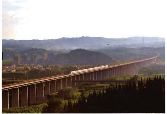
2009年4月1日，石太客运专线建成通车，途经孟县城武特大桥