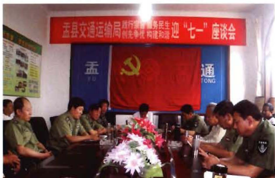
2012年6月30日,孟县交通运输局召开纪念七一座谈会