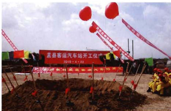
2010年4月22日,孟县客运汽车站开建