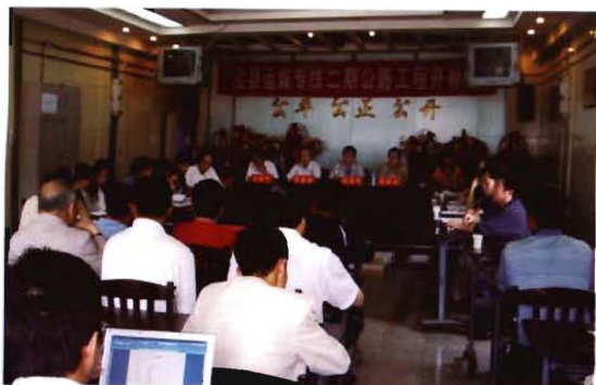
2007年，孟县运煤专线二级公路工程开标现场