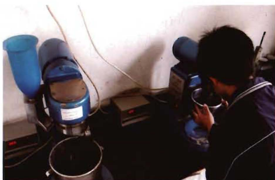
2009年，孟县交通运输局水泥混凝土配合比试验