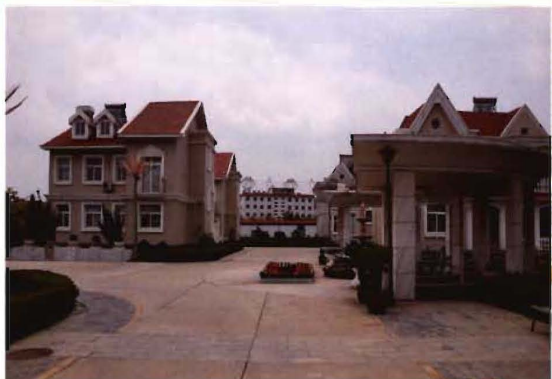
2011年,孟县西小坪村街巷硬化带动新农村 巨变