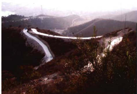
2012年,孟县通村盘山水泥硬化公路