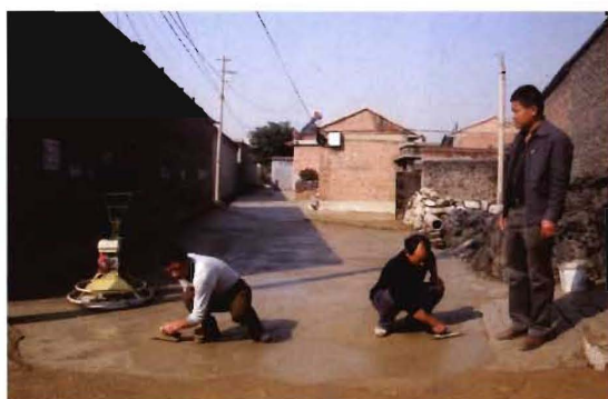
2012年,孟县农村街巷硬化水泥路面施工现场