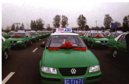
孟县新增的130辆出租车在县城亮相