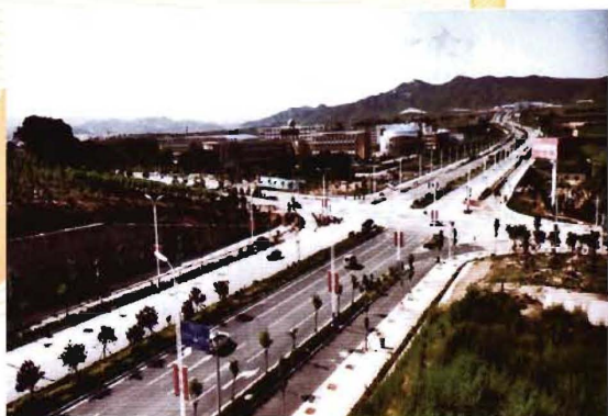
2012年,孟县农村文明公路