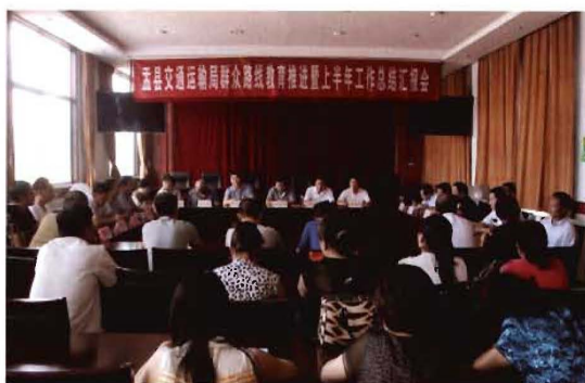
2012年7月13日,孟县交通运输局群众路线教育推进暨上半年工作总结汇报会召开