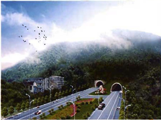
2012年3月6日，太原至阳泉高速公路正式投入运营(图为孟县大南山隧道)