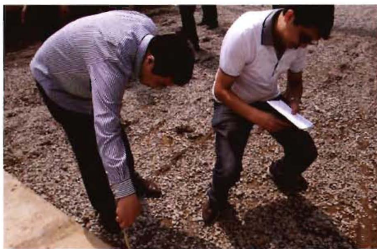
2011年，孟县县乡两级质检人员抽检公路厚度