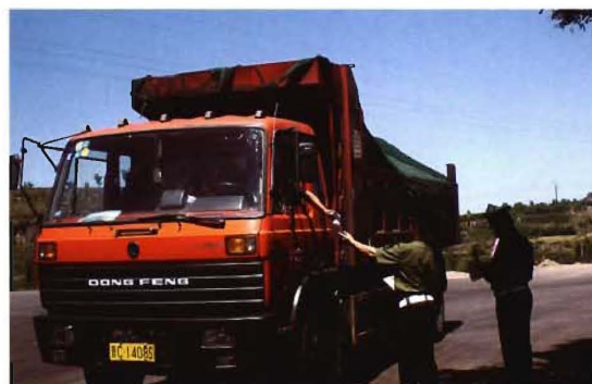
2011年,孟县交通执法人员进行路政稽查