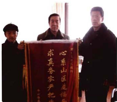
2011年9月,孟县交通运输局接受河北省平山县赠送的锦旗