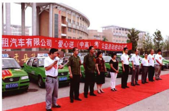
2011年6月6日,孟县交通运输局启动爱心送考活动仪式