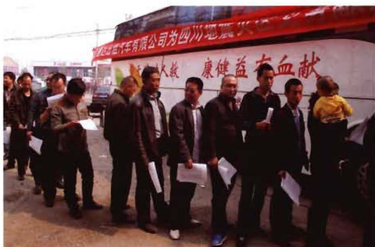
2011年9月10日,孟县交通运输局组织干部职工积极支援灾区义务献血活动