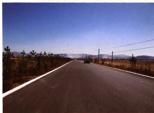
2011年,孟县乡公路西脉线工业园区路