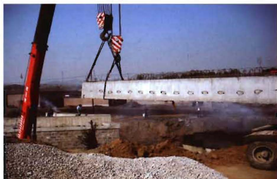
2012年,孟县迎宾大路公路桥梁施工现场