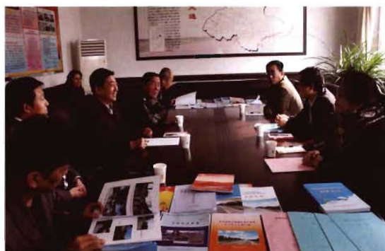
2012年10月28日,市县精神文明建设指导委员会复验孟县交通运输局精神文明创建工作