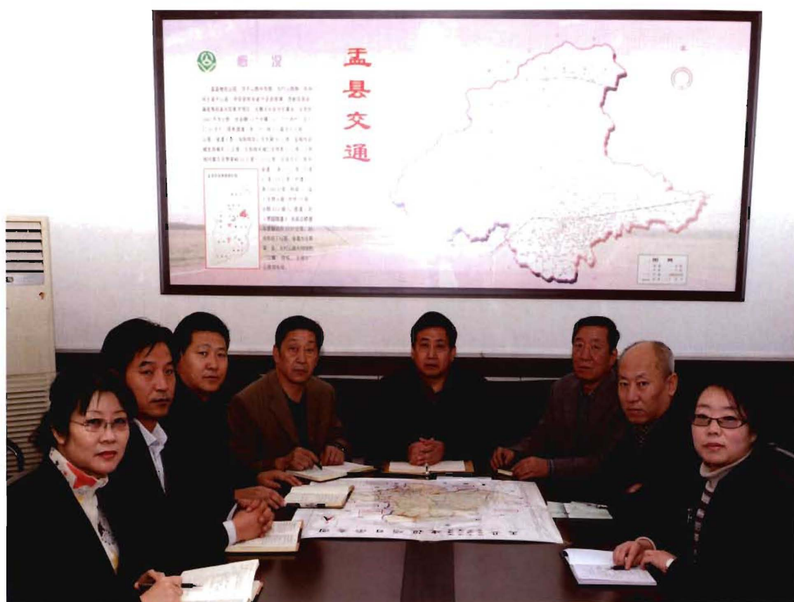
孟县交通运输局领导班子成员