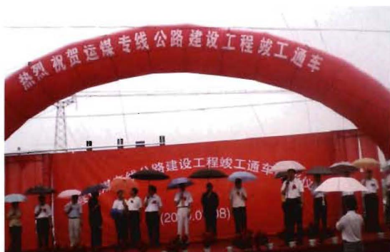
2009年7月8日,孟县运煤专线公路建设工程竣工通车