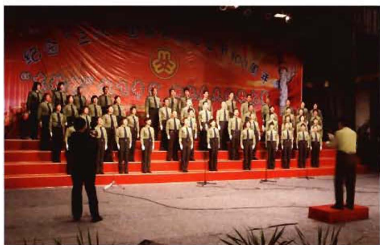
2011年3月8日,孟县交通运输局纪念三八国际妇女节歌咏比赛