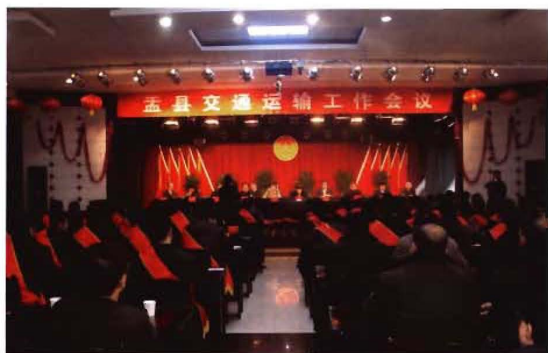
2012年1月9日,孟县交通运输工作会议召开