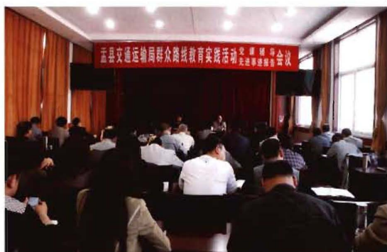
2012年11月2日,孟县交通运输局召开先进人物事迹报告会