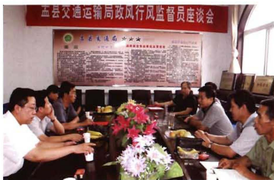
2012年9月2日,孟县交通运输局召开政风行风监督员座谈会