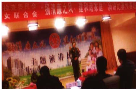
2011年9月2日,孟县交通运输局参加全县组织的“扬清廉之风、建和谐家庭”演讲比赛