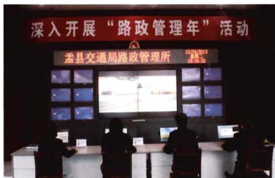
2012年,孟县交通运输局路政实现科技化管理