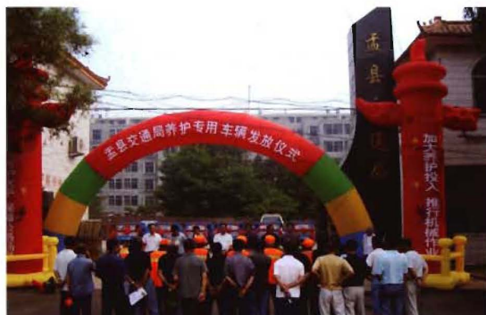
2009年6月,孟县交通运输局发放农村公路养护专用车辆