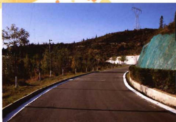
2012年,孟县县公路大熬线生态文明路段