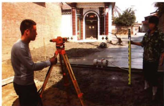
2009年，孟县交通运输局工程技术人员勘测公路