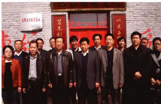
2012年7月1日,孟县交通运输局班子成员及机关股室所属单位负责人接受爱国主义教育