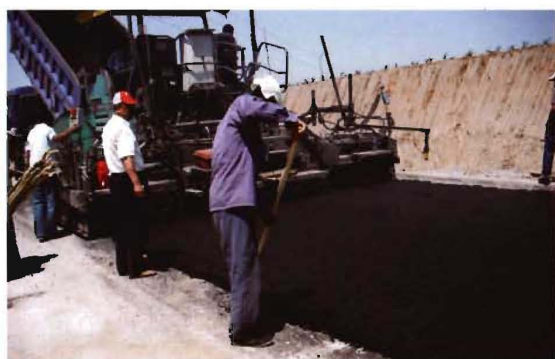
2011年,孟县农村公路改造工程铺设沥青路面