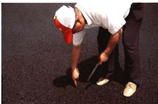
2012年，孟县交通运输局工程技术人员测量公路厚度