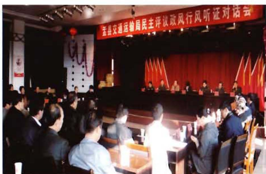
2011年8月5日,孟县交通运输局召开政风行风听证对话会