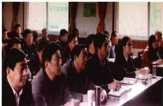
2012年12月30日,孟县交通运输局党员干部观看《失德之害》警示教育片