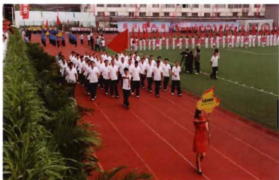
2012年9月6日,孟县交通运输局参加全县首届全民运动会