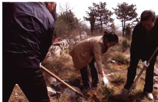
2012年,孟县交通运输局开展义务植树活动