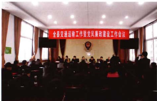
2012年6月12日,孟县交通运输局召开党风廉政建设工作会议