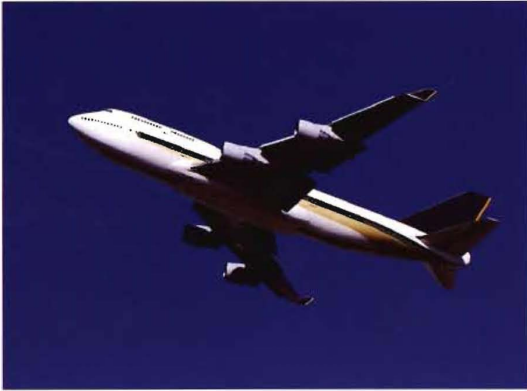
2013年12月18至19日，华北民航管理局组织了山西孟县通用机场的选址评审