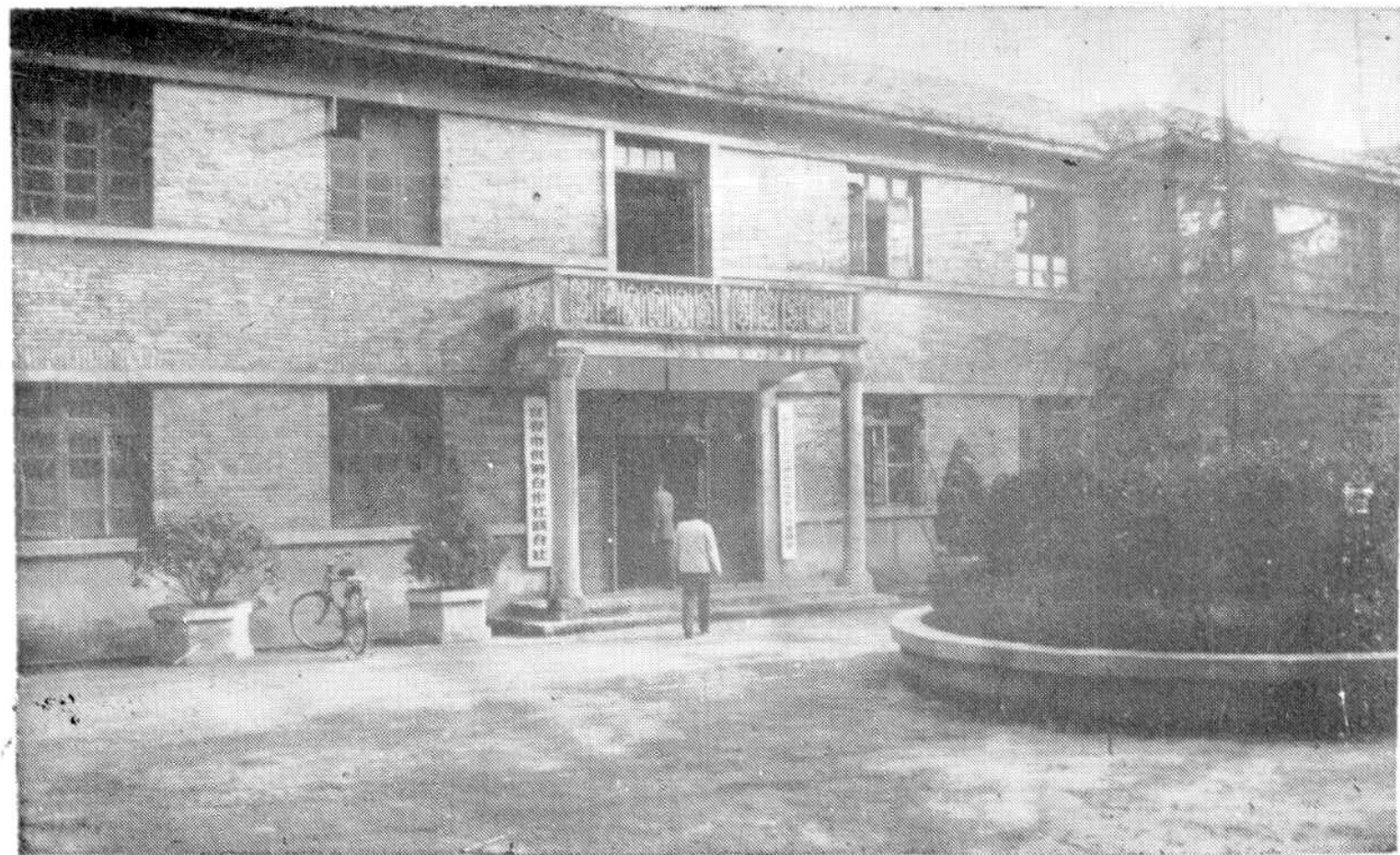
宜春市供销社联合社办公楼