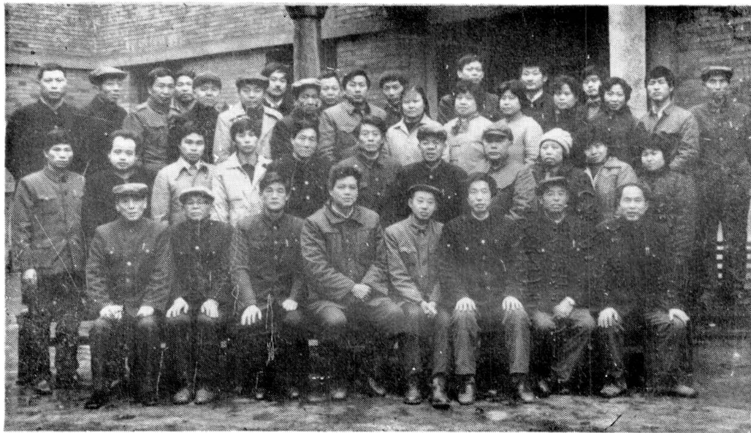
市供销社机关干部职工合影