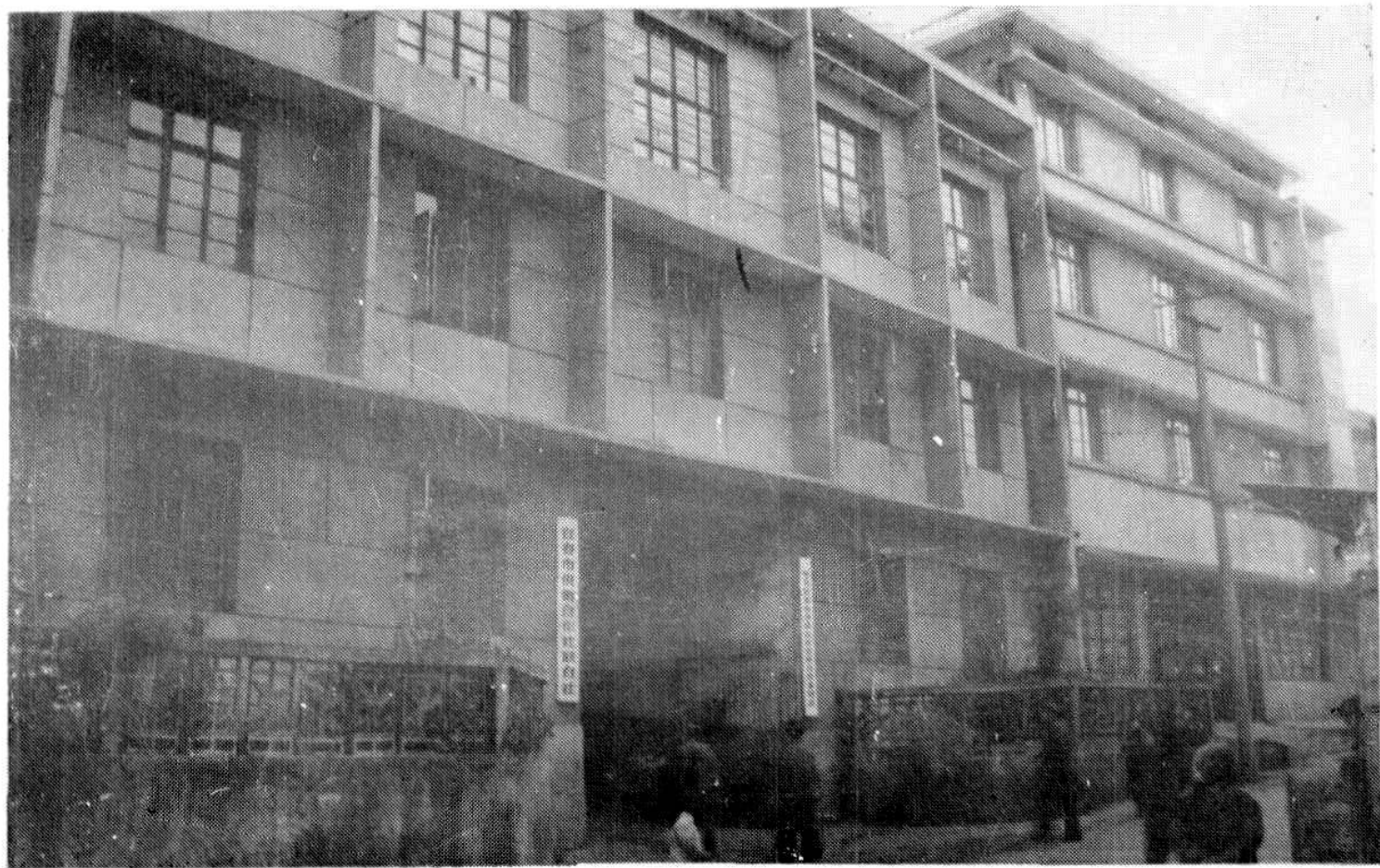
宜春市供销社联合社