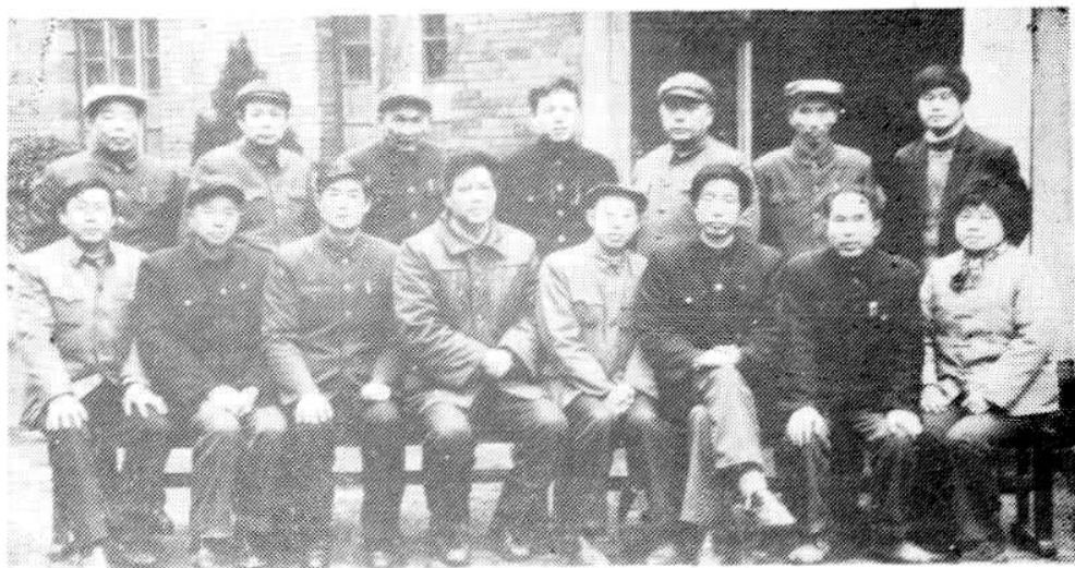
市供销社系统修志领导小组成员