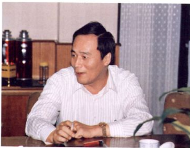
建行总行王岐山行长来行视察工作。