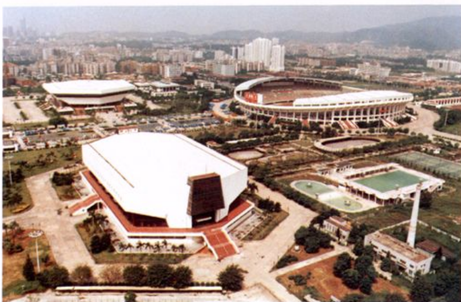
1987年7月建成的广州天河体育中心。