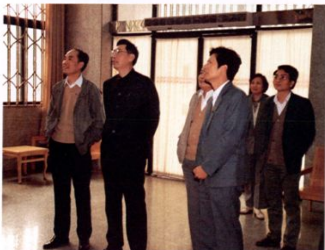
1990年4月，中共广州市委书记朱森林（左二）来行视察。