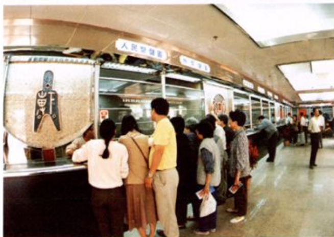
白云支行柜台一角。