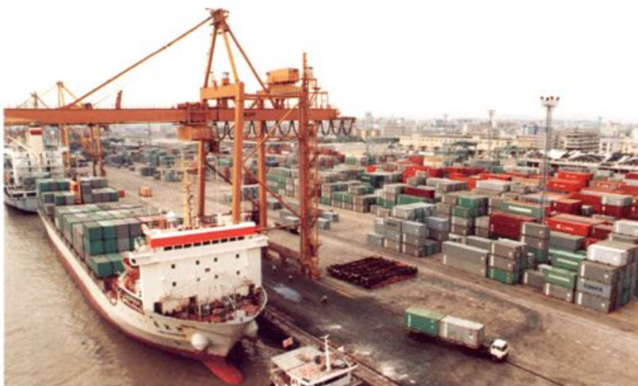
我行经办的重点项目黄埔港是华南地区最大的国际商港。图为1985年10月建成的集装箱码头。