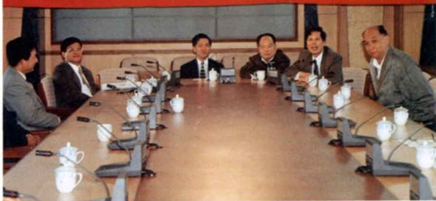
1996年2月5日《建设银行广州市分行专业志》定稿会议在分行会议室召开，图为会场一角。