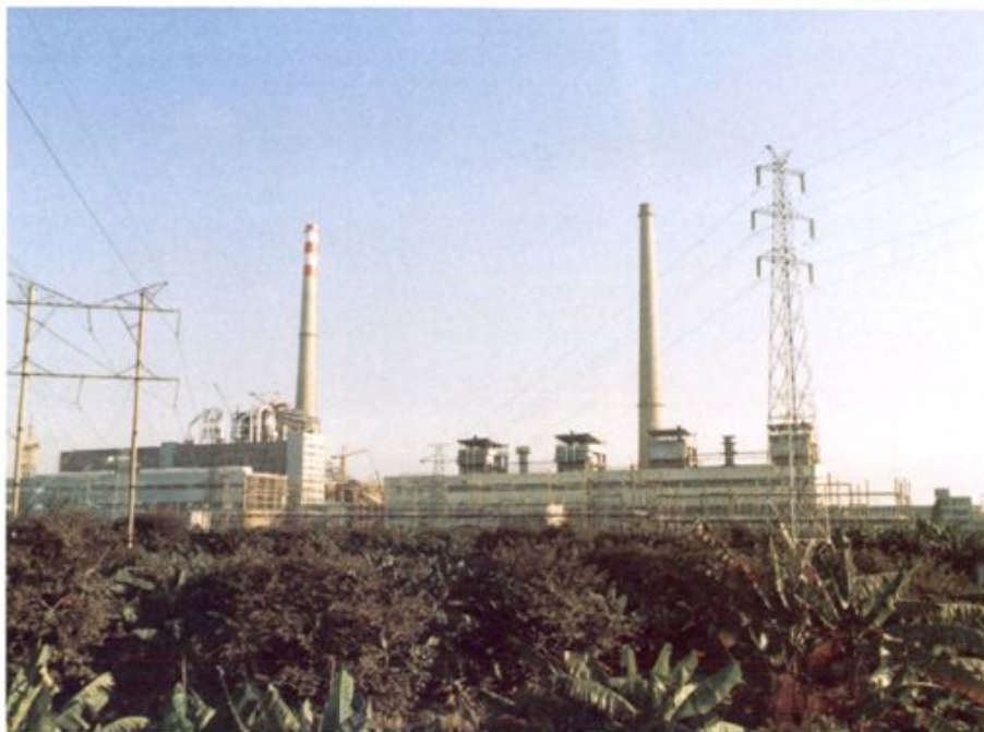
我行经办的重点建设项目黄埔电厂于1979年1月23日建成投产，图为电厂一角。