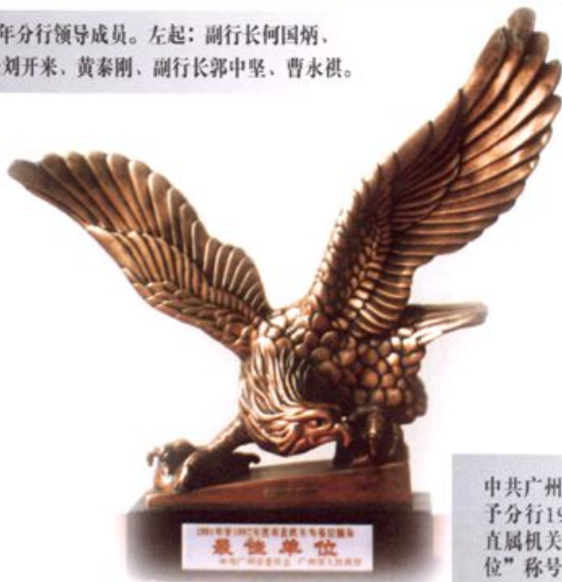
中共广州市委、市人民政府授予分行1991年至1992年度市直属机关“为基层服务最佳单位”称号。