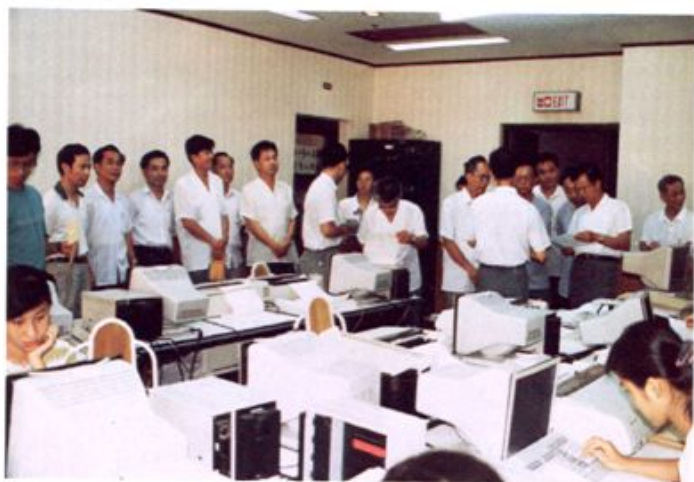
1992年4月，我行承办住房公积金金融业务。图为市公积金监委来行视察。