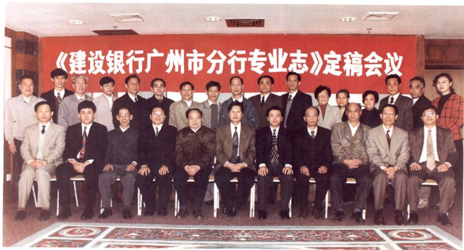
1996年2月5日参加定稿会议的专业志编纂委员会正、副主任，正、副主编，编委委员，编志组成员及特邀代表合影。