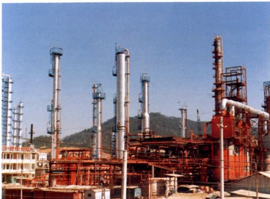
我行经办的重点建设项目，广州石油化工总厂于1978年12月建成投产。