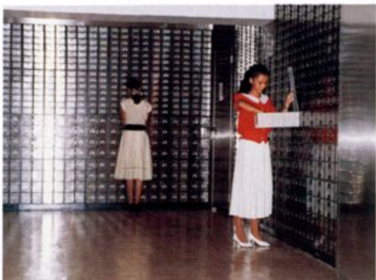
1989年4月，保管箱出租业务正式开办。图为设备一流的保管箱，为客户财产保管提供一流的服务。