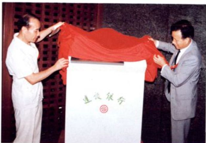
1991年，我行在全国建行系统中首次推出自动柜员机(ATM)。图为建行总行周道刚行长(右)和广州市长黎子流为柜员机揭幕。