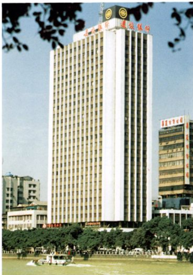
1988年建成的分行办公大楼 耸立在珠江河畔。