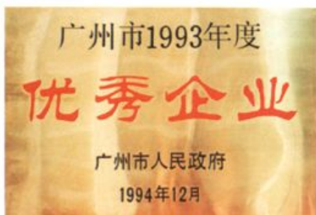
建行广州市分行被市政府评为1993年度“优秀企业。”