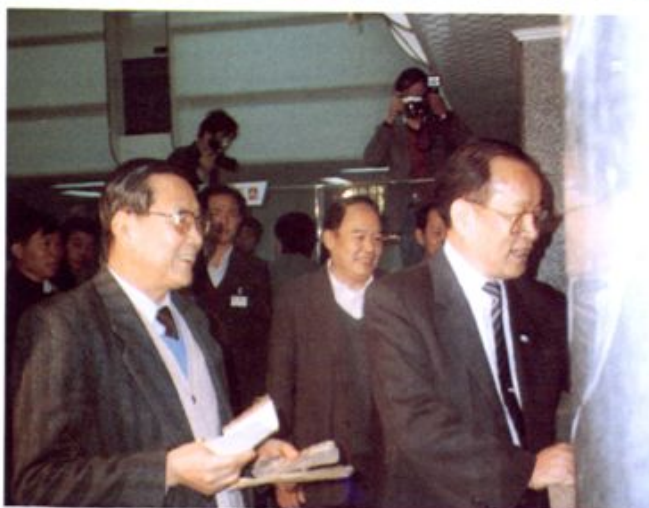
1989年广东省副省长于飞、匡吉到建行二支行购买铁路建设债券。