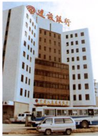
1989年竣工的广州经济开发 区支行大楼。