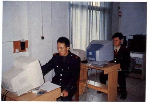
经过几年的努力，全局于2000年实现了无纸化办公。全体职工均能熟练操作微机。到2005年全局微机拥有量达到了人手一台。图为信息中心一角。