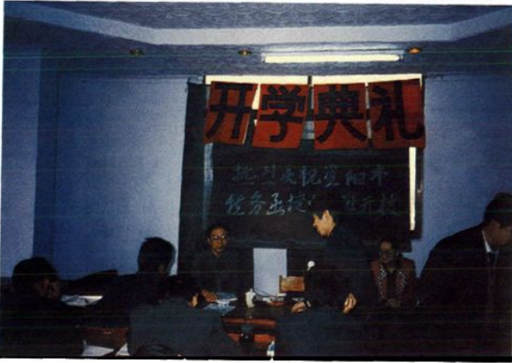
1993年县局承办的税务函授中专班开学典礼