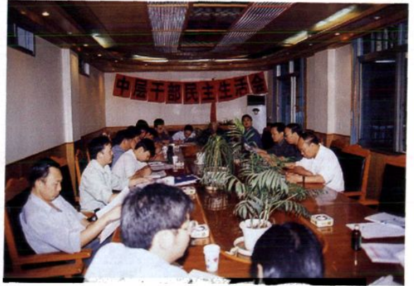
2001年区局中层干部民主生活会